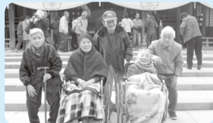
弥彦神社で参拝。今年も良い菊ばかり