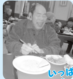
いっぱい 食べたぞ!