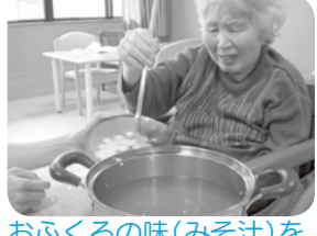
おふくろの味(みそ汁)をご堪能下さい。

ひまわりフロアは、昨秋に改修工事を済ませ、ご利用者が家庭で過ごされるように、ご自分でできることはなるべくご自分でいただくことをケアの方針としております。