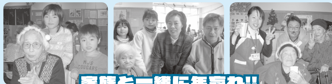
家族と一緒に年忘れ!!