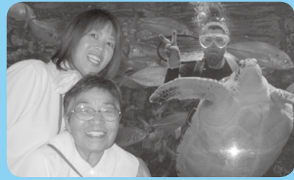
超巨大カメラと記念撮影♡

デイサービス のちよこつ とそこまでツ アー。参加希 望が多く好評 です。今回は 寺泊水族館と ホテル飛鳥に 出掛けまし た。