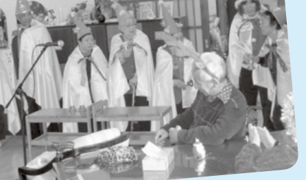
すてきな音色にうっとり...