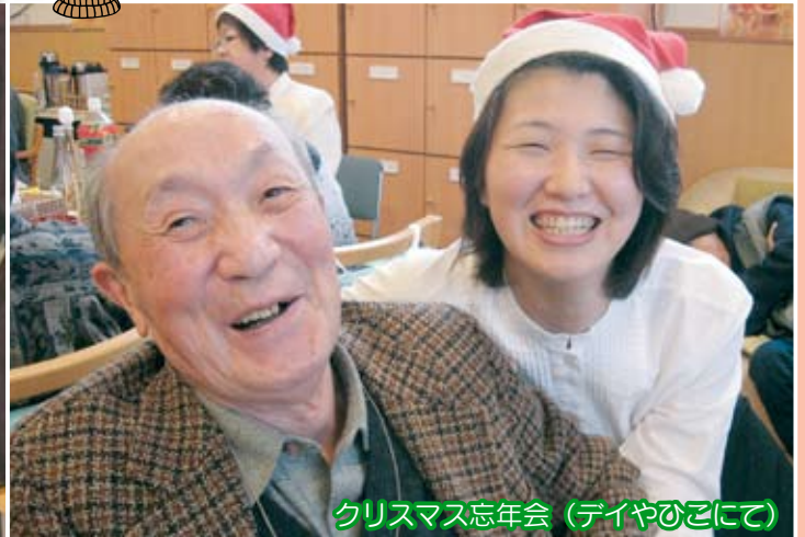
クリスマス忘年会 (テイやひこにて)