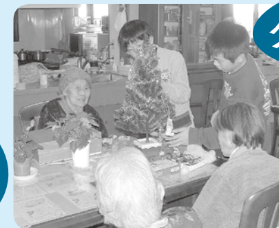
弥彦小学校の皆さんたちと 楽しくクリスマス会