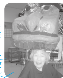
一年が健康で いられますよ うに