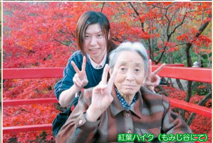
紅葉ハイク (もみじ谷にて)