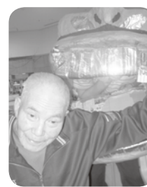
今年も景気よ く行くぞ!!

元日恒例の「分水の 里神社」への初詣です。 皆様一年の願いを込め 絵馬に力強くしたため られました。 この手作りの神社 は、開園当初より皆様 の心の寄り所となつて おられます。