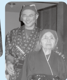
我が家の黄門様!りりしいです!