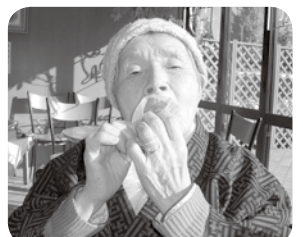
大阪屋にて、「明けの穂」を堪能中！

デイサービスご利用の方に好評な「お出かけ定期便」に限らず、入所の方のご希望に合わせ、外出する機会も多くご好評いただいております。今年も一緒に色んなところへ出かけましょう。