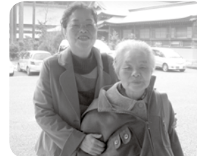
お願いごとはきっと叶うよね～。