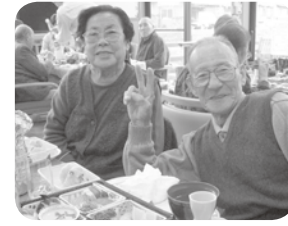
どうぞ、ご夫婦でいつまでも仲睦まじく……