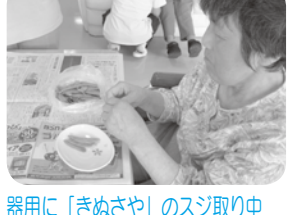
器用に「きぬさや」のスジ取り中

ひまわりフロアは、昨秋に改修工事を済ませ、ご利用者が家庭で過ごされるように、ご自分でできることはなるべくご自分でいただくことをケアの方針としております。