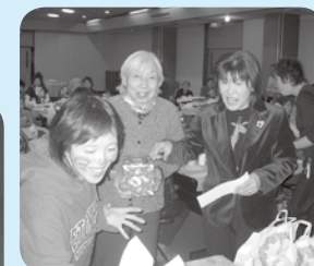
やった~ビンゴ~! 賞品はなにかしら?