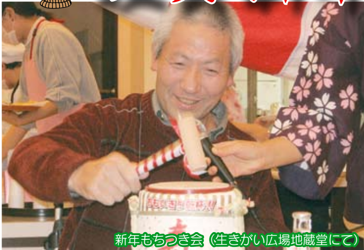
新年もちつき会 (生きがい広場地蔵堂にて)