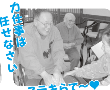
カ仕事は 任せなさい