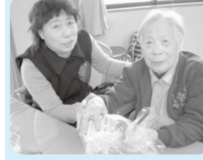
夢ざっしりの福袋もあり