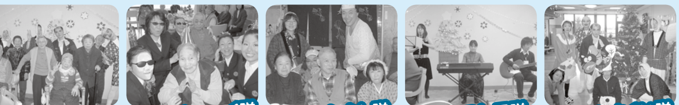
ハイ!!チーズ ランナウェイ隊 遠山の金さん隊 オークストラ隊 どじょうすくい隊 今年も楽しかったです!! みんなで「ランナウェイ」 季節はずれの桜ふぶき クリスマスムード全開 分水の里オリジナル!!

二〇〇七年、皆様のおかげで楽しい一年となりました。 二〇〇八年も笑顔多き一年にしましょう!