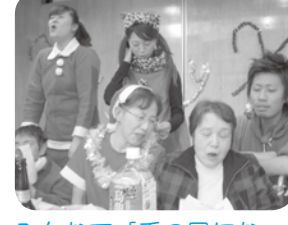
みんなで「千の風になつて」を歌いました。