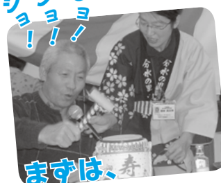
まずは、寿 鏡割りで乾杯!!