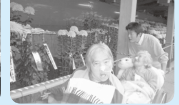
美しいものには、心が惹かれますね。