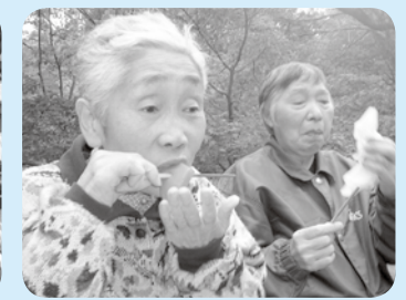
見事な紅葉で、おいしさひとしおです。