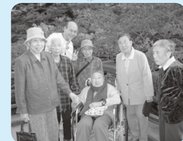
紅葉をバックにハイチーズ!!

晴れた日に、弥彦村の もみじ谷に行つてき ました。「京都の紅葉 よりキレイだ」と皆さ ん喜んでいらつしやい ました。真っ赤なもみ じと色鮮やかな木々、 見事でした。