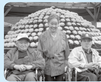
菊の大輪をバックに笑顔は満開です。