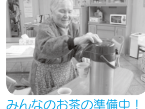
みんなのお茶の準備中！