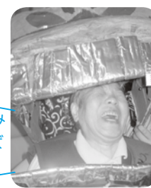
獅子舞に飲み 込まれたてば ね~ガ/VV!