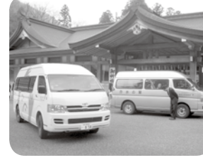
無事終了！来年も一緒に来ようね。