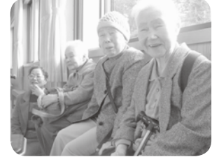
分水の里、生きがい広場の皆様も一緒にです。