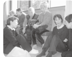
ご参拝前にお願いごとの整理です。