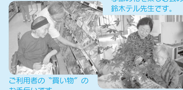
ご利用者の“買い物”のお手伝いです。

桜井の里の特長のひとつに、多くのボランティアの方に来園していただき、ご利用者、そして職員と楽しくかかわっていただく時間がとても多いことがあげられます。たたみものや買い物のお手伝いから、音楽クラブ、アコーディオン歌の会、運動レクリエーションなどプロ顔負けの教室などがあり、特に書道クラブは通算100回も開催されたほどです。もちろん、ひとつひとつ、その場面ごとに笑い、涙、かけがえのない思い出であふれています。