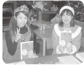
ようこそ！クリスマス忘年会へ！

去る12月18日〜20日にかけてクリスマス忘年会が開催され、ご利用者ご家族、スタッフと大勢でゲームをやり、大盛況でした。また、サンタからたくさんさんの素敵なプレゼント、どうもありがとうございました。