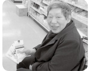
スーパーパコで買い物中！