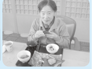
お酒も百薬の長です。