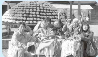
大輪の菊の前でハイチーズ