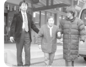
無事終了し、心も体も、とても軽やかです。