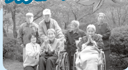
一番見頃の日にってきました