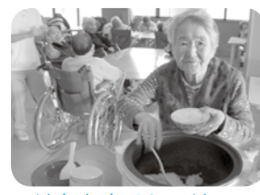
ごはんをよそうのはお任せ下さい！