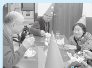
ケーキうんめーねえ。