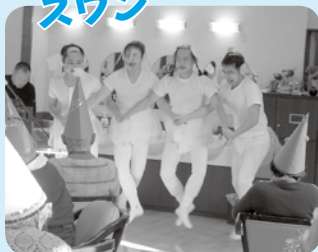
大変見苦しい...いえいえ、 ステキなダンス