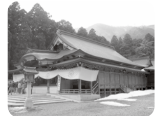
四季を問わず、多くの参拝者で賑わう郷土の誇り弥彦神社

桜井の里の近くに県内の初詣に訪れる神社で、参拝者の一番多い弥彦神社があり、ご利用者、職員合同の参拝も恒例となっております。どうぞ皆様、健やかに一年を過ごしましょう。