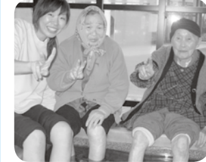
久賀美の足湯にて、足もとポッカポッカ♫