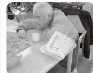
真剣な男の戦い（将棋）です。