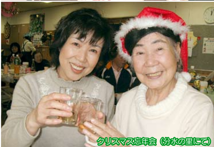
クリスマス忘年会 (分水の里にて)