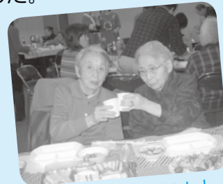
私達もかんぱーい!!