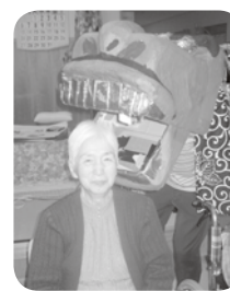
噛まれる事は 邪気を払う、 取り除く意味 があるそうで すよ!