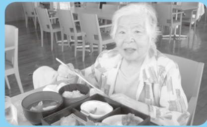
豪華御膳、おいしそう！