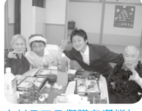
クリスマス御膳を堪能しました。