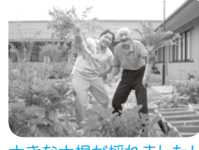
大きな大根が採れました！