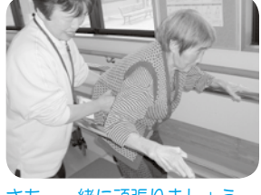
さあ、一緒に頑張りましょう。