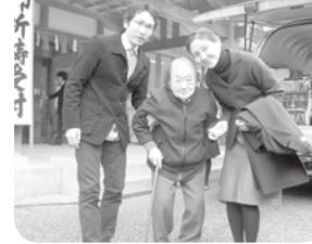
今年も諸願成就、皆様が健やかでありますように