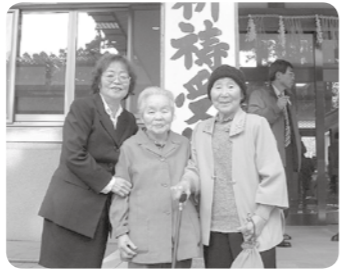
弥彦神社への初詣。