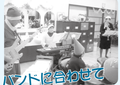
バンドに合わせて 歌いましょう!