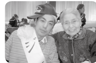
ジエロです。紅白前にきました!