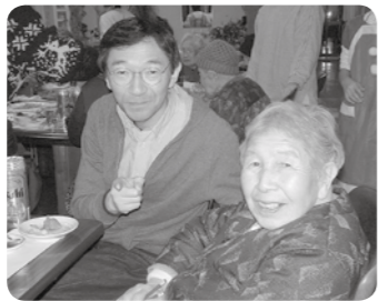
クリスマス忘年会は、ご家族、地域の方、ボランティアの方も一緒にです。