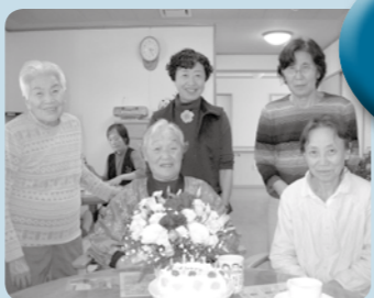
ご家族と盛大に誕生日会!