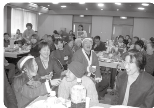
笑顔で今年を振り返りました!