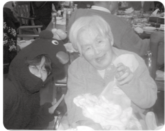
プレゼントありがとう。