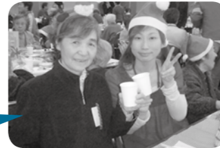
乾杯!なにからたべましょ?