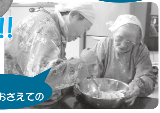
おめさん、 しっかりおさえての