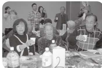
乾杯!いよいよ始まり!