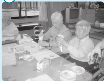
おやつに甘～いお菓子づくり♪