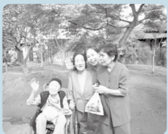
もみじ狩りへ。皆にお土産も買ったよ。