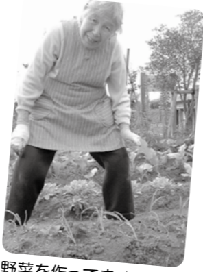
野菜を作ってます