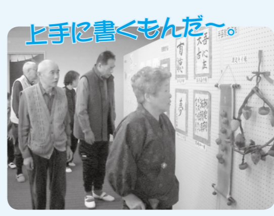
上手に書くもんだ~

明けましておめでとごいびらります。生きがい広場では、お正月にちなんで、様々なものを作りました。