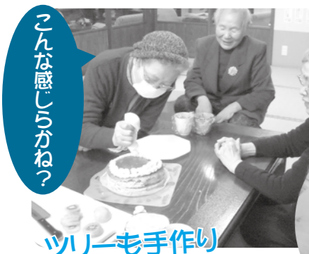
こんな感じのかわさっ