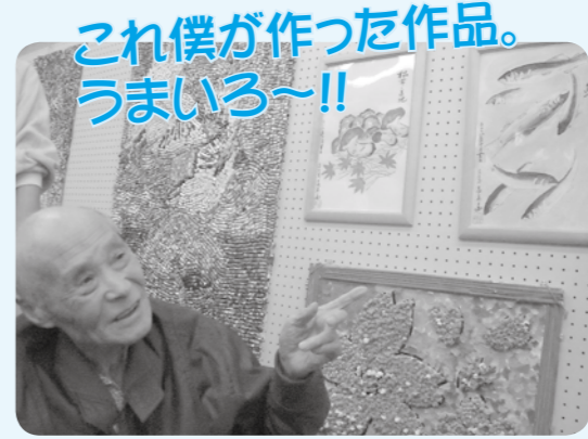
これ僕が作った作品。 うまいら~!!