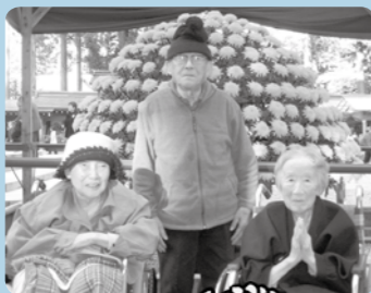
菊に負けず笑顔も満開!