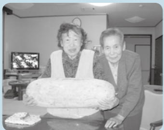
ご近所からの巨大冬瓜、おすそ分けを頂きました。