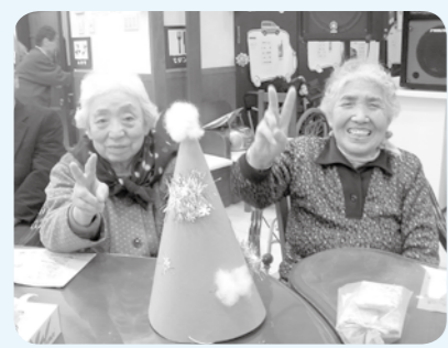
たのしかつたいねえ