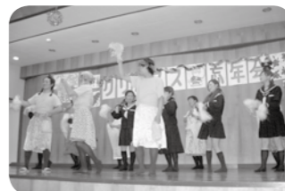
お色気たっぷりサクランボ娘