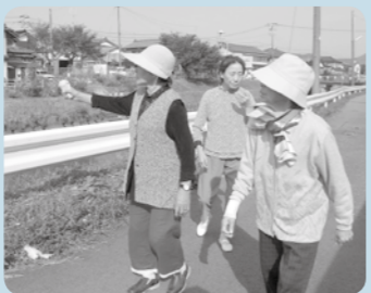
晴れた日は足腰のため、毎日散歩です。