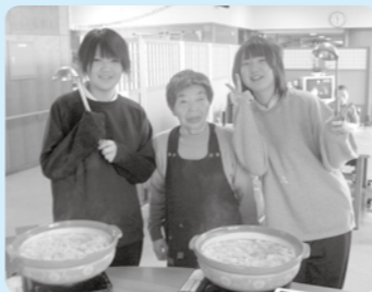
おいしいお鍋ができたがり!!