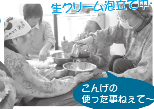
生クリーム泡立て中…