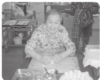
春巻きも手作りです。