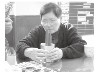
なかなかむずかしいねえ