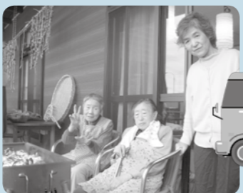
食欲の秋!ベランダで焼き芋。