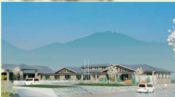
特別養護老人ホーム桜井の里 (平成22年春増床20名分開所予定)

かねてより計画してまいりました桜井の里増床及び改修に係る建設整備事業は、新潟県、弥彦村、そして近隣市町村との調整を重ね、昨年10月末に県費補助の内示をいただき、1月に入札を無事終えました。