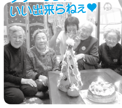
ツリーも手作り いい出来らねえ♥