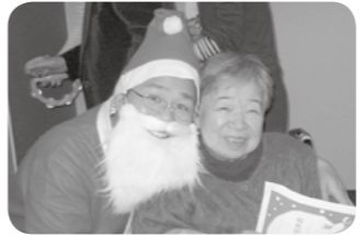
サンタさんのプレゼントにいい笑顔!