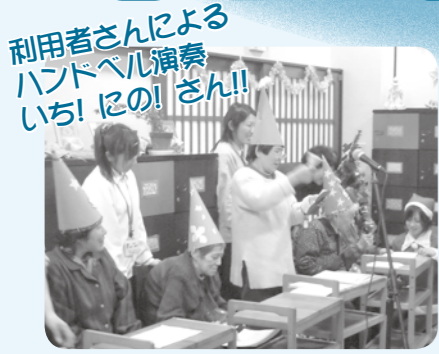
利用者さんによる ハンドベル演奏 いちにの!さん!!