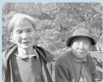
色鮮やかな紅葉と、それに劣らぬ美女です。

日頃の寒さも吹き飛ばし、縁のご利用者には元気ハツラツです。上ん家、下ん家ともにそれぞれの生活を楽しまれています。