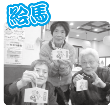
良い年でありますように。

去る12月22日(月)に、クリスマス会が行われました。今回は、「音楽会」と題し、音楽を中心とした、笑いあふれる、にぎやかな会となりました。