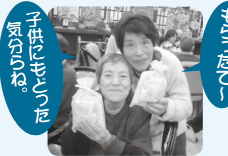
子供にあげた お菓子がね。