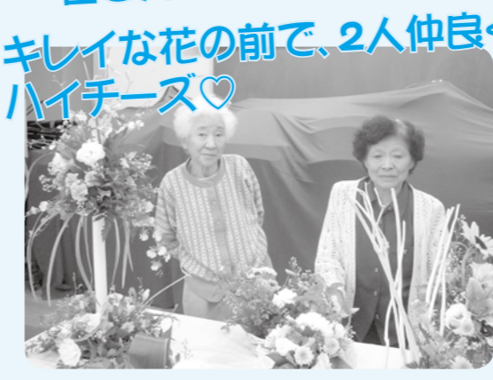
キレイな花の前で、2人仲良く ハイチーズ♥