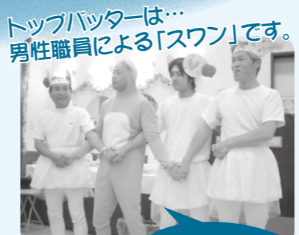
トップバッターは… 男性職員による「スワン」です。