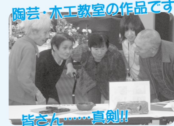
陶芸・木工教室の作品です。