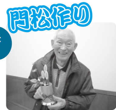
竹もオレが切ったぞ!!