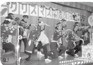
粋な踊りでお祭りマンボー!