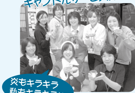
炎もキラキラ 私もキラキラ!