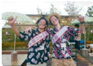
司会の盛り上げ隊の2人