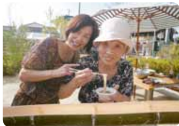
ソーメンは夏の風物詩