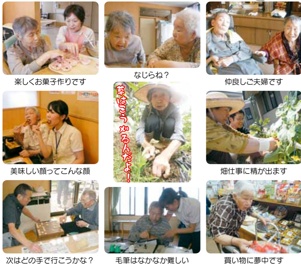
楽しくお菓子作りです