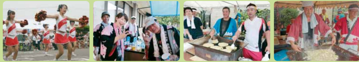
アルビレックスチアリーダーズJr