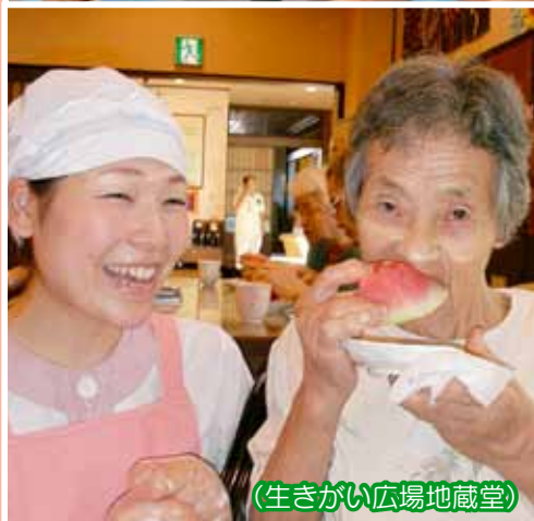
(生きがい広場地蔵堂)