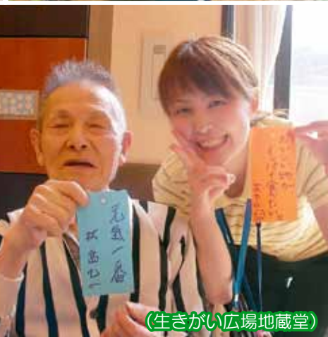
(生きがい広場地蔵堂)