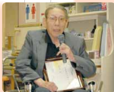
今までのものを集めた俳句集もあります