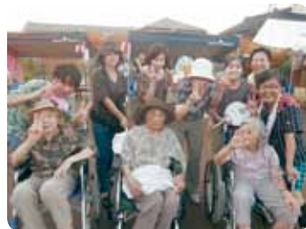
皆様一体となった花笠音頭、分水花見音頭で一周年祭のクライマックスへ