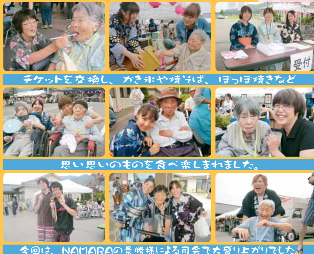
チケットを交換し、かき氷や焼きそば、ぼっぼ焼きなど