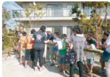
一番人気の流しソーメン