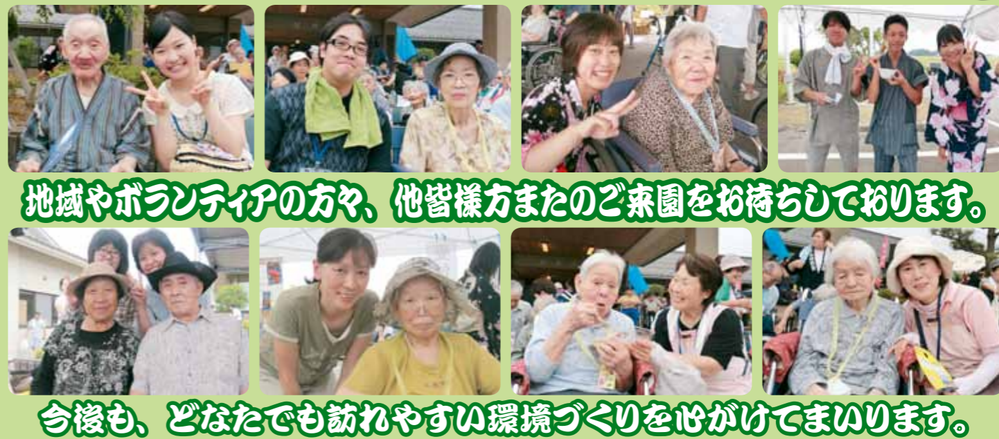
今回は、NAMARAの景勝様による司会で大盛り上がりでした。