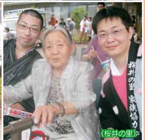
(桜井の里) 桜井の里 家族協力