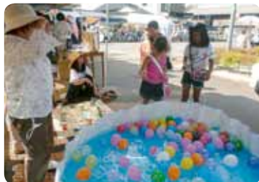
ヨーヨー風船のコーナー