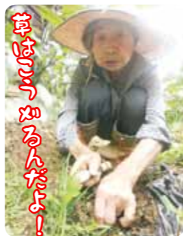
畑仕事に精が出ます