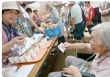
からあげの屋台コーナー