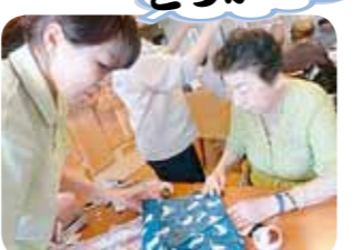
日差しよけの帽子作り