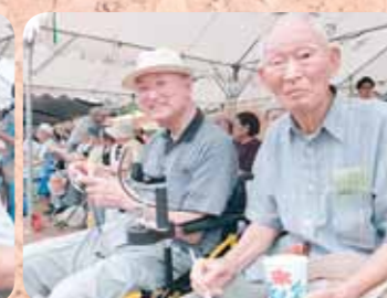
お祭のかき氷は格別です!