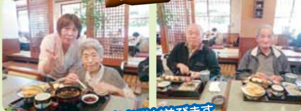
豪華なお膳が並びます