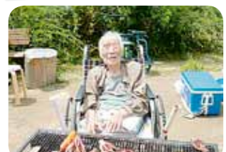
庭でバーベキュー!