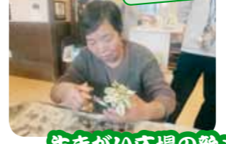
生きがい広場の給メニューです