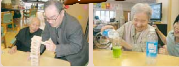
クラブ活動では、皆様と一緒にクリームソーダを作ったり、楽しくゲームに参加頂いてます