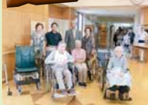
分水老人クラブ連合会のみなさんから車いすと歩行器を頂きました