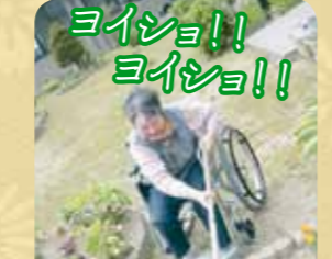
車いすでもクワは使えます