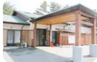
(右) 派遣先のひとつ、グループホーム平小規模多機能ホーム平 (左) 裏手より大船渡湾を望む