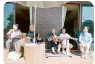
天気の良い日には皆で日向ぼっこ