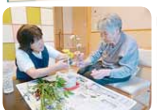
生け花の流派は自分流に