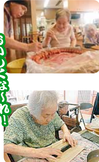
梅巻を作りました