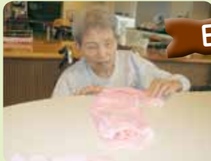
おしぼり畳みを手伝って頂きました