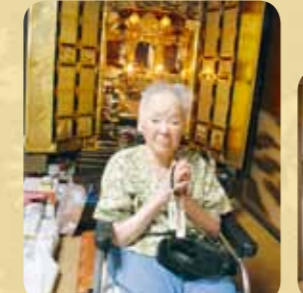
お盆の時期には、ご自宅に外出や外泊され、ご家族と過ごされました。皆さんにとっていい表情で帰ってこられました。