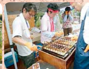
屋台も大盛況! ご近所の子供たちもたくさん来てくれました