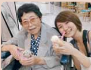
夏はやっぱりアイスです