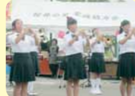
弥彦小学校スクールバンド様