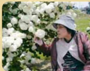
キレイな牡丹だわ!