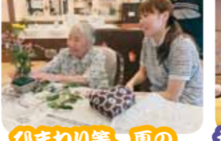
ひまわり等、夏の桜花をいけました