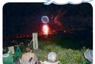
花火大会に行って鑑賞会