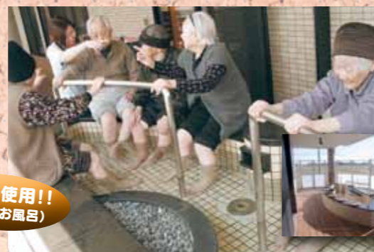
特別養護老人ホーム桜井の里(弥彦)にて