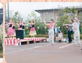
うっとりハワイアンなフラダンスショー