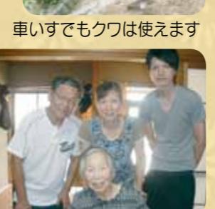
お盆の時期には、ご自宅に外出や外泊され、ご家族と過ごされました。皆さんにとっていい表情で帰ってこられました。