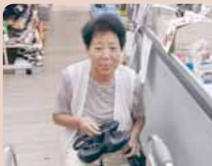
気に入った靴が買ったよ〜