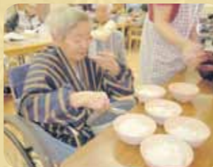
ご飯の盛り付けは私にお任せを