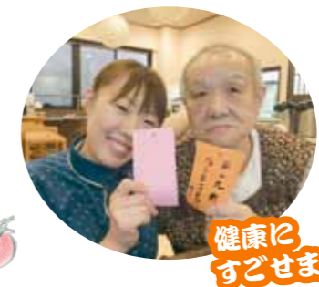
健康にすごせますように...