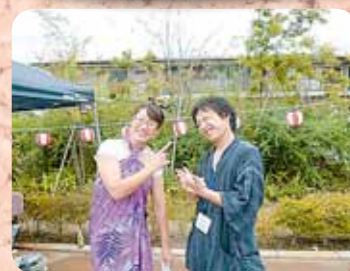
司会はこの2人にお任せ!