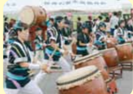
弥彦一之宮姫太鼓様