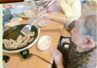
おいしく焼けているかなあ〜?