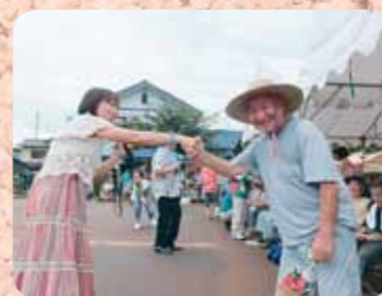
歌謡ショーで元気いっぱい歌って踊りました!