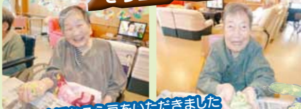
立派なそら豆をいただきました