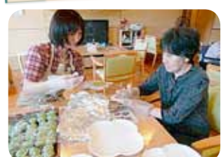
みんなで笹団子を作りました。味も出来栄も◎!!