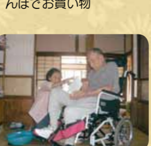
お盆の時期には、ご自宅に外出や外泊され、ご家族と過ごされました。皆さんにとっていい表情で帰ってこられました。