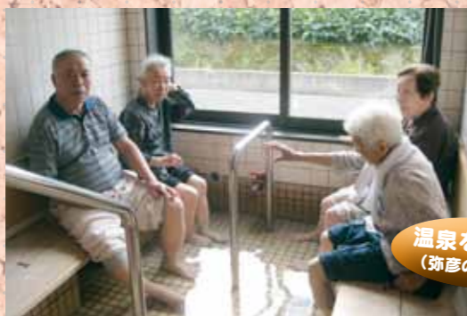
デイサービスやひこ(弥彦)にて

誰もが気軽に、そして身体に負担なく入れることはもちろん、利用するサービスの垣根を越えてお友達とおしゃべりしたり、時にはアイスクリームを食べながら、いっしょに、じよんのびはいかがですか?