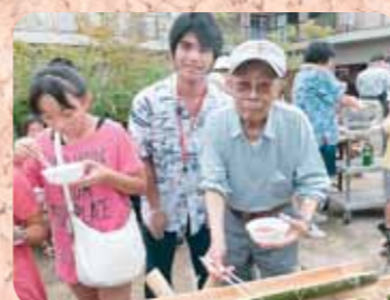
流しそうめん! これぞ日本の風物詩