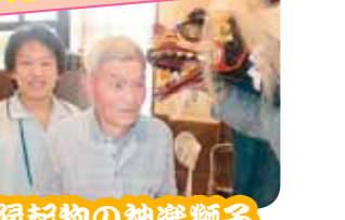
縁起物の神楽獅子が来ました!