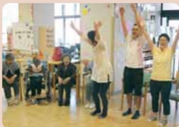
ボランティア「笑いヨガ」様にもお越し頂き、皆様お腹の底から笑って頂きました