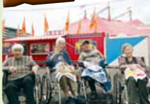
象やライオンなど沢山動物が出てきてすごかったです