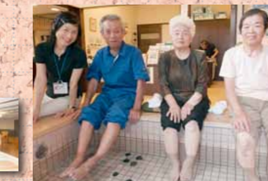
生きがい広場地蔵堂(燕市分水地区地蔵堂)にて