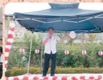
暑さに負けないカラオケを熱唱!