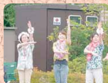
外でも、中でもお祭りダンス! 子供たちとも白塗りダンス!?