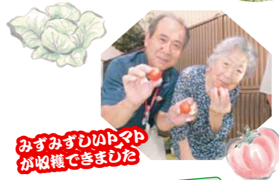
みずみずしいトマトが収穫できました