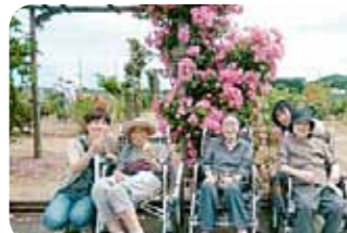
女性陣でバラ園にお出かけ