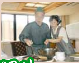
お好み焼き、とってもおいしくできました