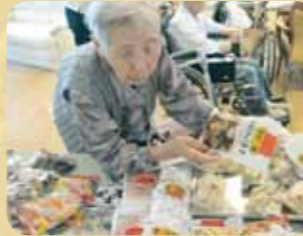
毎週木曜日は、喫茶さくらんぼでお買い物