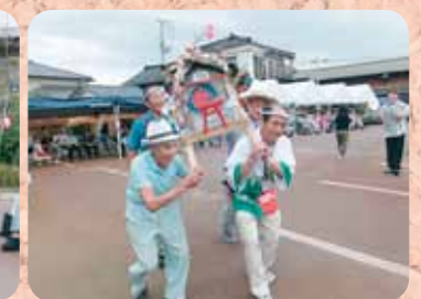
わっしょい! わっしょい!