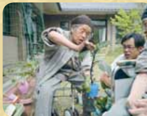
野菜の育て方を職員に指導中