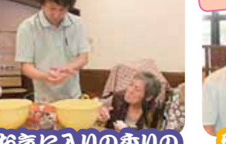
お気に入りの香りの石鹸が出来ました