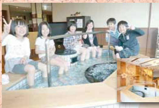
はな広場(燕市横田地区)にて