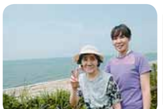
海にも行って、流しそうめんもしました