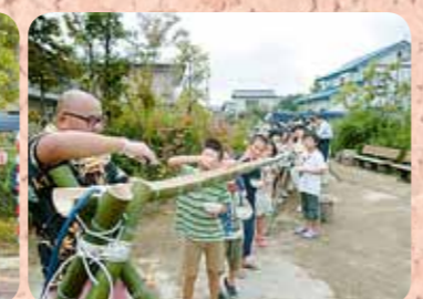
流しそうめんも大賑わい