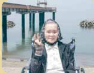
天領の里にお出かけし、外で記念撮影