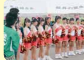
アムビュクスジュニアチアリーダーズ様