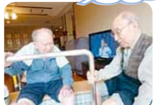
ゆっくりと足湯に入りながら男同士語ります