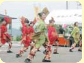
弥彦よさこい添弥様