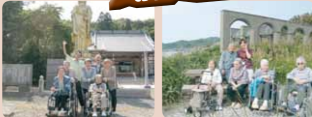
青空の下たくさんさんの場所にドライブに行きました!!