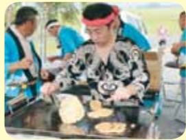
麓地区を良くする会様