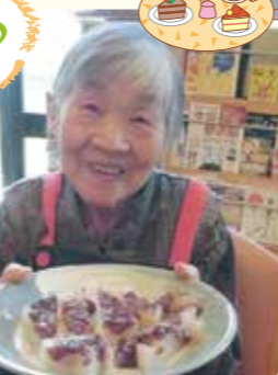
美味しく 出来ました。