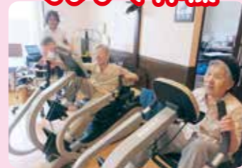
今日も元気に運動するろ~