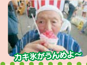
カキ氷がうんめよ〜