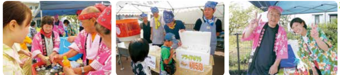
多くの方が協力して下さいました。ありがとうございました!