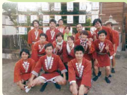
分水祭りで神輿を担ぎました。 ワッショイわっしょい!