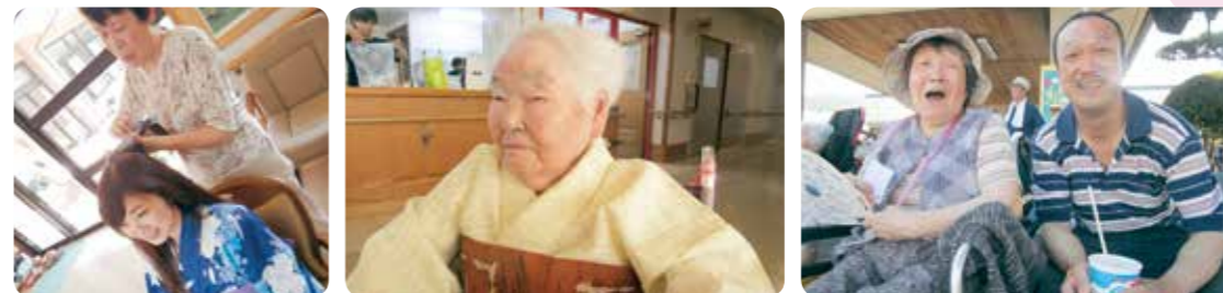
ご利用者、ご家族、地域の皆様、ボランティアの方々に心より感謝いたします。

8月5日、毎年恒例の納涼祭が行われました。照りつけるような日ざしでしたが、比較的風があり、さわやかさも感じられる1日となりました。皆様に支えられ、大成功に終わることができました。ありがとうございました。