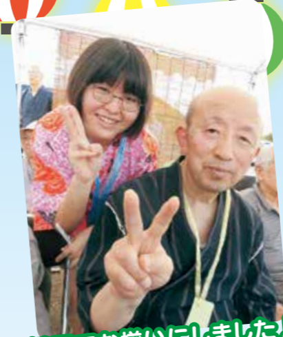
甚平でお揃いになりました♪