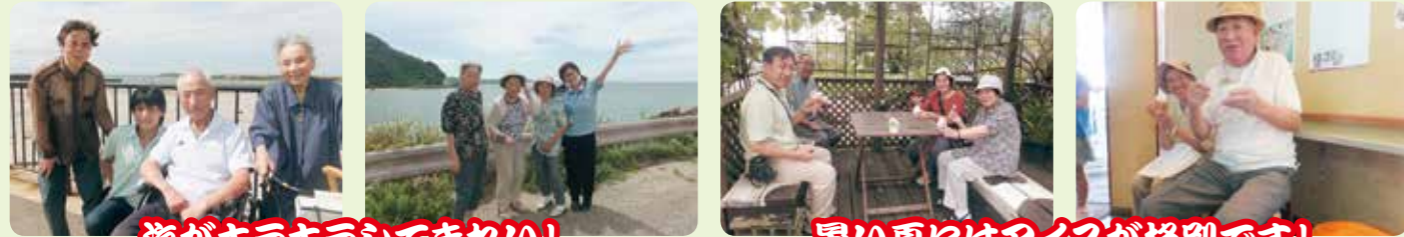
海がキラキラしてきれい!

シーサイドラインへドライブ!そして暑い夏には冷たいジェラート!久しぶりにアイスを食べられたという方も!皆様とても喜んでおられました!