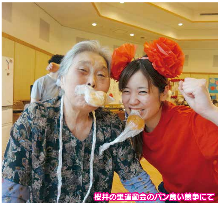
桜井の里運動会のパン食い競争にて