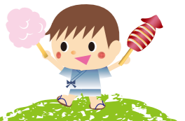
いい~のがなってるねっか