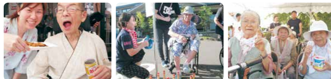
たくさんの笑顔があふれる納涼祭となりました。