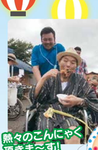
熱々のこんにやく 頂きま〜す!