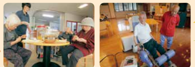
一生懸命、梅シロップ作り