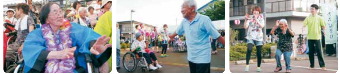
炭坑節やズンドコ節にフラダンスなど皆と踊るのは楽しいです!

今年も皆様のご協力のもとひろば祭りを開催させていただきました。大盛況で終える事が出来ました。