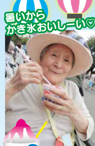
暑いから かき氷おいしーい♡