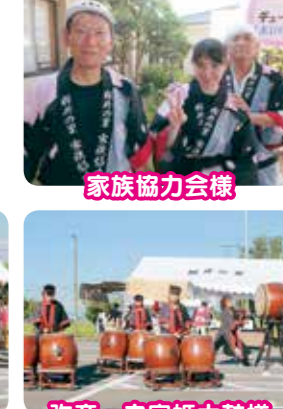
弥彦一之宮姫太鼓様