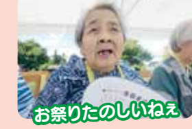
お祭りたのしいねえ