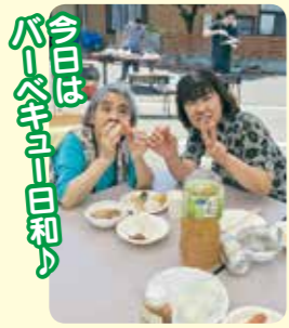
今日はバーベキュー日和