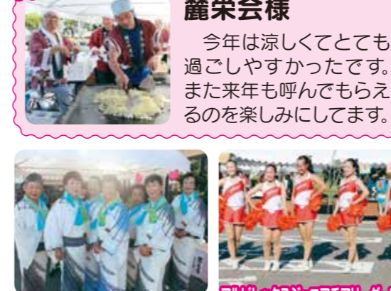
アルビレックスジュニアチアリーダーズ様