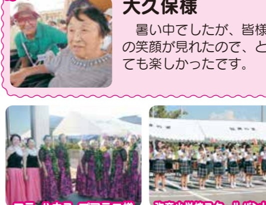
フラハウス フアラミ様