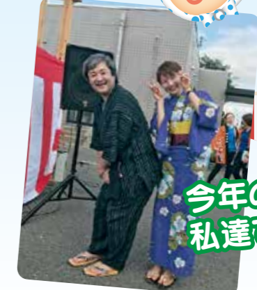
今年の司会は、 私達です!