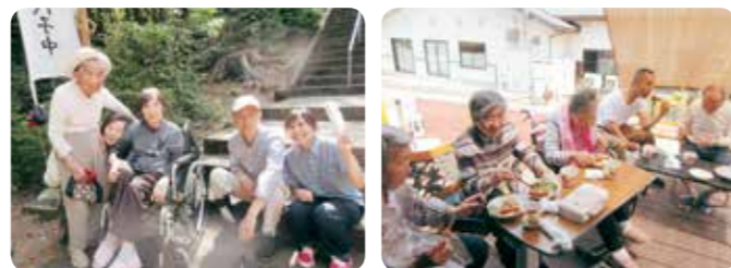
天気のいい日はお出かけ