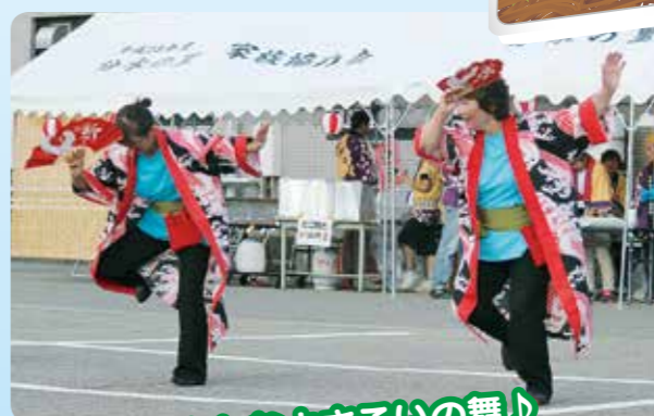
♪華やかなよさこいの舞♪