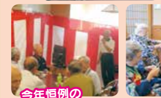
今年恒例のカラオケ大会!