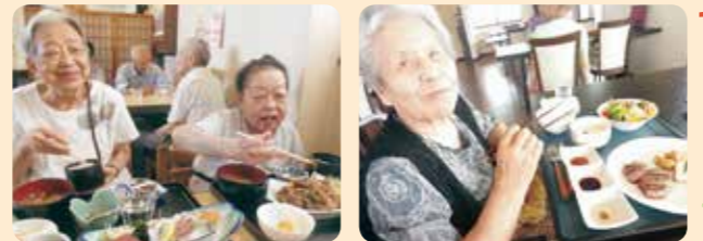
みんなで食べるとおいしいよ