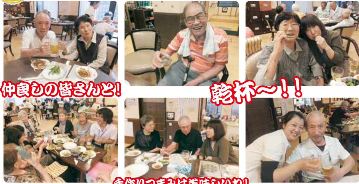
仲良しの皆さんと!

ご利用者様やご家族、職員も一緒に乾杯。生きがい菜園で採れた野菜を職員手作りの天ぷらや餃子にして皆様に召し上がって頂きました!