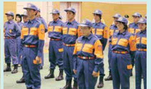
緊張の面持ちにて訓辞を