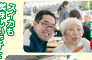
我が家の皆様と地域の皆様と... 楽しくBBQ!!