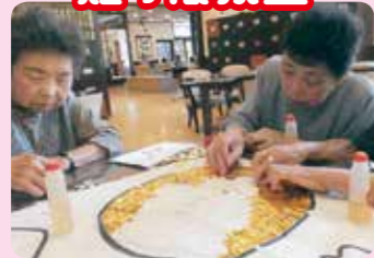
どんな絵ができるんだろうか!