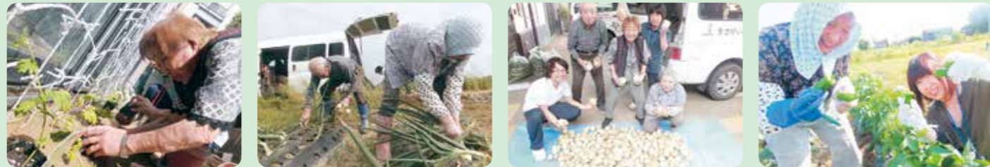
ゴーヤを植えました!