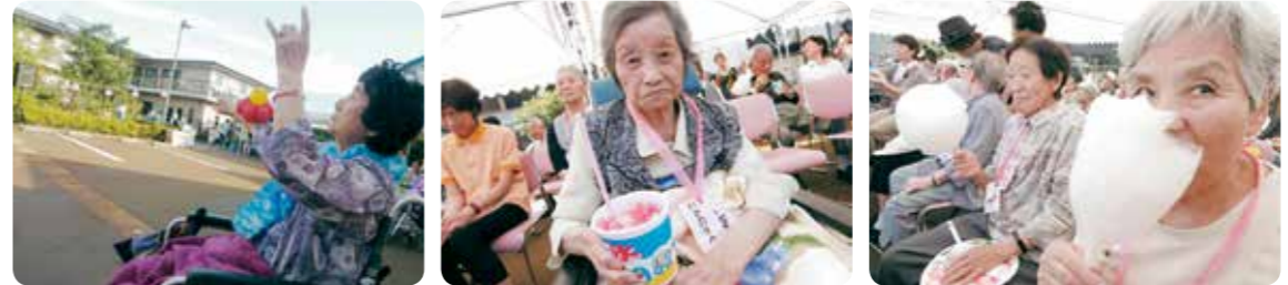
バルーンアートと一緒に