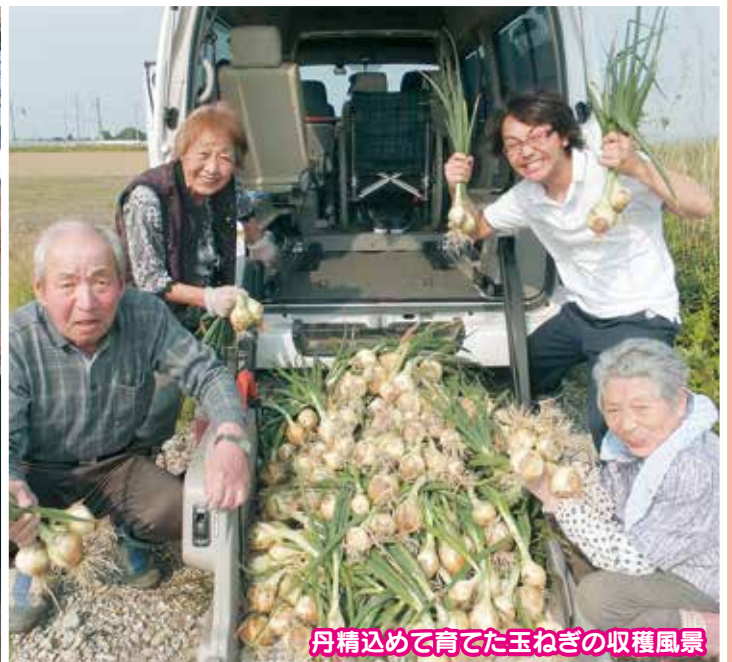
丹精込めて育てた玉ねぎの収穫風景

桜井の里 / 〒959-0318 新潟県西蒲原郡弥彦村大字麓3036番地 TEL.(0256)94-3939 / FAX.(0256)94-2552