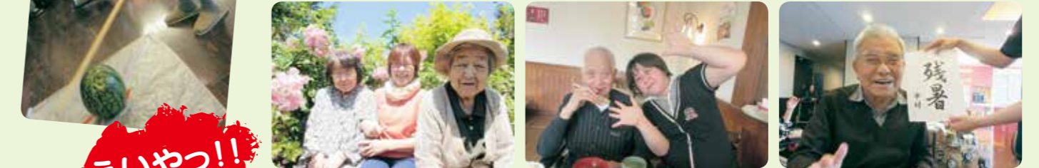
イングリッシュガーデンや外食のワンシーンです!