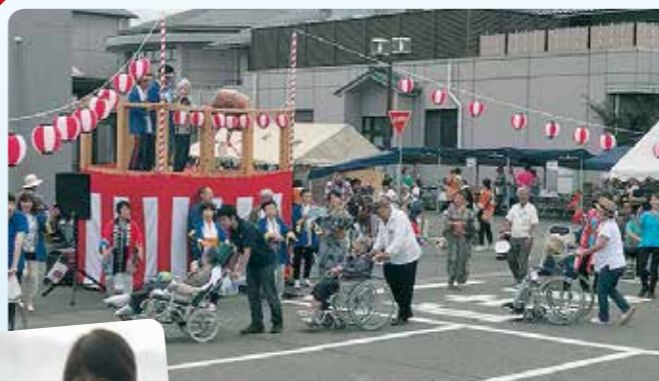
楽しく参加してま〜す!!!

雨の不安もありましたが、晴天に恵まれ、分水の里まつりを開催しました。 楽しいボランティア様の踊りや美味しい屋台での食事を堪能しました!