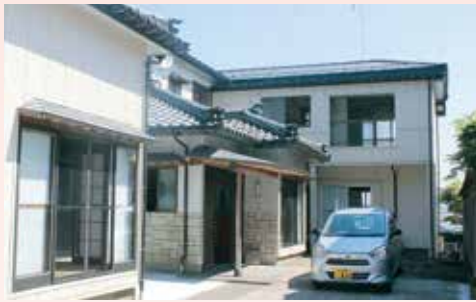
赤塚小学校向かい、旧道に面した住宅を改修して事業所を開設