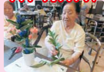
皆様のセンスが光ります☆