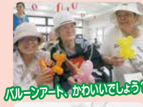
バルーンアート、かわいいでしょう?

グループホームは、家庭的な環境の下、皆で楽しく共同生活をしています。 少人数なので気心も知れた仲間と楽しい毎日を元気に過ごしています。