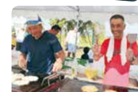
麓地区を良くする会様