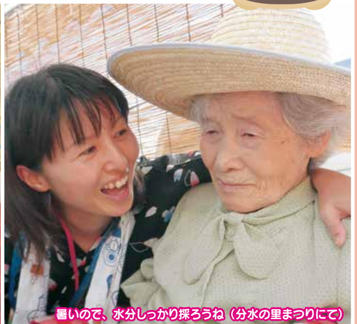
暑いので、水分しっかり採ろうね（分水の里まつりにて）