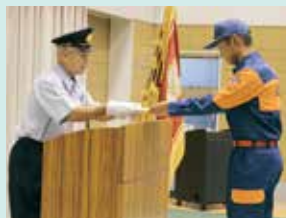
分団を代表して辞令交付

当法人では、地域貢献や地域とのかかわりの一環とし、職員に地域の消防団への入団を促がし、8/1(火)には、燕・弥彦総合組合消防本部にて、当法人より11名が入団式に出席しました。今後、合同練習に積極的に参加し、知識等研鑽を深めて参ります。