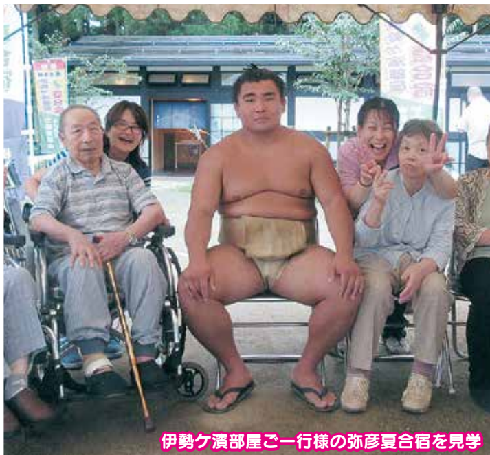
伊勢ヶ濱部屋ご一行様の弥彦夏合宿を見学