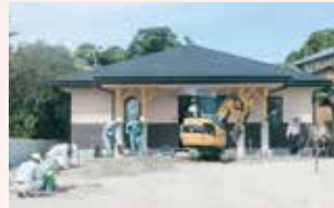
小規模多機能ホーム 桜井の里・あかつかの家

当法人では、新潟市内で初めての開設となる「地域生活支援施設桜井の里・あかつか」(総称)の計画を進めておりましたが、具体的には、ケアプランセンターと小規模多機能ホーム(登録定員29名)2つの事業を指しております。そのひとつである「ケアプランセンター桜井の里・あかつか」は9/1(金)に開所し、地域の皆様の役にたつよう鋭意努力して参ります。又、小規模多機能ホームは12月の開所予定ですが、9月中旬に竣工・引渡しを受け、今後、地域の皆様への内覧会等も予定して参ります。こちらの利用に関しましても、しばらくはケアプランセンターの方で承ります。