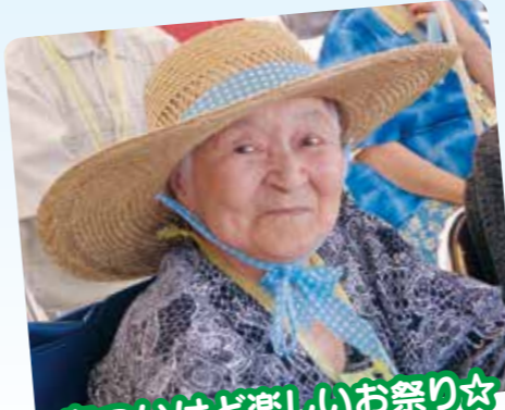
あついけど楽しいお祭り☆