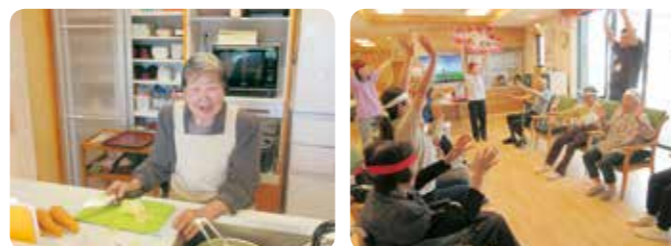
台所姿が似合ってます

開設より半年程経ちましたが、これからも住み慣れた弥彦村で生活が送れるように支援していきます。