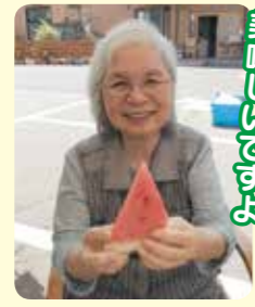
スイカも美味しいですよ