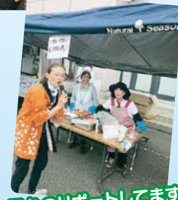
屋台のリポートしてます♪