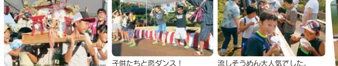
子供たちと恋ダンス!