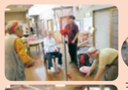
玉入れ、パン食い アメ玉探し!

朝の雨がさやわかになり、縁前広場でバーベキュー会を行いました。 ご家族や運営推進員の方々と共に夏を楽しむことが出来ました。