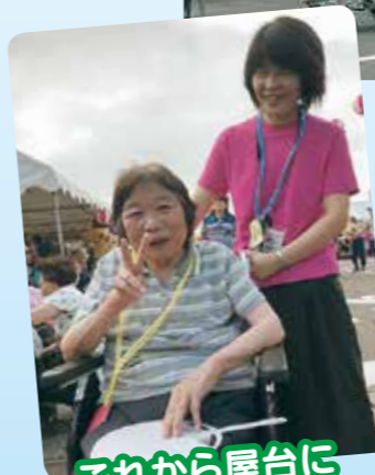
これから屋台に 行ってきます♪