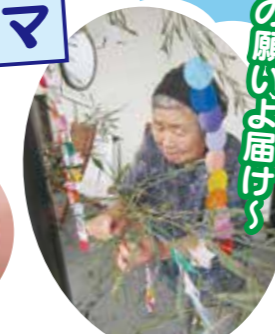
おれの願いよ届せ～

つどいでは、地域交流会での風鈴作り、七夕、スイカ割りなどで夏を楽しんでいただきました。