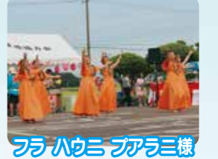
フアラハミ フアラミ様