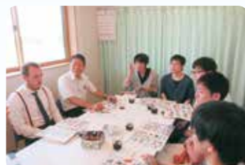
新潟国際情報大学の学生らとの夏祭りの事前打ち合わせ