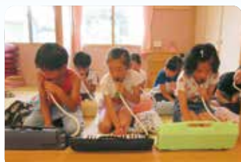
赤塚小学校の皆さんによるピアノ演奏