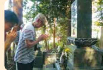
ご先祖様に会ってきました