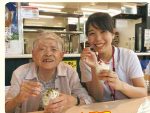
おもてなし広場で アイスを食べました