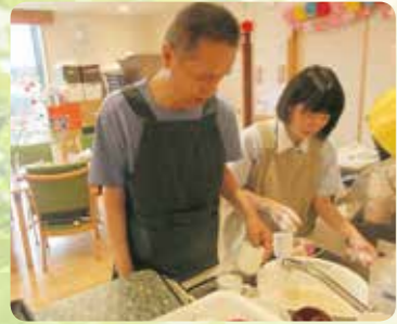
食器洗も自分でやるよ