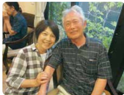
暑い夏にはビールが一番！！