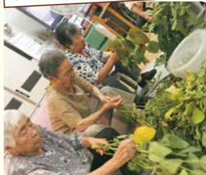
さすが! 皆さん手際がいい!