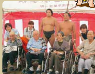
公開朝稽古の見学に行きました!