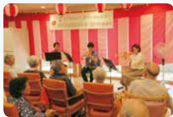
シンフォニックアンサンブルリルト様の管楽器演奏