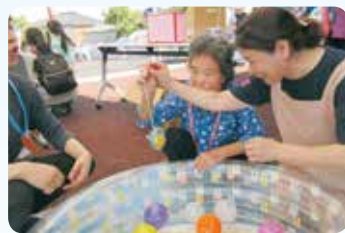
ヨーヨー釣りでドキドキ体験