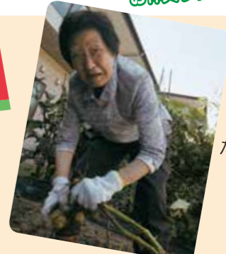
自分たちでジャガイモ 作りました