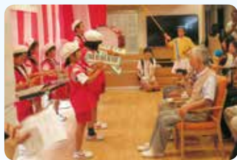
リズム感溢れる赤塚小学校の鼓笛隊の演奏

当施設では「季節の行事を楽しむ」ことをモットーに様々な催し物を開いており、その中でも7月28日(土) 14:00から行なった「夏祭り」は小規模な施設ならではの地域の住民、ボランティア、大学生、小・中学生、園児らと一緒に時間を共有できた有意義な行事でした。また、連日猛暑が続いたため、駐車場コーナーに加え、屋内コーナーも設け、たくさんのお店と出し物で賑わいました。