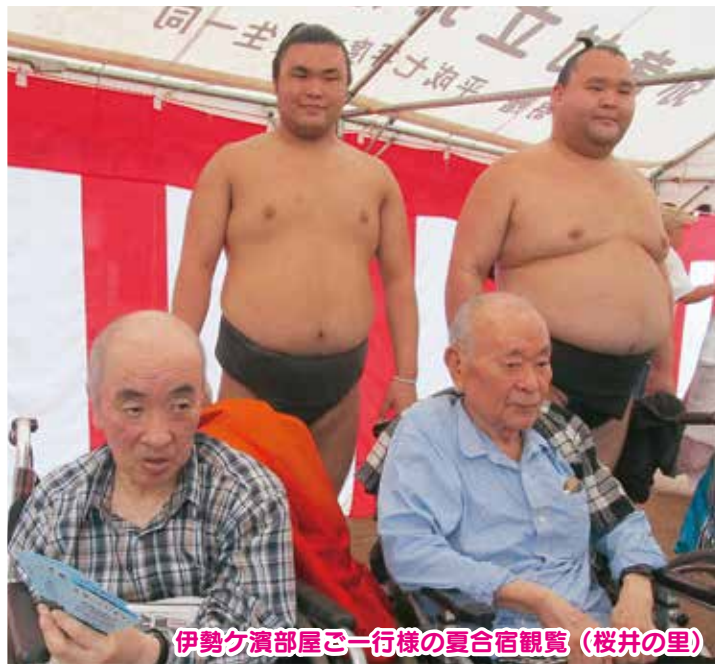
伊勢ヶ濱部屋ご一行様の夏合宿観覧 (桜井の里)