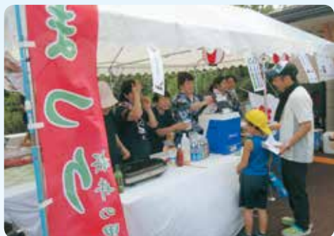
猛暑のせいで飲物コーナーが大繁盛

当施設は新潟市西区赤塚において、昨年9月にケアプランセンター、そして、12月に小規模多機能ホームが加わり、もうすぐ1年を迎えようとしています。少しずつ利用者が増え、地域の方との交流が深まっていますが、その様子をお伝えしたいと思います。