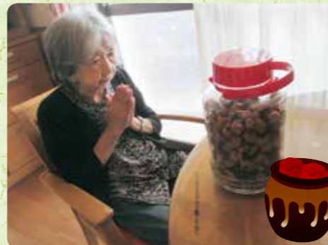
毎年恒例の梅干し作り。美味しくなりますようにと願いを込めて☆