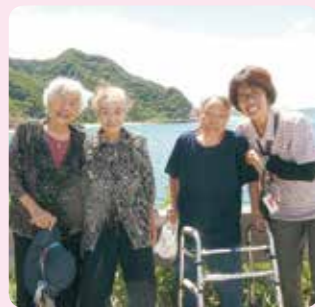
天気も良くて海もきれい！

海へドライブに行ってきた！きれいな海に美味しいアイス！皆さまとても喜ばれていました！