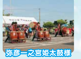
弥彦一之宮姫太鼓様