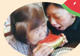
今年も美味しいスイカを食べました