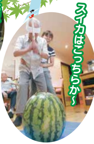
スイカ割りさくらが～