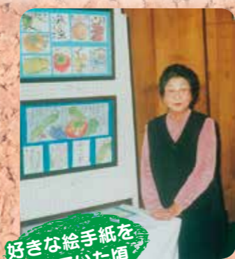
好きな絵手紙を書いていた頃

町の作品展で、ご自分の絵手紙の作品と一緒に撮った一枚です。学生時代は絵が得意だったそうで、教室に何度も貼られていたと嬉しそうにお話されていました。何か習い事をしたい! とのこと、絵手紙を習っていたそうです!