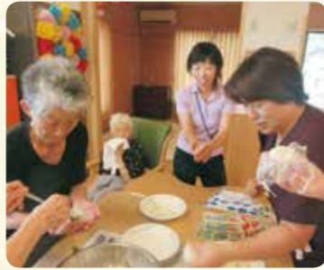
一緒におやつ作り