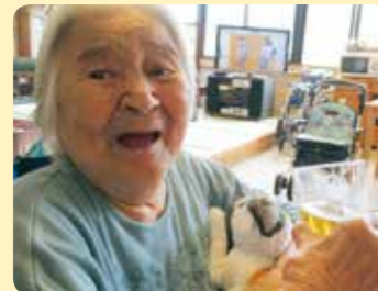
たまには朝から一杯!!