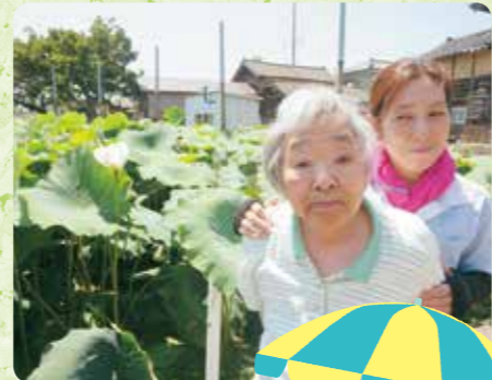
蓮の花を見に行きました