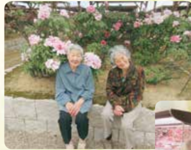
弥彦牡丹園へおでかけ

やひこの家では、地域との交流やおでかけ、季節に合わせた行事を通して皆さんに楽しんで頂きました。