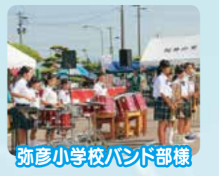
弥彦小学校バンド部様