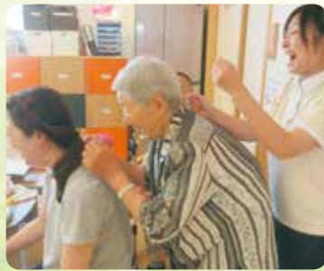
みんなで仲良く肩たたき