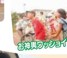
お神輿ワッショイ！！