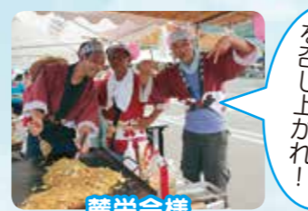
おいしい焼きそばを召し上がれ!