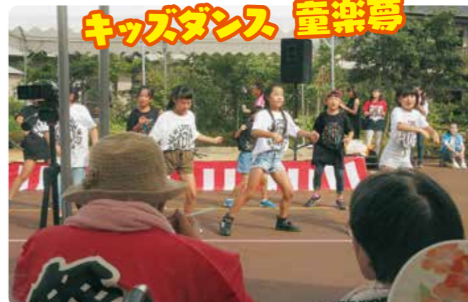
今年初参戦の「キッズダンス童楽尊」様を始め、色んなパフォーマンスがありました。