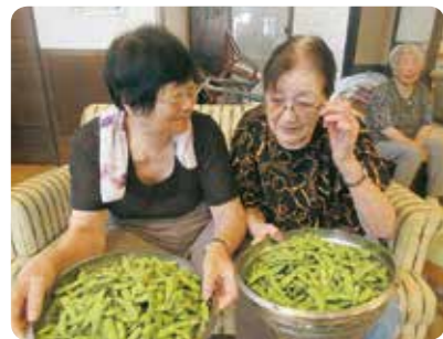
たくさん採れました！

ご利用者はもちろん、ご家族や職員も一緒に乾杯！！生きがい農園で採れた野菜や枝豆を職員の手作りで天ぷらなどの料理にして皆様に召し上がって頂きました！