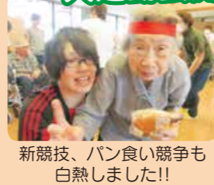
新競技、パン食い競争も白熱しました!!