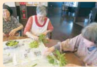
枝豆美味しかったあ