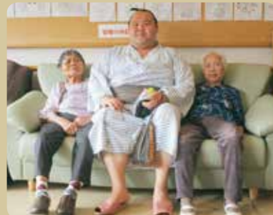
桜井の里へも慰問に来て下さいました!