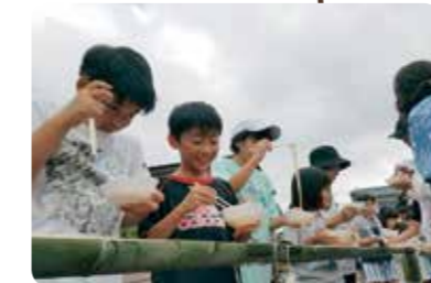
今年もそうめん流しは大好評でした！