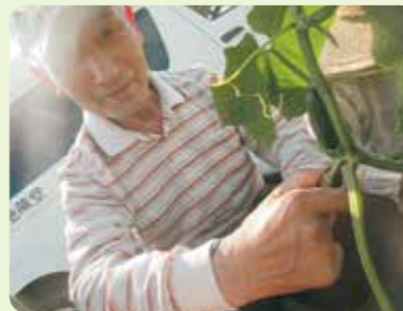
いろいろな野菜を作っています！