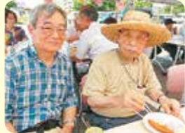
親子一人、満 喫してですよ

今年も恒例のバーベキュー会を行ないました。天気にも恵まれ、暑い中でしたが地域の方々やご家族の皆様にも多数参加して頂き楽しいひとときを過ごしました。 また分水の里祭りでは天気と涼しさに恵まれ浴衣や甚平でお祭りを思う存分楽しみました！