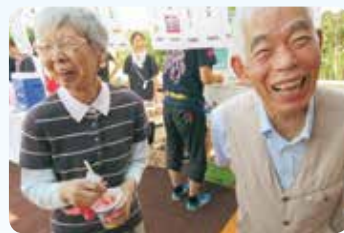
屋台巡りで童心に