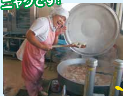
厨房の大きな回転鍋 で作った美味しいコン ニャクです!