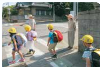
ご利用者と職員らによる地域の交通安全の見守り