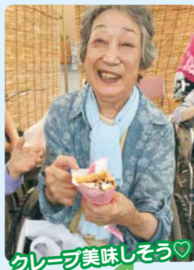
クレープ美味しそう♡