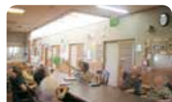
つなぐよつなぐよ風船バレー♪