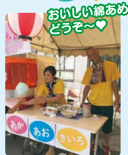
おいしい綿あめ どうぞ~♡