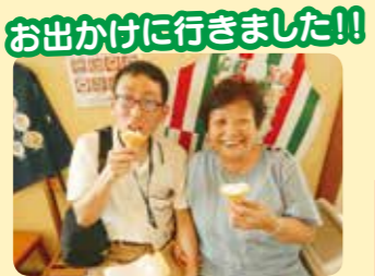
お出かけに行きました!!