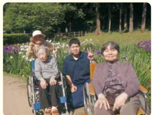
しらさぎ公園 行って来ました!