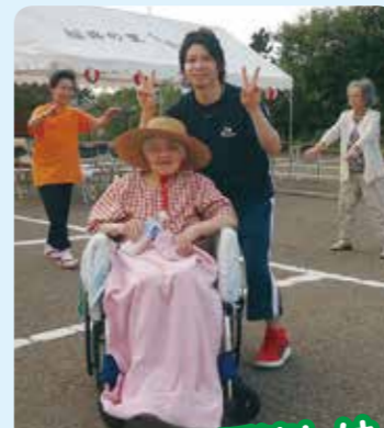
まつりに民謡流しは 欠かせません!