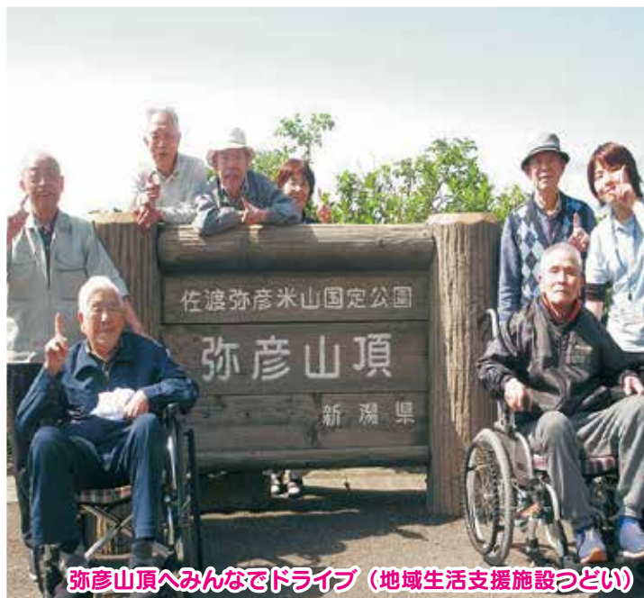
弥彦山頂へみんなでドライブ (地域生活支援施設つどい)