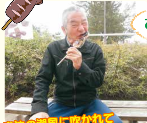
寺泊の潮風に吹かれて うんめ~の~