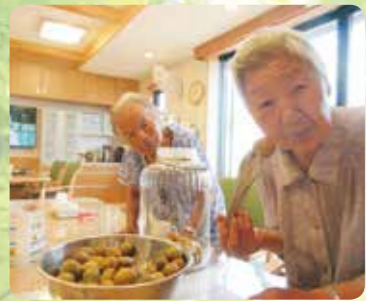
みんなで梅ジュース作り