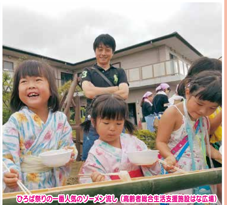
ひろば祭りの一番人気のソーメン流し (高齢者総合生活支援施設はな広場)