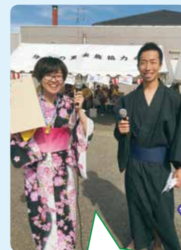
今年は私たちが 司会です!