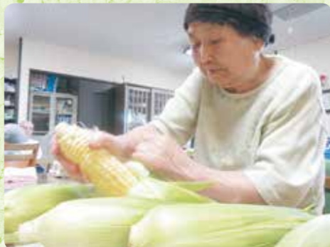
良いトウモロコシが出来たねっか