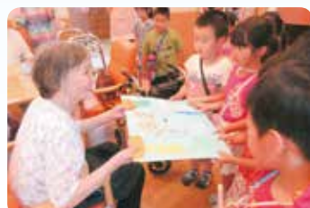
赤塚子ども園の園児らによるふれ合い訪問