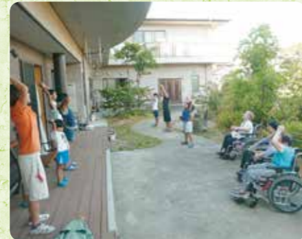
毎年恒例はな広場の庭で夏休みのラジオ体操を地域の小学生と一緒にしました