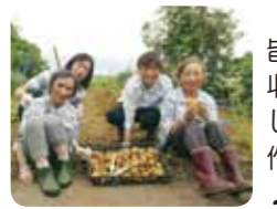
皆さんで収穫しました！豊作豊作～♪