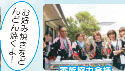
お好み焼きをどんどん焼くよ!