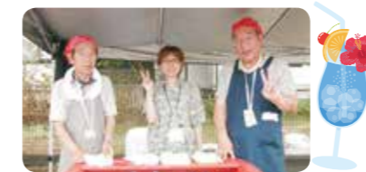
ボランティアの皆様、今年もありがとうございました♪