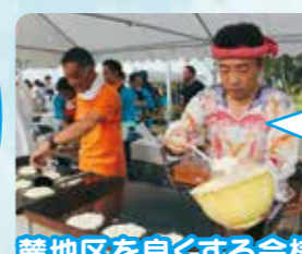
麓地区を良くする会様