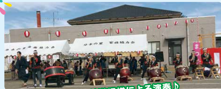
分水太鼓道場様による演奏♪