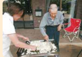
バーベキューも楽しかったです