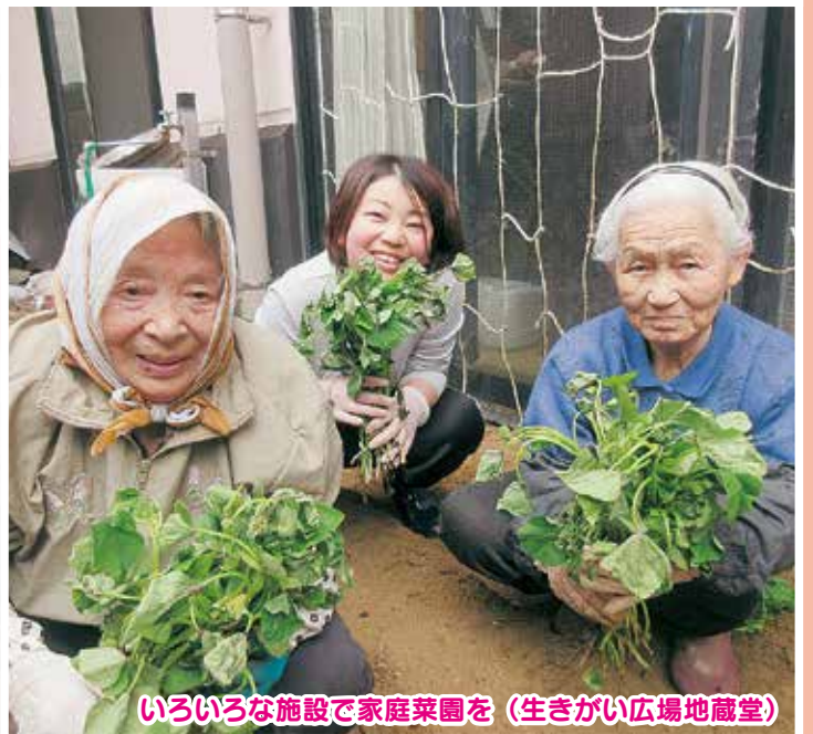
いろいろな施設で家庭菜園を (生きがい広場地蔵堂)

桜井の里 / 〒959-0318 新潟県西蒲原郡弥彦村大字麓3036番地 TEL.(0256)94-3939 / FAX.(0256)94-2552