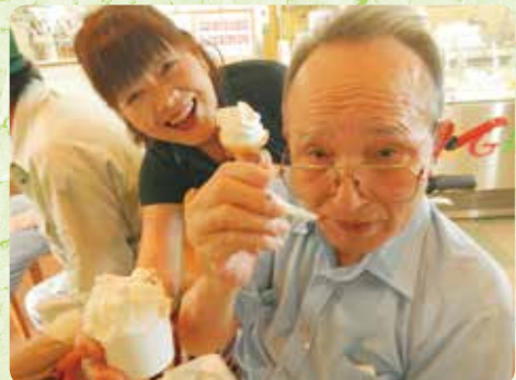
岩室のレガーロへお出かけしました「暑い日のジェラードは格別です。」