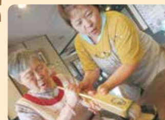
大好きなところてん！