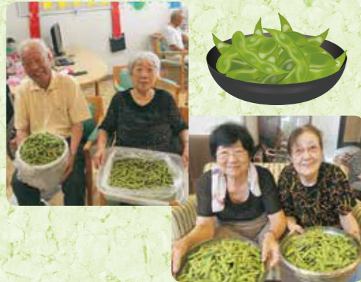
農園の枝豆がこんなにたくさん取れました