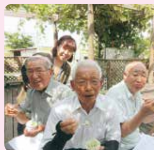
暑い夏にはやっぱりアイスです！