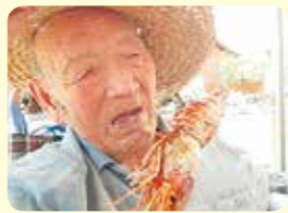
今年も大きな エピソード！