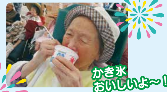
かき氷 おいしいよ~!