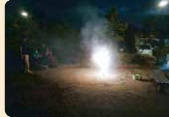
夜の花火も綺麗でした