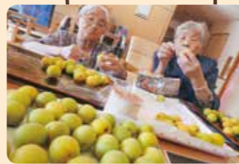
梅酒を作りました