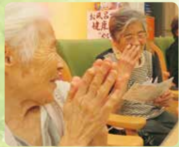
95歳の誕生日をみんなでお祝い