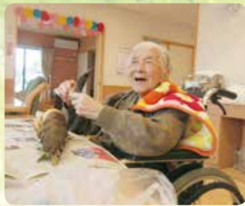
これから竹の子御飯を作ります