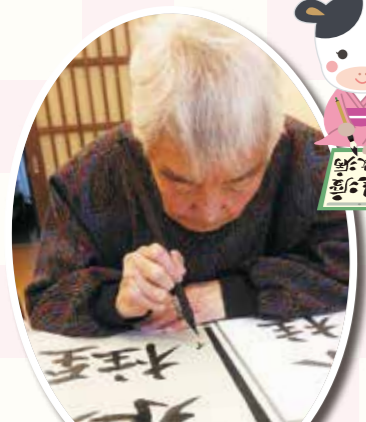
集中して書いています