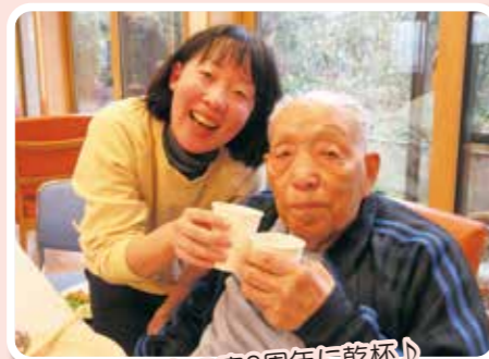
あかつかの家3周年に乾杯♪