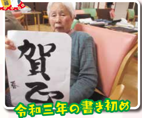
令和三年の書き初め