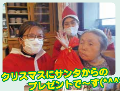
クリスマスにサンタからのプレゼントで〜す(*^^*)

今年度のこいては、新型コロナウイルスの感染予防の取組みをおこなう中でも、ご利用者の皆さまには楽しく過ごして頂きました。