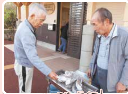
外で焼き芋パーティー！