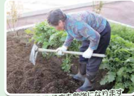
畑の作り方も勉強になります