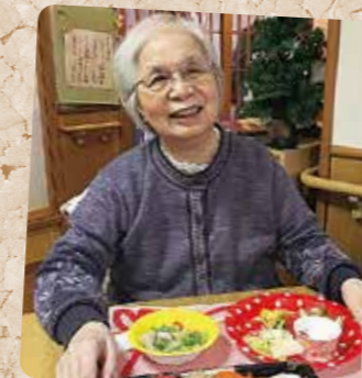
触れ合うと元気が出ます