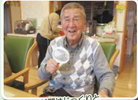
新聞はじっくりと

やひこの家では皆様の得意な事や好きな事を活かしながら、思い思いに過ごして頂いております。とても寒い今年の冬ですが、笑顔の絶えないやひこの家です。