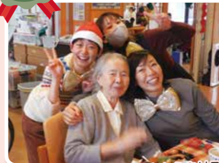
可愛いサンタさんからクリスマスプレゼントをもらいましたよ