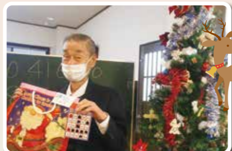
トナカイにプレゼントを もらいました!