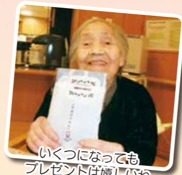
いくつになっても プレゼントは嬉しいね

12月18日、分水の里で毎年恒例のクリスマス忘年会が開催されました。今年は新型コロナウイルス感染症の予防の為、ご家族様には参加して頂けませんが、職員がサンタクロースの格好で出し物をしたり、プレゼントをお渡ししました。ご利用者の皆様に楽しんで頂きました。