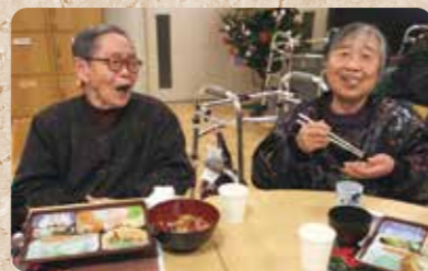
忘年会。会食を楽しんでいます