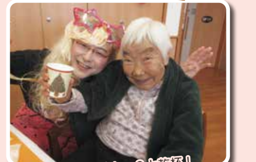
金髪の美女...？と乾杯！