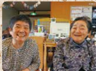
昔のお知り合いと久しぶりの再会