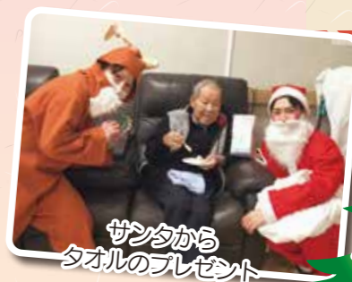
サンタから タオルのプレゼント