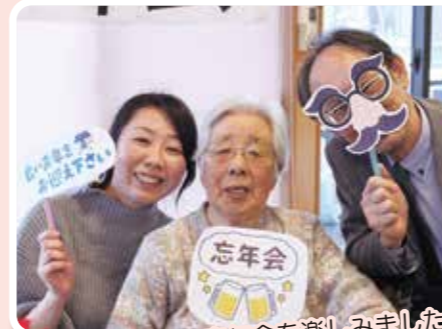
施設長と一緒に忘年会を楽しみました