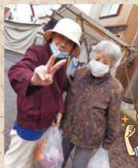
市日と一緒に買い物