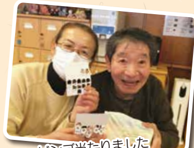
ビンゴ当たりました