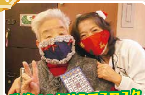
手作りのクリスマスマスク