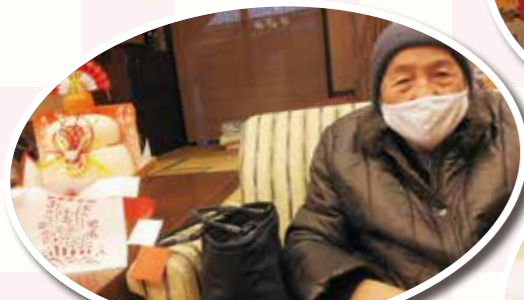
鏡餅をよると正月だお