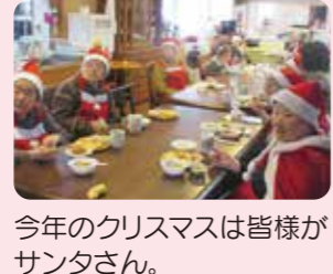
今年のクリスマスは皆様がサンタさん。