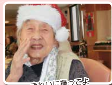
きれいに撮ってよ