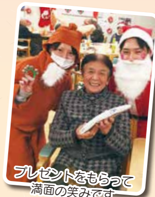
プレゼントをもらって 満面の笑みです