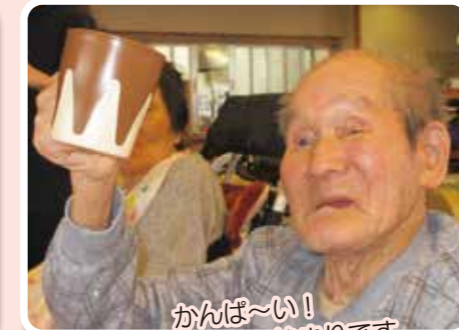
かんぱーい！ の声で忘年会の始まりです