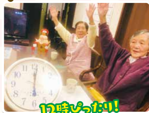
12時ぴったり! おめでとらうござひます!