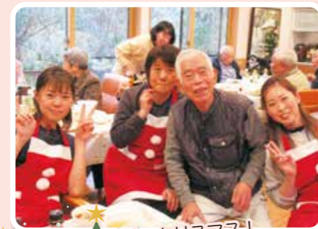
ツリークリスマス！