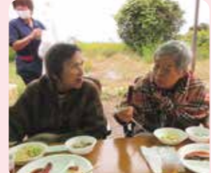
焼き肉や食事を美味しく頂きました。