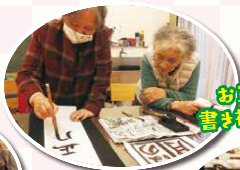
お正月は 書き初め大会