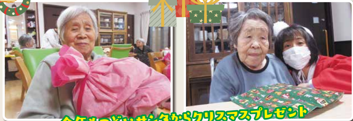
今年もつどいサンタからクリスマスプレゼント