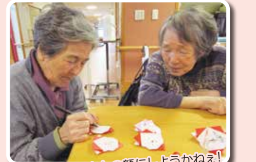
どんなサンタさんの顔にしようかねえ！