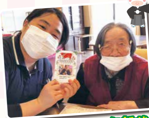
親しい人に年賀状を出します!