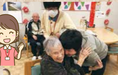
触れ合うと元気が出ます