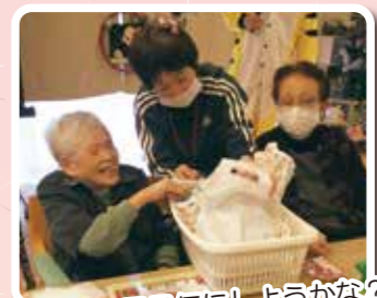
ビンゴの景品何にしようかな?