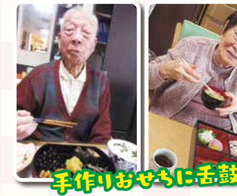
手作りおせちに舌鼓