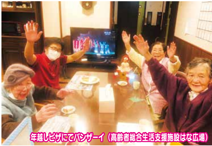
年越しビザにてバンザイ (高齢者総合生活支援施設はな広場)