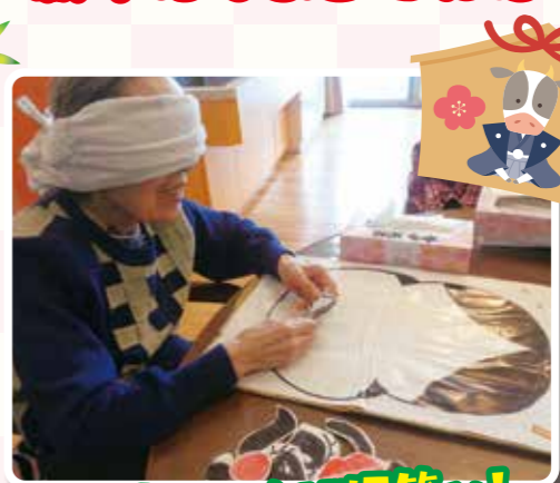
お正月といえは福笑い!