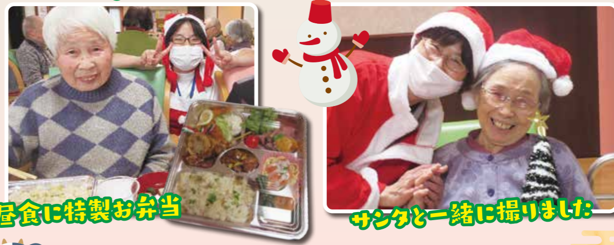
昼食に特製お弁当