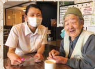
一緒に年賀状を書きました