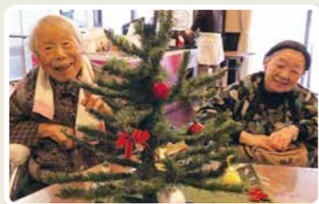
各ユニットでクリスマス ツリーの飾りつけをします!