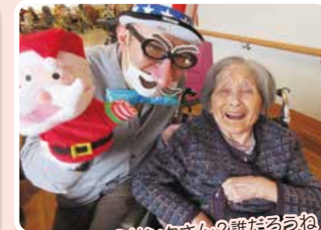
マジシャン？サンタさん？誰だろうね