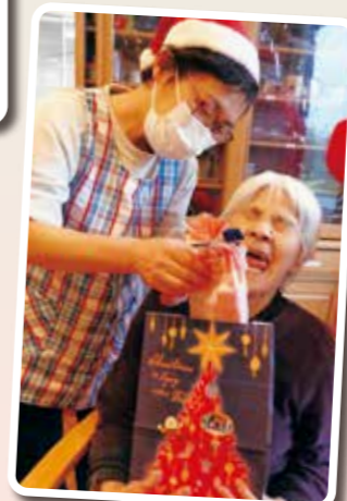
プレゼントをもらって皆様大喜びです!