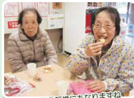
外出は気分転換にもなりますね