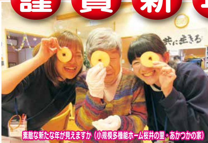
素敵な新たな年が見えますか (小規模多機能ホーム桜井の里・あかつかの家)