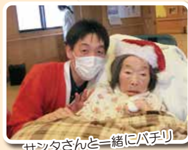
サンタさんと一緒にパチリ