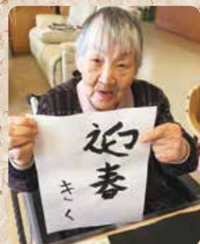
上手に書けました

日頃のご利用者職員とのかかわりの中でとびっきりの笑顔が見られました。皆様の笑顔をご覧ください。