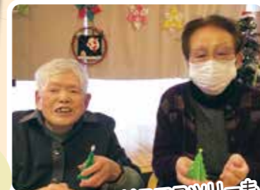
ちっちゃなクリスマスツリーも 可愛いでしょ?