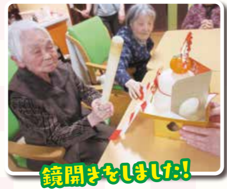
鏡開きをしました!