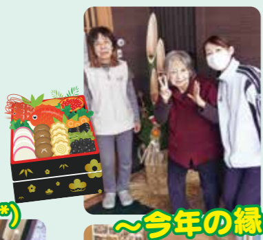
〜今年の縁のお正月〜