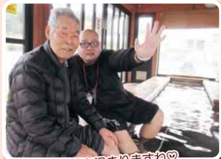
心も体も温まりますね♡

焼き芋パーティーに弥彦菊祭り、あかつかの家周年祭と盛りだくさんの秋冬でした！来年も元気に楽しく過ごしましょう！