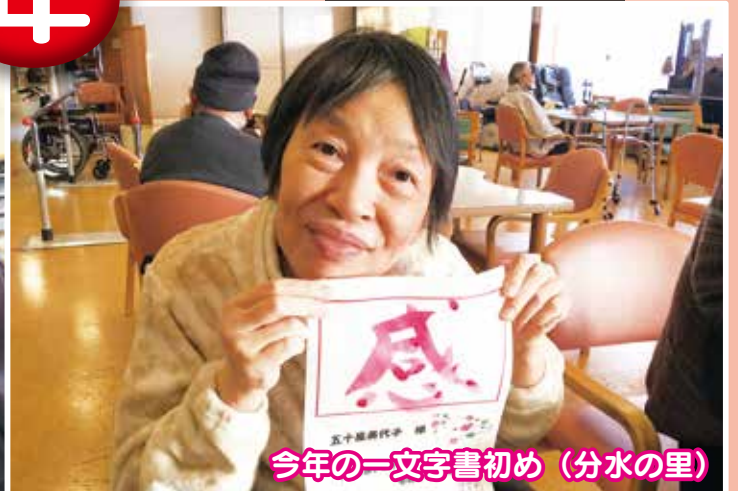
今年の一文字書初め (分水の里)