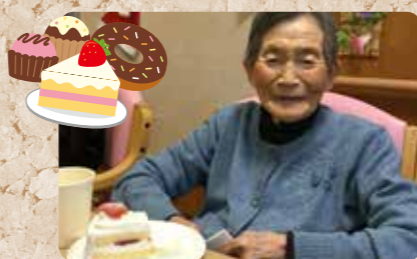
ケーキ美味しいです