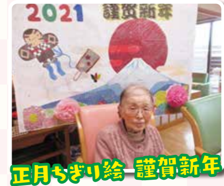
正月ちぎり絵 謹賀新年