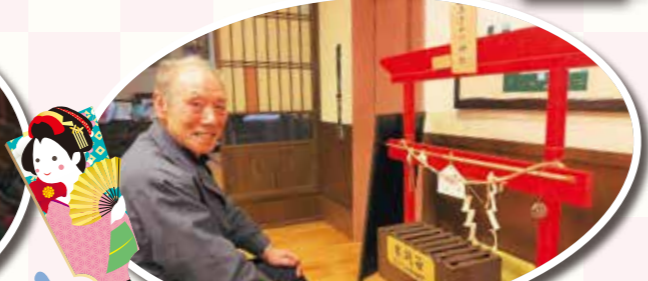
生きがい神社へ初詣