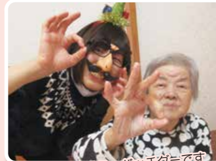
今日のごちそう、パッチグーです