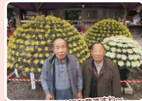
今年も立派な菊ですね～