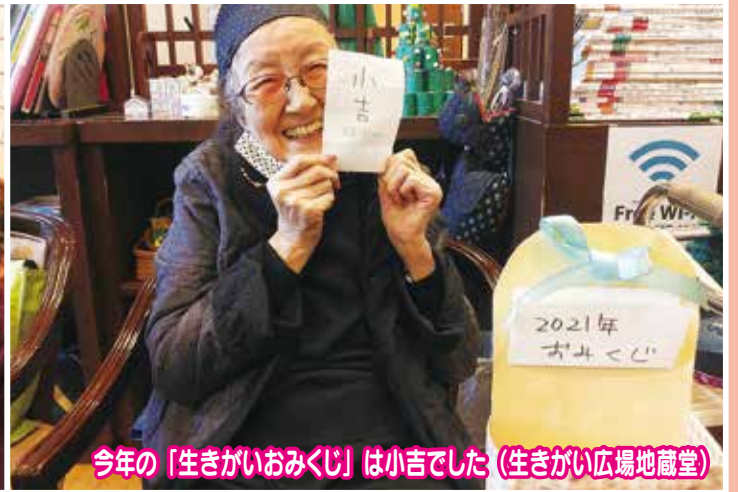
今年の「生きがいおみくじ」は小吉でした (生きがい広場地蔵堂)