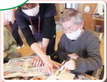
良い一年に なりますように