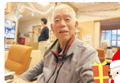
プレゼントもらいました