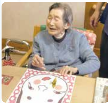
こんな顔になりました!