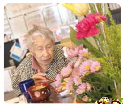
お節料理を食べました！