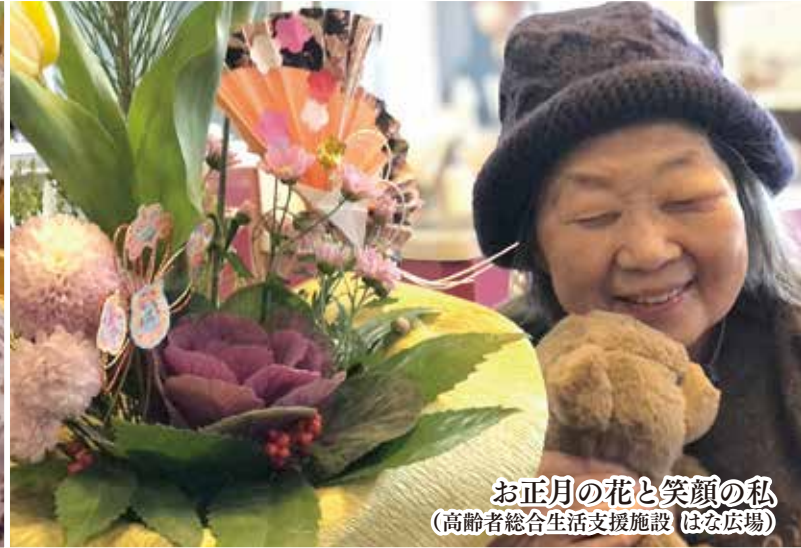
お正月の花と笑顔の私 (高齢者総合生活支援施設 はな広場)