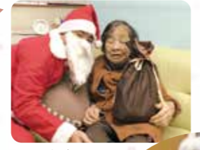
サンタとツー ショット