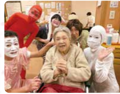
出し物で仮装した職員と記念撮影