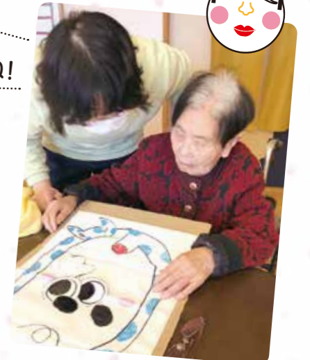
福笑い 楽しいですね！