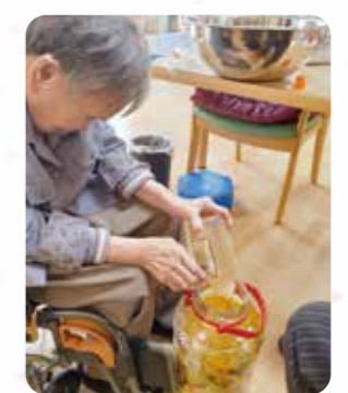
カリンのシロップ 漬け作り