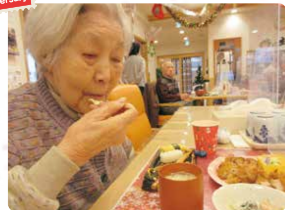
皆さんでお寿司を食べました！

ご利用者、ご家族の皆様そして地域の皆様のおかげであかつかの家も5周年を迎えることができました。今年も元気に楽しく過ごしましょう！