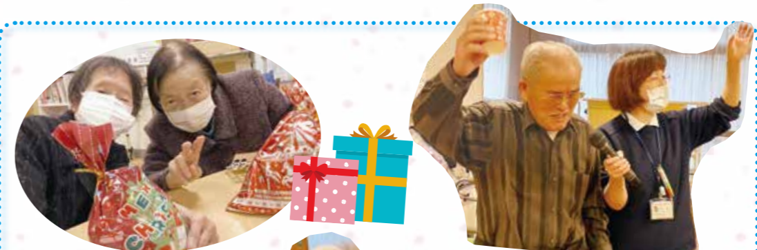
大きな景品もりました