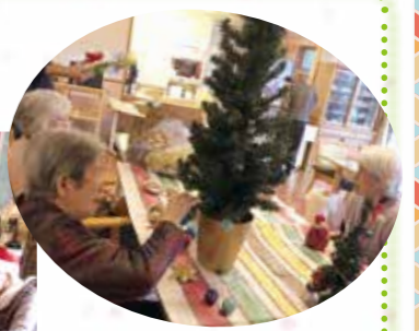
クリスマスツリーの飾り付けをしました！