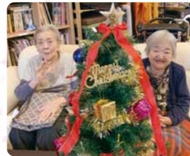
クリスマスツリーを綺麗に飾りました！

12月はコロナで例年通りの忘年会やクリスマス会を開催することはできませんでしたが、各フロア内で普段と変わらない生活が送れるよう工夫して季節を感じて頂いておりました。