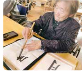
新年の書初めをしました