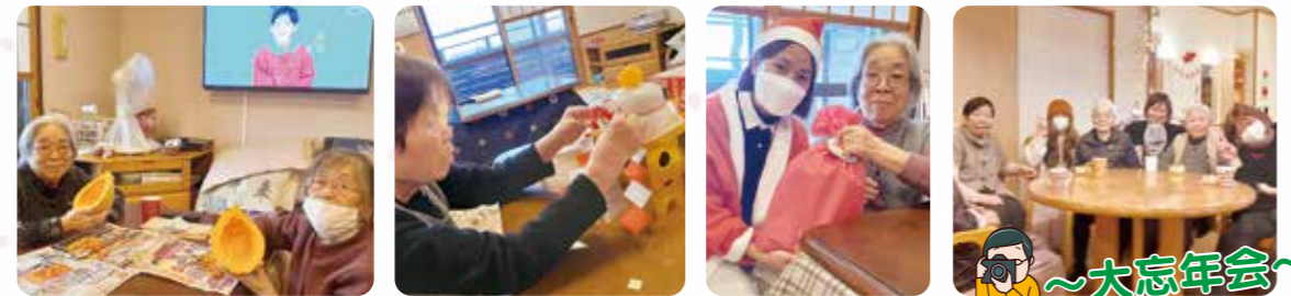
冬至はかぼちゃです