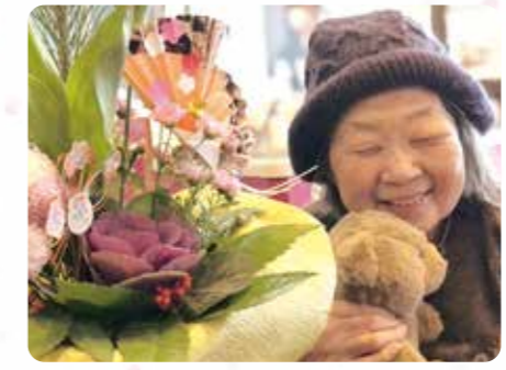
綺麗なお花ですね