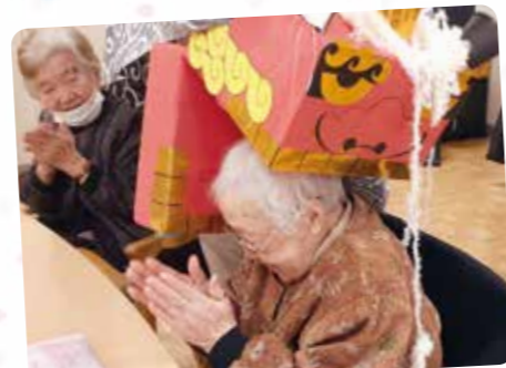
お獅子様へお祈り