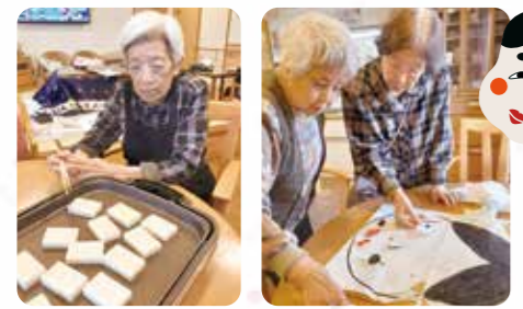
縁のお正月 もちを食べたり福笑いを楽しみました