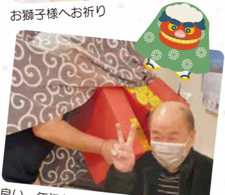
良い一年になりますように