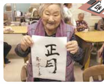
頑張って書きました!