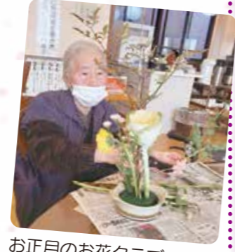
お正月のお花クラブ