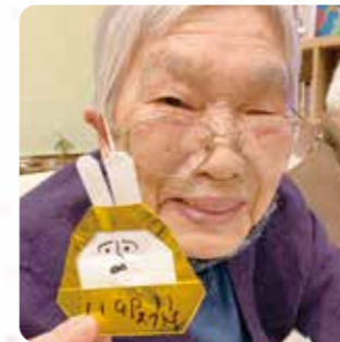
飾り付けも手作りです！