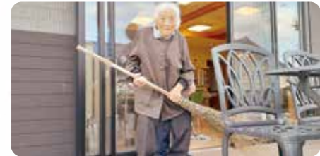
テラスの落ち葉掃き