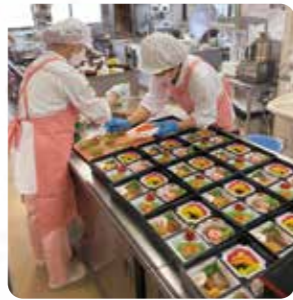
調理・盛り付け がんばっています!!