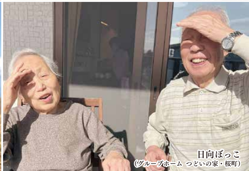
日向ぼっこ (グループホーム つどいの家・桜町)

新しい年を迎えました。法人役員一同、皆様の日頃からの変わらぬご支援に心から御礼を申し上げます。本年もよろしくお願ひいたします。