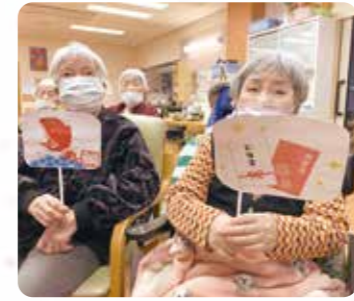
職員の出し物で楽しんで頂きました