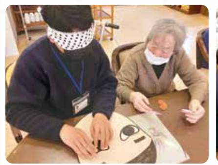
福笑いうまくできました！