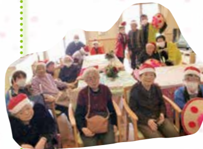
集合写真を撮りました！