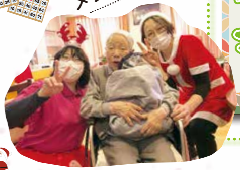
メリークリスマス！