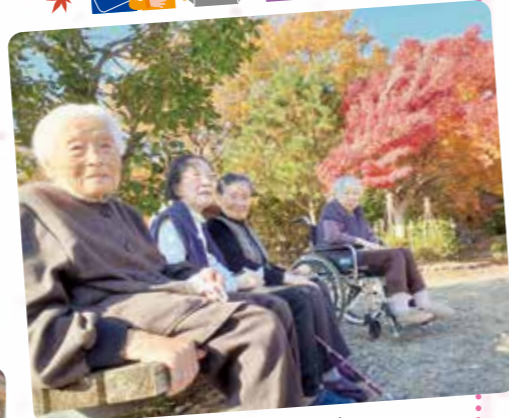
紅葉ドライブに出かけました