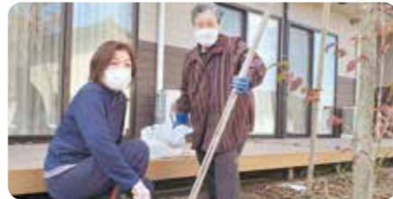
テラスが私の落ち着く場所です