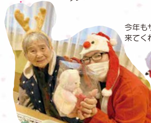
今年もサンタが来てくれました