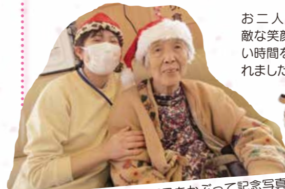
サンタの帽子をかぶって記念写真！