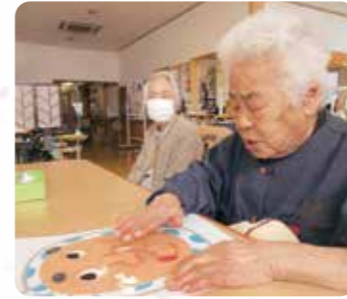
皆の声を頼りに上手に顔を作り上げていました