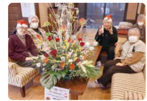
クリスマスのフラワーアレンジメント！