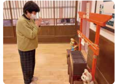
生きがい神社へ初詣