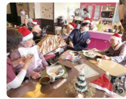
たくさん食べました