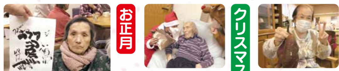
書き初めをしました!