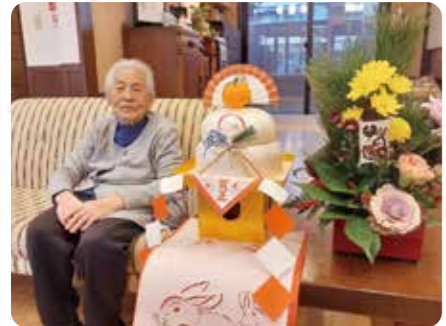
あけましておめでとう！

新年明けましておめでとうございます。今年もよろしくお願い致します。 生きがい広場地蔵堂では今年も生きがい神社への初詣や福笑いなどのお正月行事で盛り上がりました！