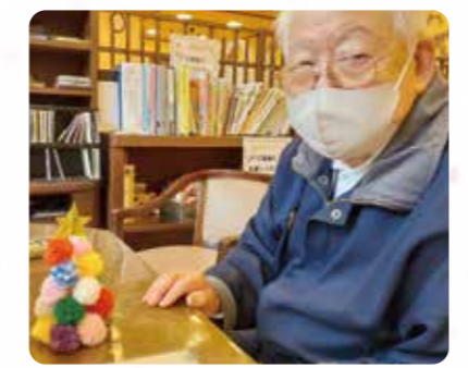
手作りのクリスマスツリー☆