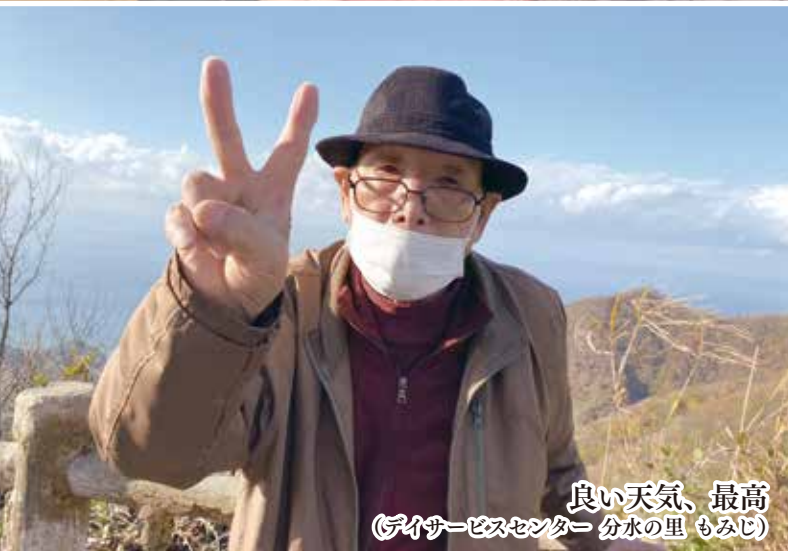
良い天気、最高 (デイサービスセンター 分水の里 もみじ)