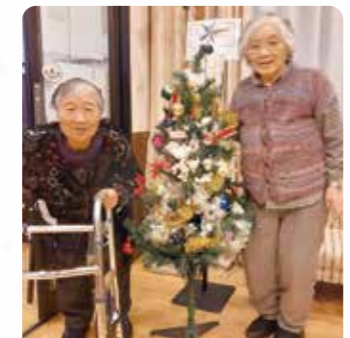
ツリーとハイポーズ☆