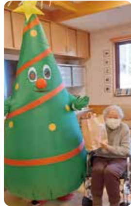
ツリーがプレゼントをくれました！