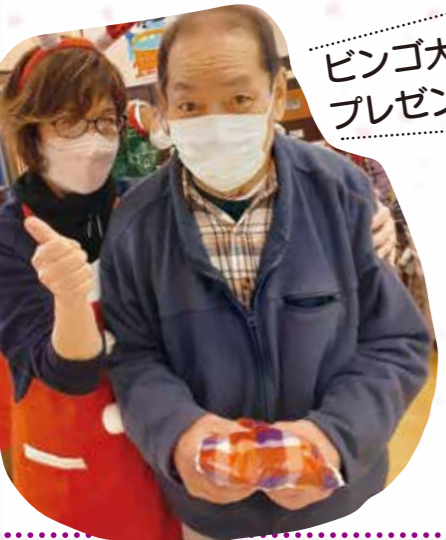
ビンゴ大会でプレゼントGET！