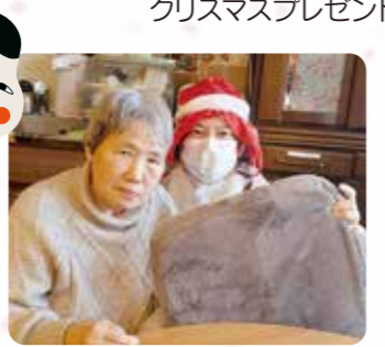
皆様どんなプレゼントをもらいましたか?