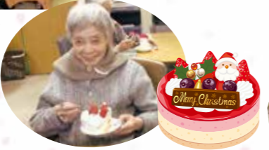
ケーキも美味し かったですね!