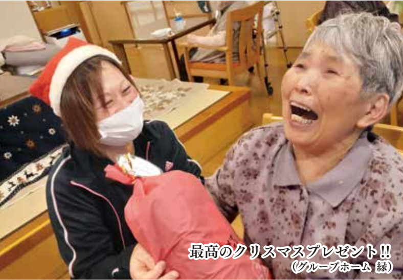
最高のクリスマスプレゼント!! (グループホーム 縁)