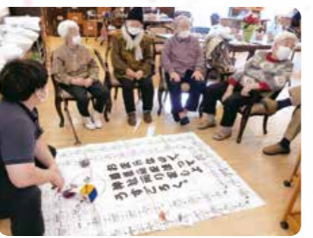
お正月恒例すごろく大会