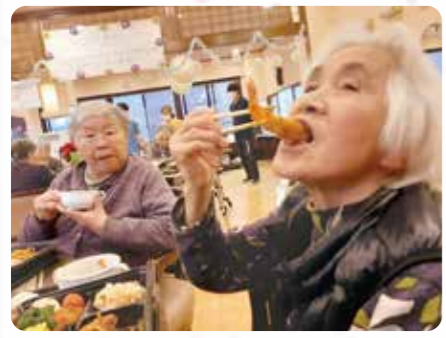
ごちそういただきます！