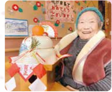
今年もよろしくお祈りします