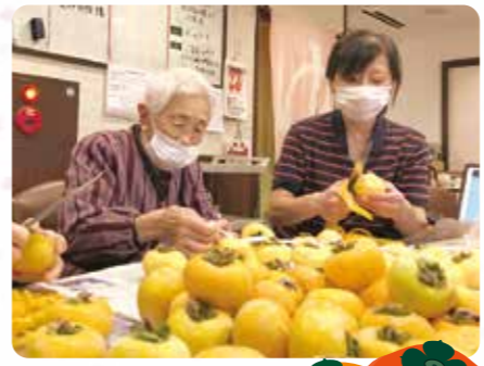
干し柿を作りました！