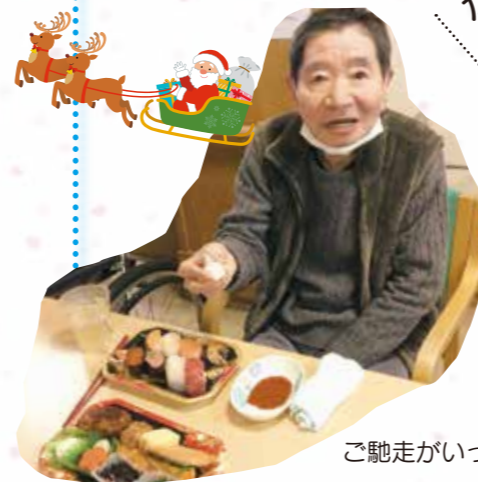
ご馳走がいっぱい