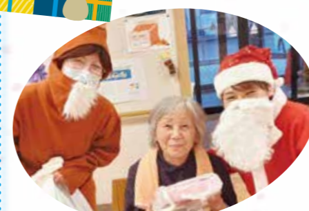
うれしいプレゼント