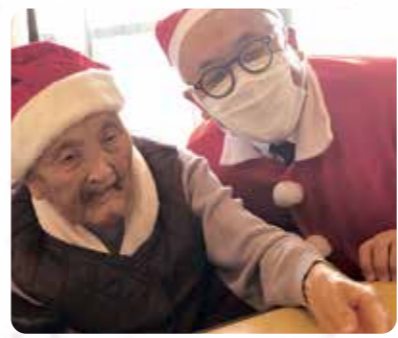
サンタクロースがやってきました！