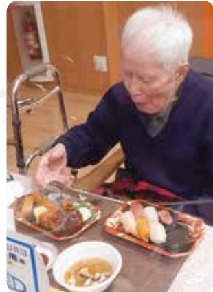
ごちそうが届きました！

忘年会は中止になりましたがおいしいご飯を食べながら皆様と一緒に楽しい時間を過ごさせていただきました。 皆さま今年も風邪に気を付けて沢山の思い出を作りましょう。