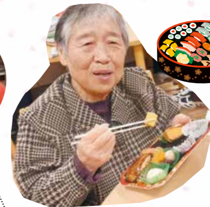
お弁当美味しく いただきました