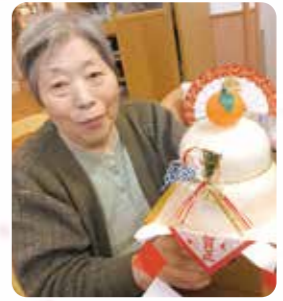
皆さんと飾って正月を楽しみました