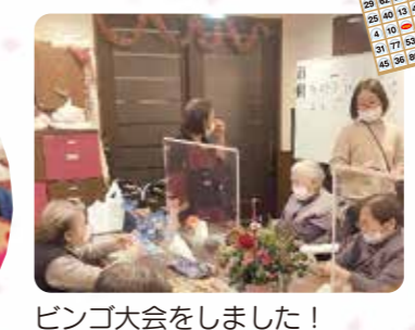
ビンゴ大会をしました！