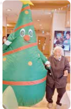
ツリーが遊びに来てくれました。皆さんピククリされてました！