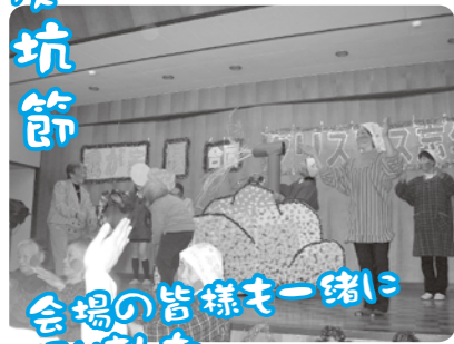
会場の皆様と一緒に踊りました。