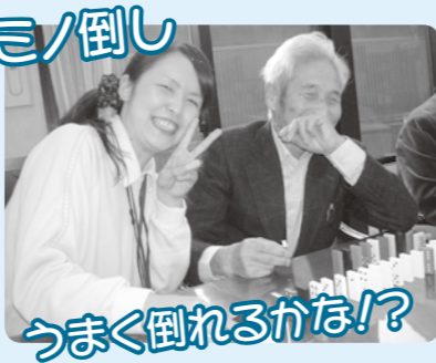
うまく倒れるかな!?