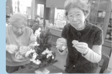
ツリーの飾りつけ!