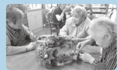
皆で飾りつけの相談中