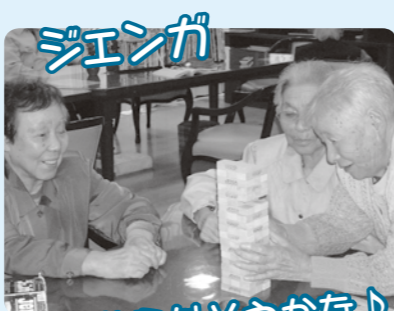
どこから外そうかな♪