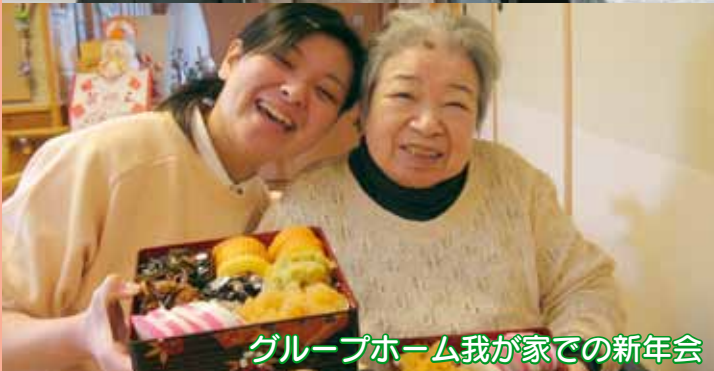
グループホーム我が家での新年会