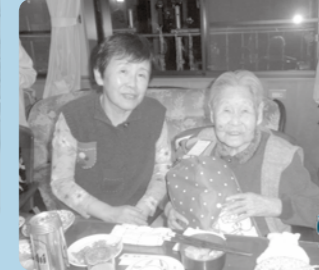
クリスマスプレゼントをもらって笑顔!!