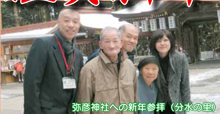
弥彦神社への新年参拝 (分水の里)