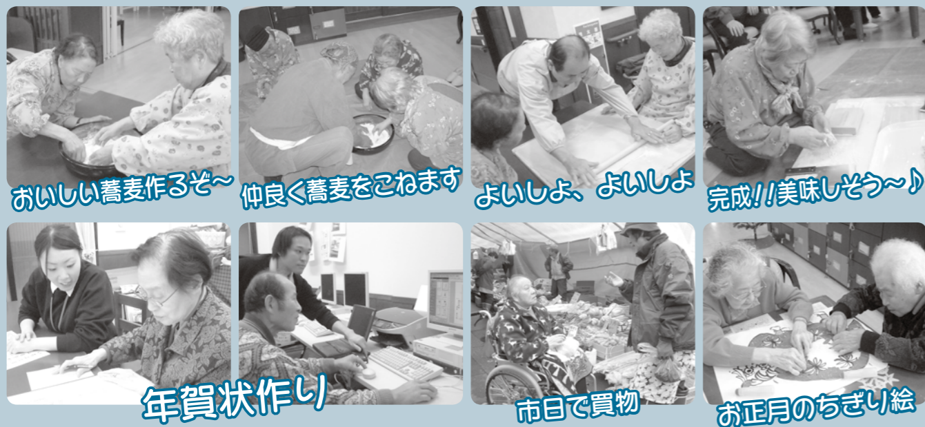
おいしい蕎麦作るぞ〜