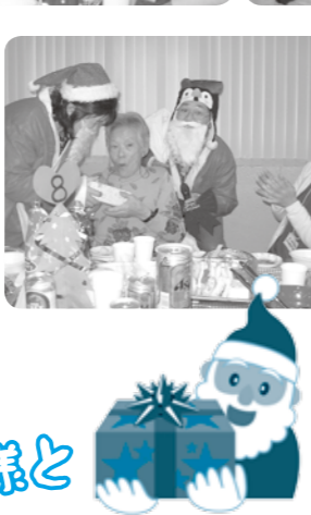
プレゼントありがとうございます