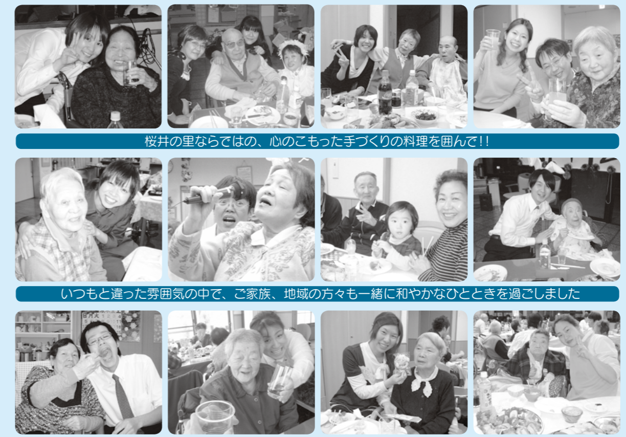
桜井の里ならではの、心のかもった手づくりの料理を囲んで!! いつもと違った雰囲気の中で、ご家族、地域の方々も一緒に和やかなひとときを過ごしました