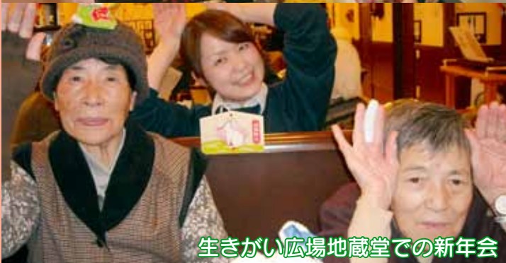
生きがい広場地蔵堂での新年会