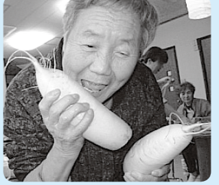
うんめ〜ろ〜♡と大根をべろり!

大根を洗って、縛り、干す所から...手慣れた手つきで、あつという間に大根が干されました。美味しい沢庵が出来ますように...♡