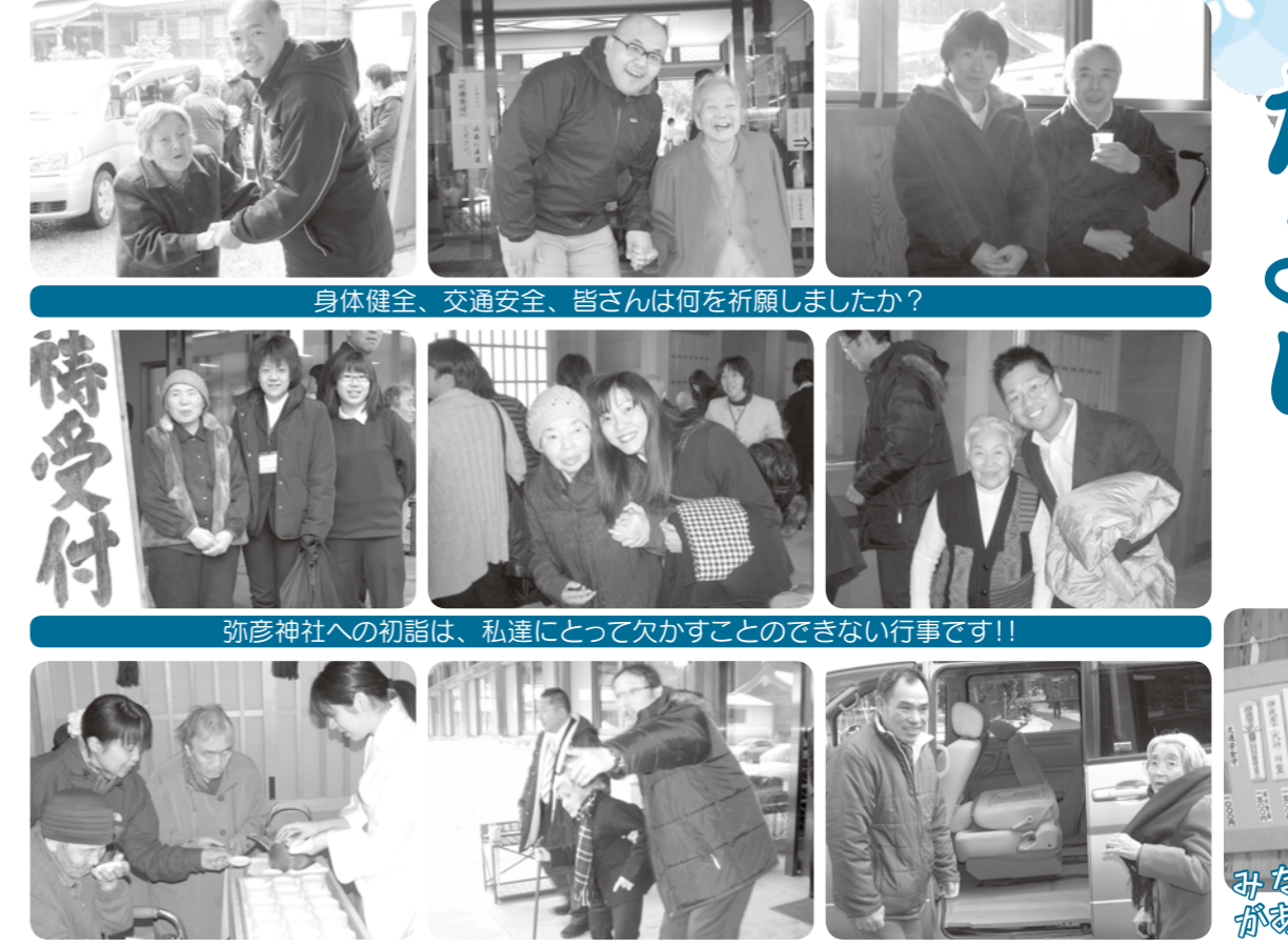
身体健全、交通安全、皆さんは何を祈願しましたか? 弥彦神社への初詣は、私達にとって欠かすことのできない行事です!! みなさまに御利益がおりますように!!

どうぞ本年もよろしくお祈りします。ついに本格的な冬の到来ですね。私たちにとって、「弥彦神社初詣」は毎年の恒例行事ですが、願いごとは、毎年一緒だったり、そうでなかったり…。でも、きっと成就しますよね。