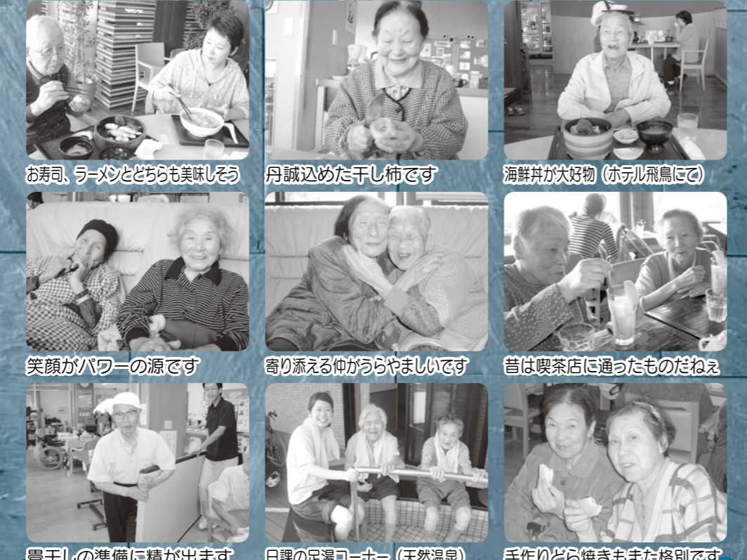
お寿司、ラーメンとどちらも美味しそう 丹誠込めた干し柿です 海鮮丼が大好き (ホテル飛鳥にて) 笑顔がパワーの源です 寄り添える仲がうらやましいです 昔は喫茶店に通ったものだねえ 畳干しの準備に精が出ます 日課の足湯コーナー (天然温泉) 手作りどら焼きもまた格別です