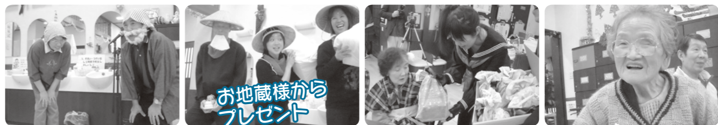
お地藏様から プレゼント