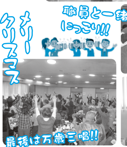
職員と一緒に1っさー!!!