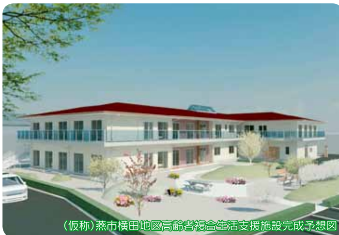
（仮称）燕市横田地区高齢者複合生活支援施設完成予想図

尚、工事が進むことで、多くの方々にご迷惑をおかけすることもあるかと思いますが、ご協力の程、何卒よろしくお願ひいたします。