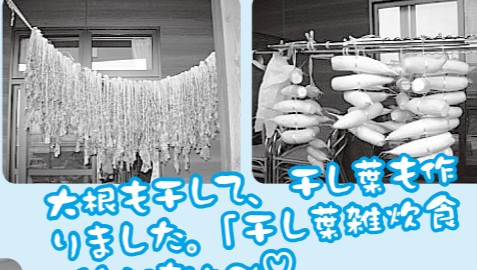
大根を干して、干し葉も作りました。「干し葉雑炊食べたいなあ〜♡」