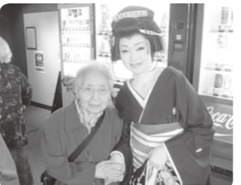
三条観劇「また行きたいね」