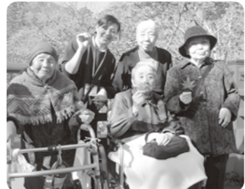
もみじを持ってパチリ!