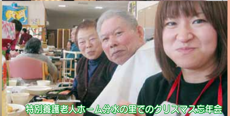
特別養護老人ホーム分水の里でのクリスマス忘年会