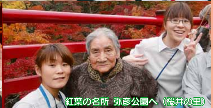
紅葉の名所 弥彦公園へ (桜井の里)

「一人の最大の不幸は、貧しさや病ではない。誰からも必要とされていないと感じることである」というマザーテレサの言葉があります。どんな状況であってもご利用者の「そのままの姿」が無条件で認められる価値観、場所づくりが桜井の里福祉社会の理念。「もう一つのわが家づくり」「人として当たり前の生活の目指すところ」。 桜井の里福祉社会は、いつもこの理念に立ち返りながら、歩みを続けて参ります。これからも皆様のお力添えをお願い申し上げます。