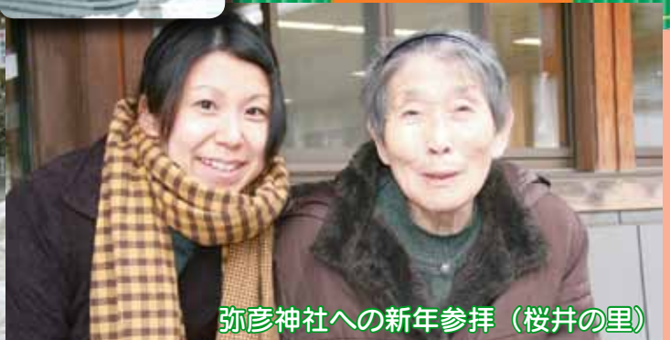
弥彦神社への新年参拝 (桜井の里)