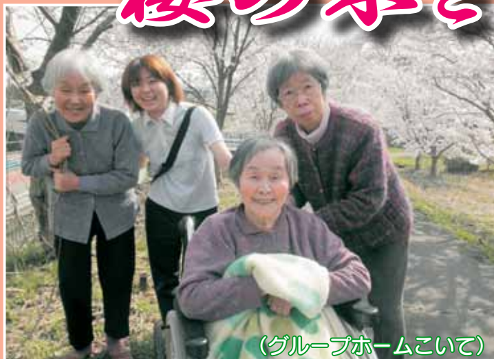
(グループホームこいて)