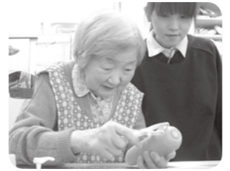
ユニット絆も皆様のおかげで一年たちました