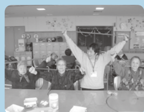
さあ、皆さんで体づくり