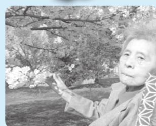
ほら見て、こんなに咲いてる