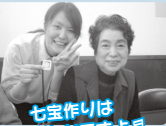
七宝作りは楽しいですよ!