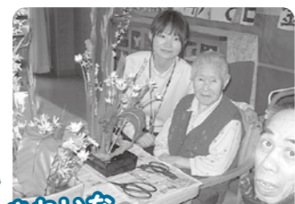
きれいな花の前で、パチリ!!