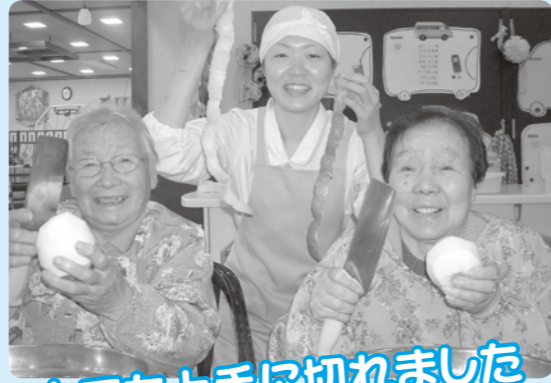
とても上手に切れました