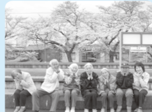
ポーズをとったらかわいくなった