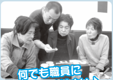
何でも職員に聞いてください!