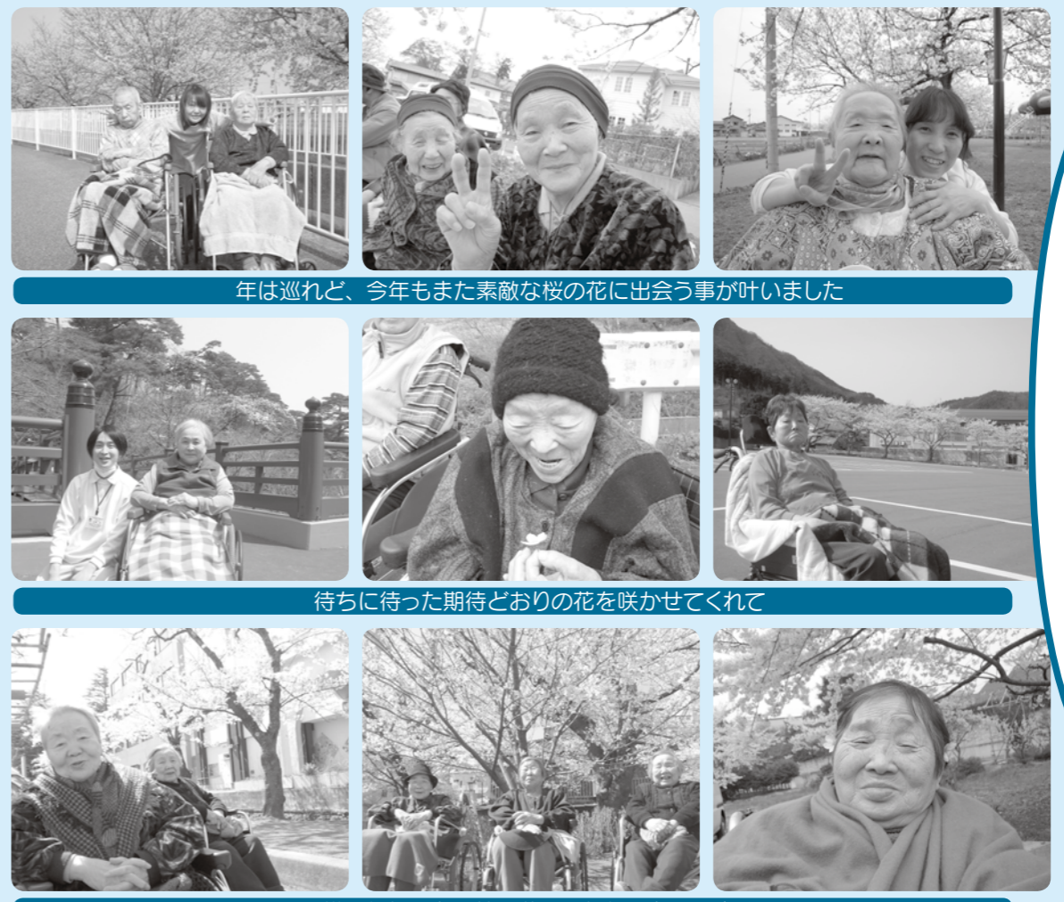
年は巡れど、今年もまた素敵な桜の花に出会う事が叶いました