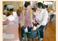
▶今度どこまで行こうかね