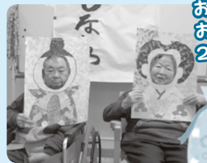
お内裏様〜とお雛様〜お2人並んで〜月ウツワフツワ♡