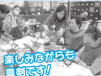
楽しみながらも真剣です!