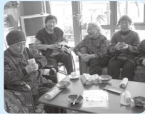
毎回喫茶が楽しみです