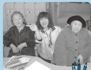
塗り絵をされたり、しゃべったり