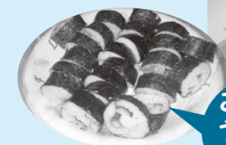
こんなにうまく巻けました