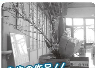
先生の作品!! いや〜さすがです。