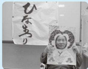
キレイに写ってるかしら？