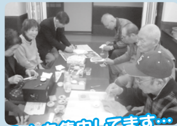
みんな集中してます...

自分で作る七宝焼き。出来上がった時の喜びは格別です! 世界で1つだけの七宝です!