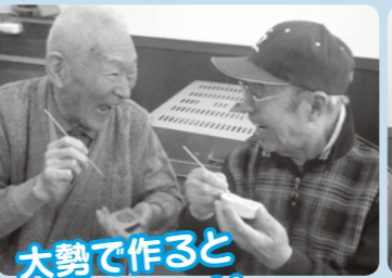
大勢で作ると楽しいな~!!