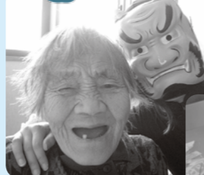
鬼とのツーショット!