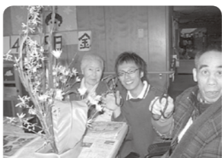
自由に思いのままに