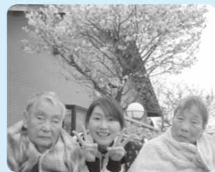
庭先にもキレイに咲いた