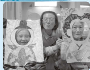
もみじの3人官女いかがですか？