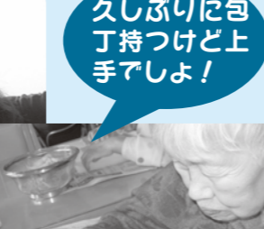
久しぶりに包丁持つけど上手アしょ!