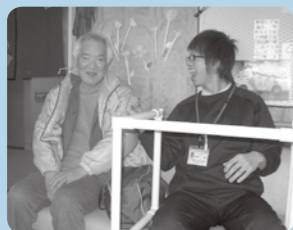
今日も楽しかったですかぁ〜