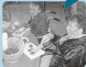
ケーキの苺を切りました