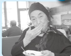
美味しゅうございます♡