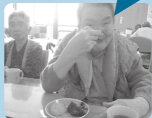
おはぎを作りました