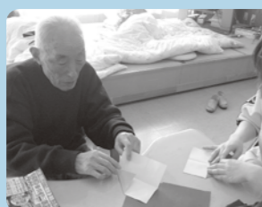
折り紙も手の運動