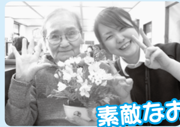
素敵なお花ができました!

講師、職員と一緒にみなさんでお花作りを創作しています。お花と向かい合い、癒されながらお花作りを通じて心の充実を図られています。作った作品は、お持ち帰りされ帰宅後ご家族と楽しんでいます。