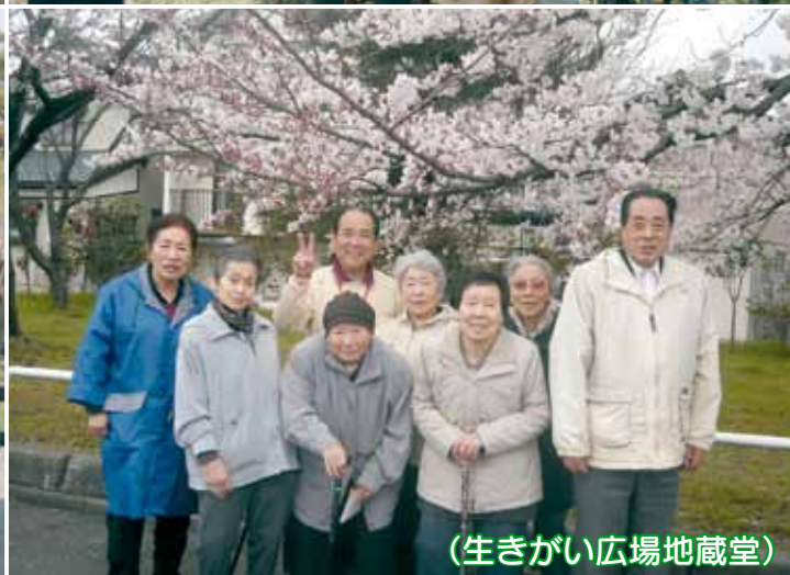
(生きがい広場地蔵堂)