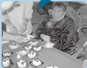
もう少しでできあがり!