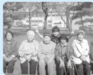
ハイ、皆様いい顔して〜