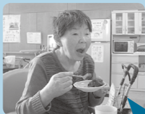
また作りたいですね