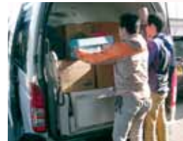
第2陣は4/18に出発しました(現在は第5陣まで予定)