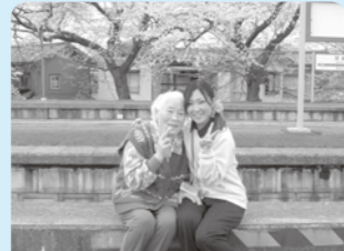
いつも仲良くハイチーズ