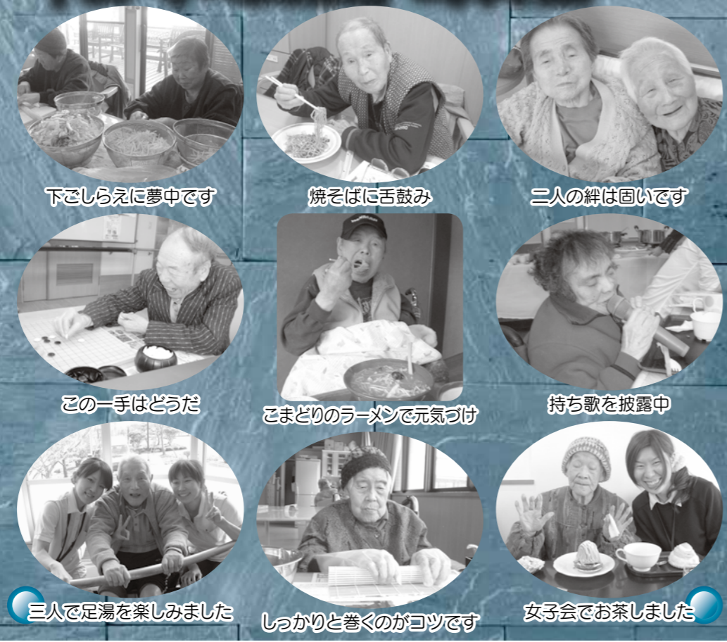
下ごしらえに夢中です 焼そばに舌鼓み 三人の絆は固いです この一手はどうだ こまどりのラーメンで元気づけ 持ち歌を披露中 三人で足湯を楽しみました しっかりと巻くのがコツです 女子会でお茶しました