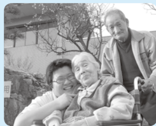
ほれ、ほれこっち向いて