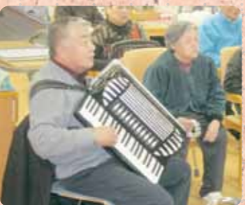
声高らかにアコーディオン歌の会