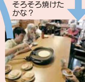
そろそろ焼けたかな?