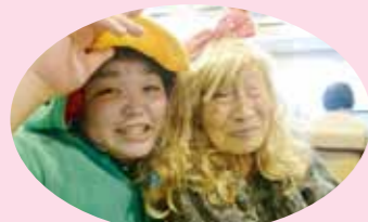
お姫様を守るカッパです

はな広場では多くのご利用者様、ご家族も参加され職員も仮装し、大盛り上りの忘年会になりました。