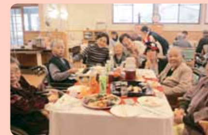
ご馳走がいっぱい!!