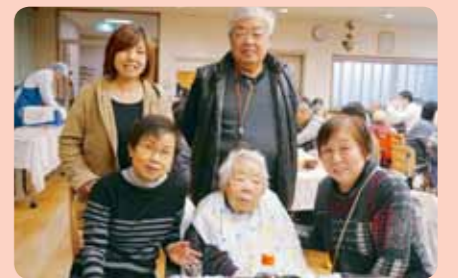
今年も家族一緒ですね