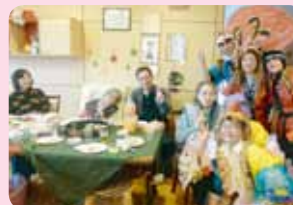
ご家族と食べたり、飲んだりして楽しみました!!