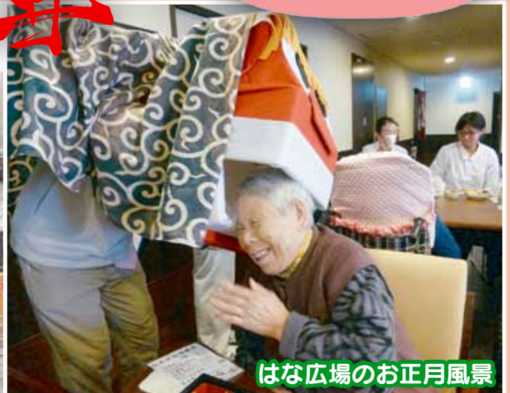
はな広場のお正月風景