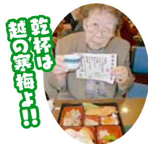
乾杯は 越の家梅よ!!