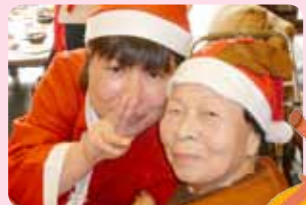
サンタとトナカイですね