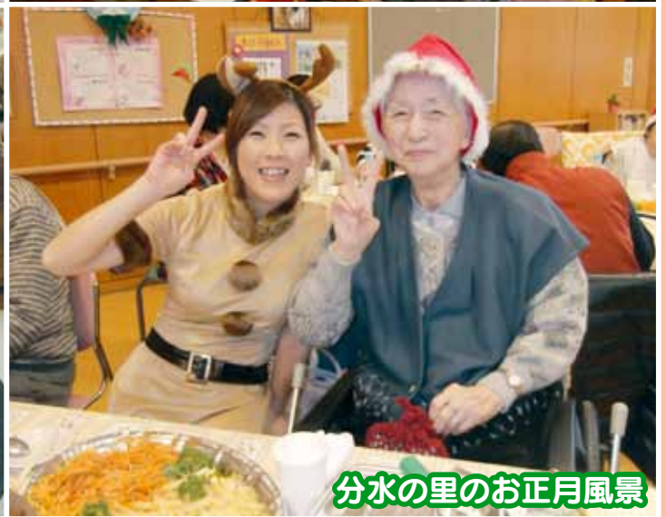
分水の里のお正月風景