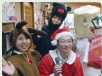
ふなっしーも登場