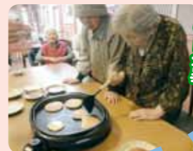
上手くひっくり返せました。