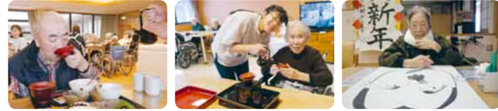
本年もよろしくお願いいたします