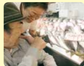
この大きい魚で決まり!!