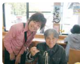
あんたも食べなせ!

クリスマス忘年会 今年も我が家でアットホームなクリスマス忘年会♪アコーディオン演奏♪サンタからプレゼント♪笑顔いっぱい楽しい時間でした♪