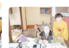
着物美人と一緒に書初め