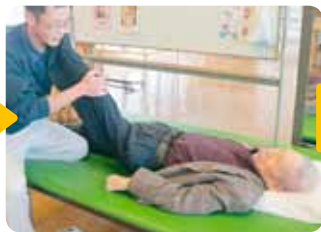
リハビリの必要性に目覚めた頃の様子