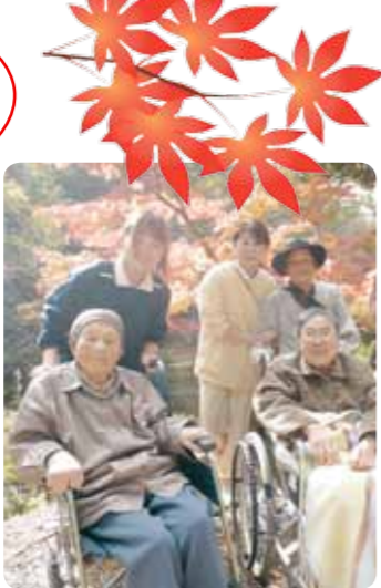
とっても綺麗だよ~