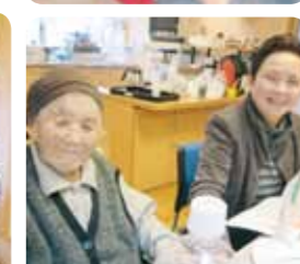
皆で歌うと賑やかで楽しいねえ