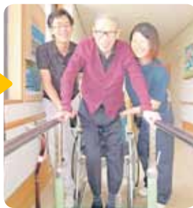
も以前より熱が入りました リハビリスタッフとの訓練