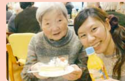
食後には大好きなケーキ♪