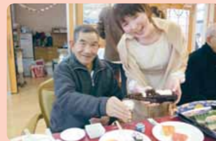
お寿司を前にビールがすすみますね