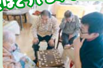
男同士の真剣勝負!