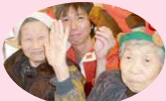
クリスマスと言えばチキン!