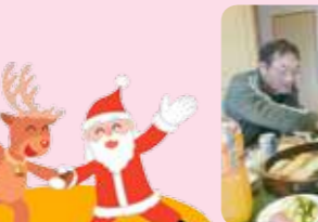
今年も1年ご苦労様でした