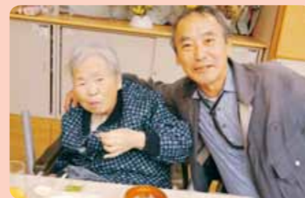
親子で過ごす日は格別です♪