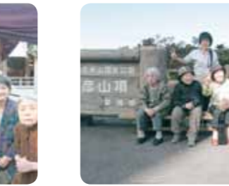
頂上まで来ました!!