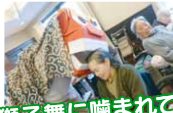
獅子舞に噛まれて 無病息災