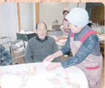
地域の方々からの各施設喫茶のお手伝い