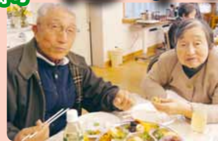
ご夫婦そろって年忘れ!!