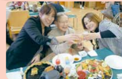
今年もお世話になりました。かんぱ〜い!