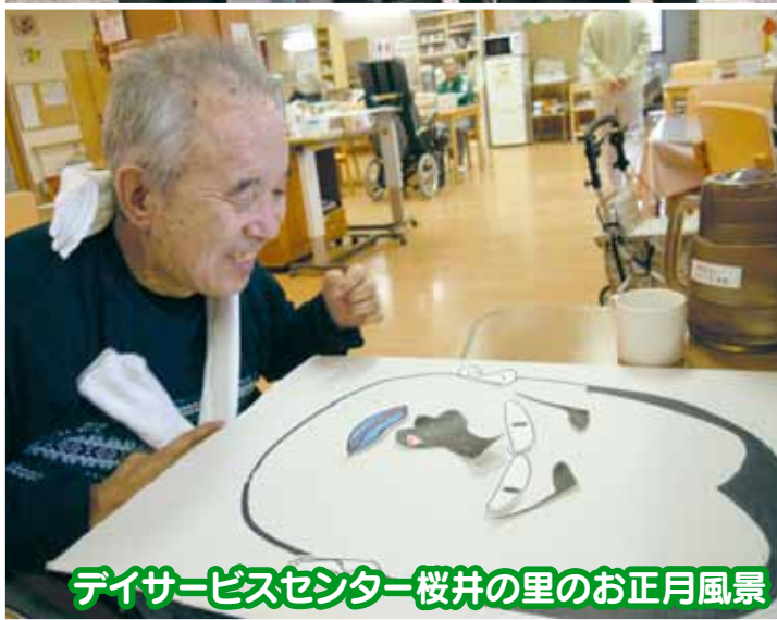
デイサービスセンター桜井の里のお正月風景