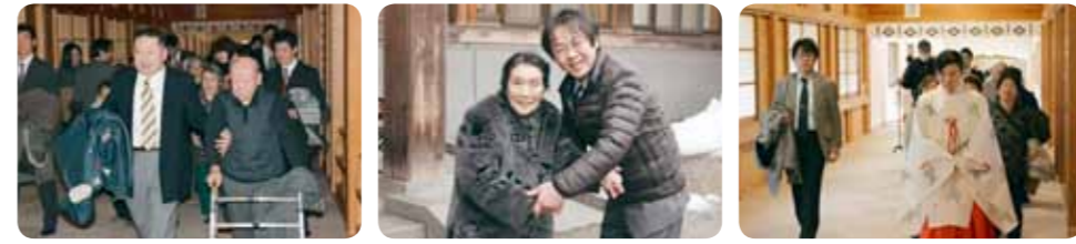
何事も“うま”くいきますように…

1月8日、毎年恒例となっているご利用者・職員合同の弥彦神社参拝へ出掛けました。今年も一年「無病息災」を祈り、素敵な年をスタートさせました。元旦はおとそで長寿を願い、またお正月行事として、福笑いや書初めなどを行い、皆さんと一緒に楽しみました。