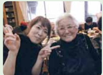
手芸の先生も一緒に!