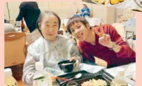
美味しい料理を前に顔がほころびます