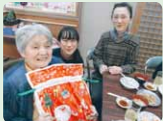
プレゼントありがとうございます (運営推進委員より)