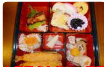
お品書きと共に、豪華なおせちをみんなで満喫!!