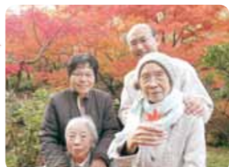
私と紅葉どっちが綺麗?