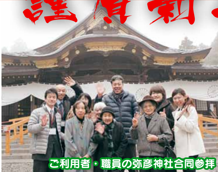
ご利用者・職員の弥彦神社合同参拝