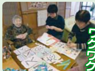
大きな飾り付けを作成中!