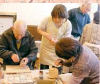
どろんご会様らによる「陶芸教室」