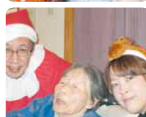
サンタからの素敵なプレゼントが届きました♪思わずにっこり