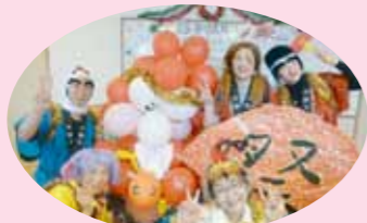
職員も仮装しました