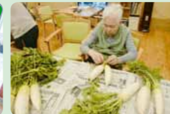
美味しいたくあん作ります!