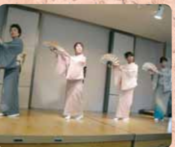
弥彦妓芸協同組合様の見事な踊り