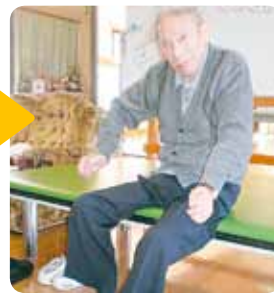
腹筋もつき体幹の維持、座 位も取れるほどに