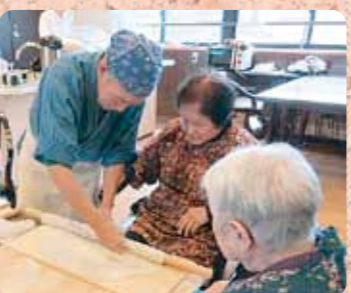
そばの実もオリジナル! 「そば打ち教室」