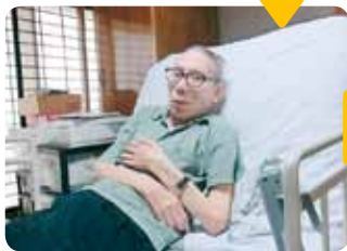
ご自分で電動ベッドを操作し、寝起きできるようになった頃

ご利用者の声に耳を傾けるのが私達の基本姿勢ですが、その生の声を直接聞いていただくことでより正確に参加者に伝わったことと思います。法人としましては、職員一人ひとりがそれらの持つ意味、意義を改めて噛み締め、日々の業務に精進したいと思います。