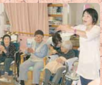
「笑いヨガ」で免疫力をアップ!

ボランティアの皆様方のご支援のおかげで 元気と温もりあふれる毎日を過ごしております