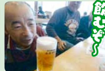
太古の湯恒例の男子会