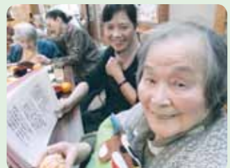
カラオケもいいですね!