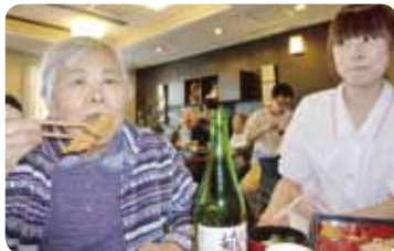
大きなお口で、ぱくっ♪