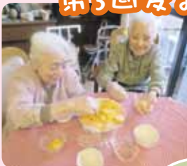
この日のためにさし柿も用意しました