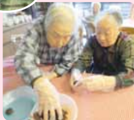
あんこを丸めて上手に包んでよ