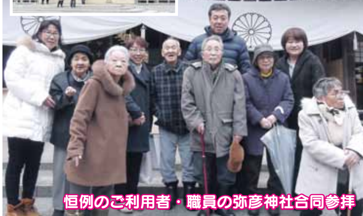
恒例のご利用者・職員のみ彦神社合同参拝