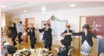
最優秀賞をかけて、職員の余興も例年以上に力が入りました!!