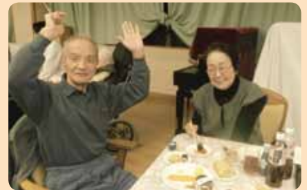
総勢45名のたくさんの地域の方々、ご家族に参加して頂き一緒に年忘れ!!