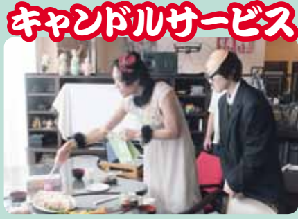
キャンドルサービス

12月20日に生きがい広場地蔵堂のクリスマス忘年会が開催され昼食にお寿司、サンドイッチなどオードブル、おやつ時にケーキを食べ満足! また、利用者様参加のハンドベル、カラオケ、劇など楽しい催物がいっぱい、とても楽しい1日でした。