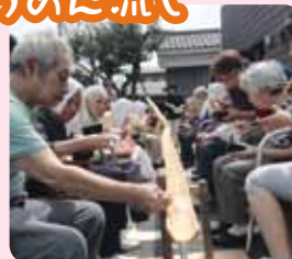
皆さん、しっかり食べてますか～