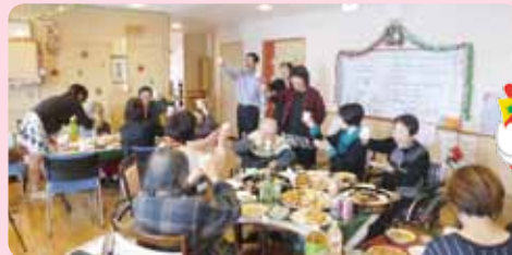
ご家族のみなさんも一緒に盛り上がりました!!