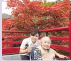
紅葉が見頃でした！