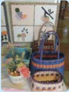
手作りの嗜好の一品