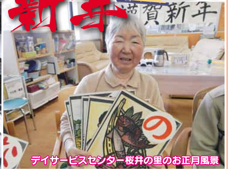
デイサービスセンター桜井の里のお正月風景