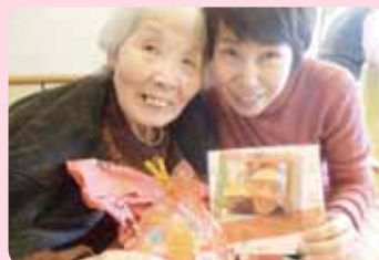
今年もサプライズなプレゼント♪♪