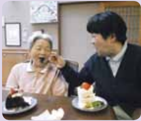
娘様からケーキを“あ～ん”

さわやかな秋晴れの日 に、菊祭りやドライブ、買 い物…とたくさん出掛けて きました。