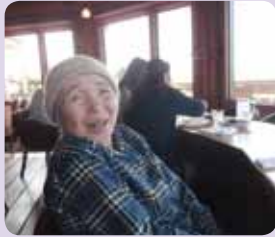
誕生日のお祝いで寺泊へ♪