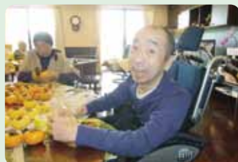
オレンちの柿獲って来たぞ!