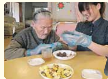
皆様と職員も一緒に新しい挑戦