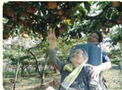
三条まで梨狩りへ♪いっぱい取りました♪