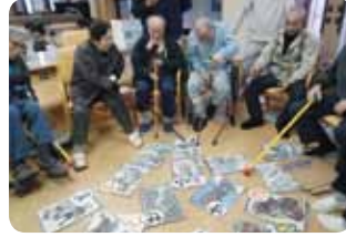
本年もよろしくお願い致します。