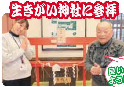
生きがい神社に参拝