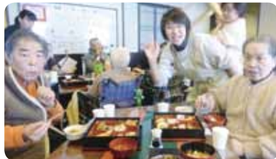
おせちの味はグーです♪