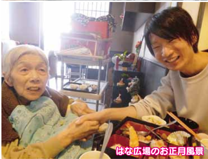
はな広場のお正月風景