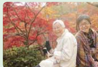
弥彦のみじ谷はとてもきれいでした。