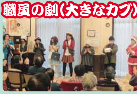
職員の劇(大きなカブ)