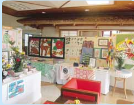
数々の作品で目が奪われました

10月には2週間にわたり、ご利用者、ご家族、職員が制作した作品を持ちより玄関ホールにて展示会を行い皆様の素晴らしい作品で華やかに彩られました。