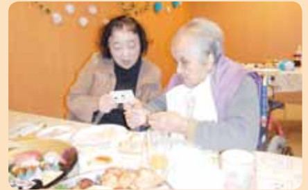
サンタクロースや日本エレキテル連合に扮した職員による出し物も大好評でした!!