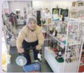
行きつけの手芸屋さんまで買い物～♪