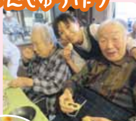
おいしくできました