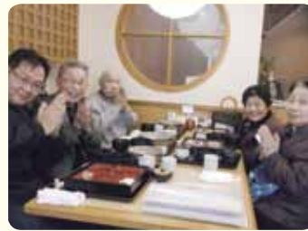
皆でご馳走様でした