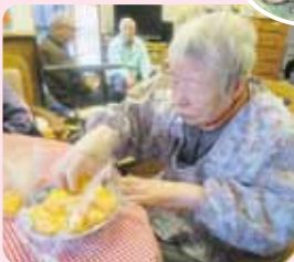
もうじきできるから待っててね