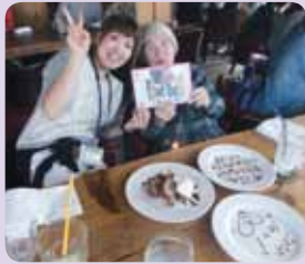
おめでとございます!!