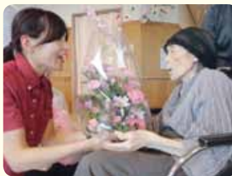
敬老の日、103回分の感謝を込めて