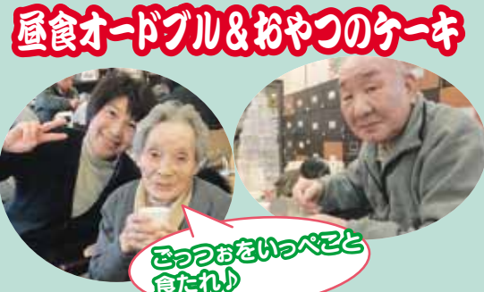
昼食オードブル&おやつケーキ