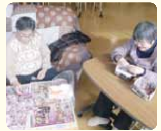
菊を一生懸命むいて、その後は美味しく頂きました