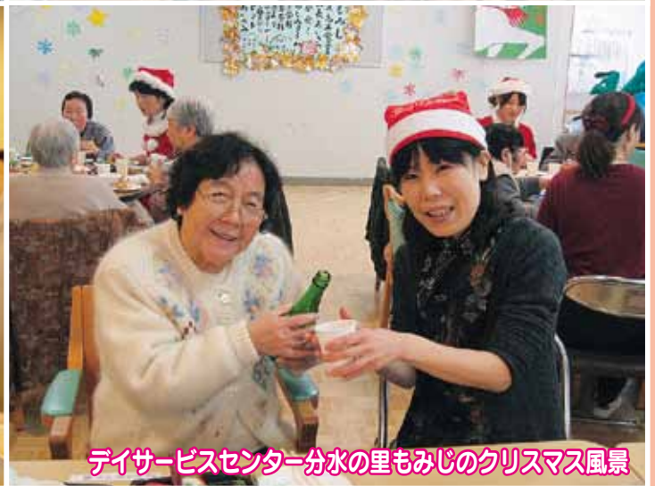
デイサービスセンター分水の里もみじのクリスマス風景

「もうひとつのわが家づくり」はまだまだ続きます。皆様には、これからも暖かいお力添えの程よろしくお願致します。