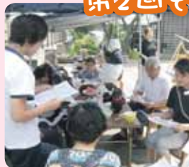
「えにし」について説明会