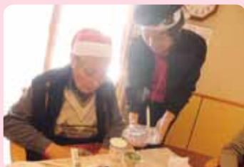
今年もお疲れ様でした