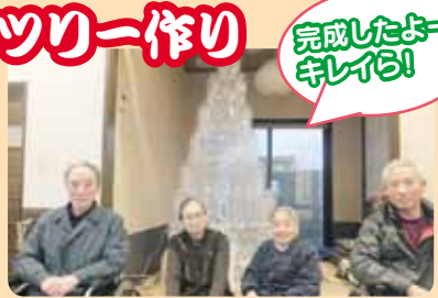
完成したよー! キレイ!