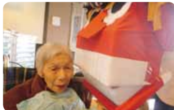
獅子舞がやって来た!!