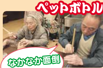
ペットボトルツリー作り