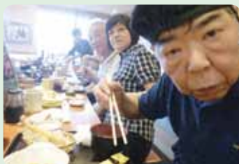
外食でお寿司。絶品でした♪♪

昨年も、いろんなイベントへ参加したり、いろんな場所へ出かけ、たくさんの思い出の詰まった1年となりました。