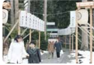
昨年以上の50名での参拝となりました。