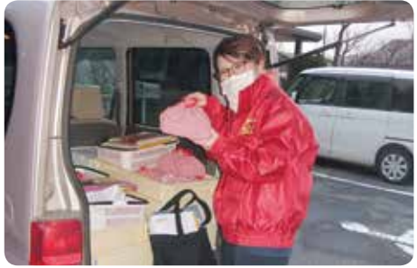
お弁当は、直接手渡しで！（安否も確認）