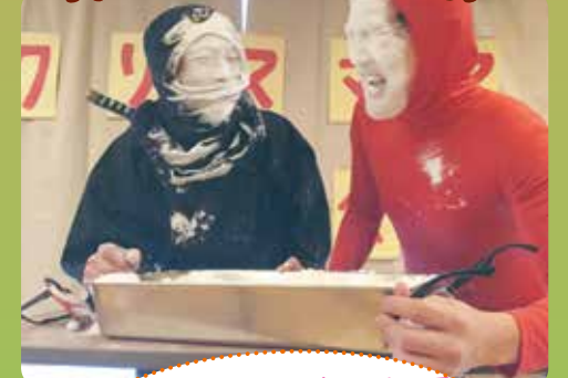
アメ探しゲームで2人とも真っ白!