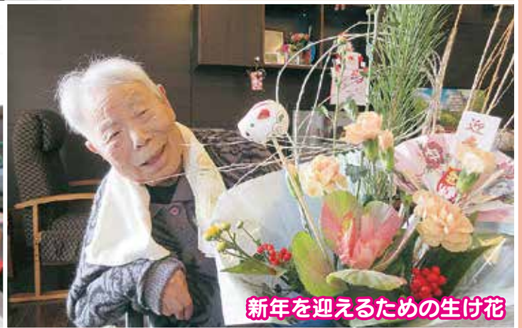
新年を迎えるための生け花

「特別養護老人ホーム桜井の里」は今年の四月に二十五周年、「特別養護老人ホーム分水の里」は十月に二十周年の節目を迎えます。これまでの法人の歩みを振り返るとき、多くの方の笑顔が目に見えます。けっして孤独な歩みではありませんでした。前から引つ張って下さった方、いつも共に歩いて下さった方、後ろから後押しをして下さった方、皆様と共に歩んだ歴史でした。この歴史を誇りとして、桜井の里福祉会は、あらためて、ご利用者お一人お一人の「もう一つのわが家づくり」を目指してまいります。