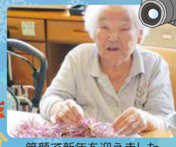
笑顔で新年を迎えました