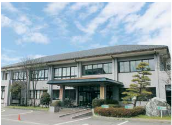
分水健康福祉プラザの2階を改修しオープン

当法人の配食サービス事業は、平成10年に弥彦村から委託を受け、施設の厨房で作った夕食のお弁当を、声を掛けながら365日休まずご自宅に届けるもので、同時に安否確認を行なっているところに特徴があります。