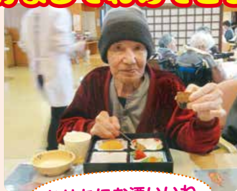
おせちにお酒いいね