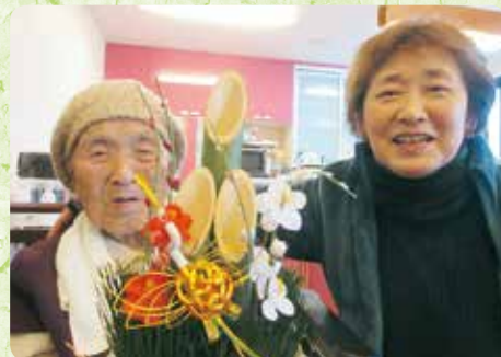
新年のごあいさつ (はな広場)