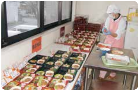
おかずの盛付風景