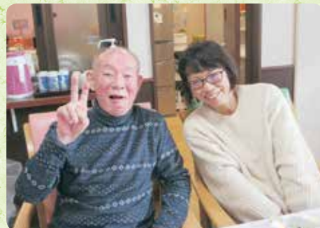
クリスマス忘年会にて娘様と一緒に (つどい)