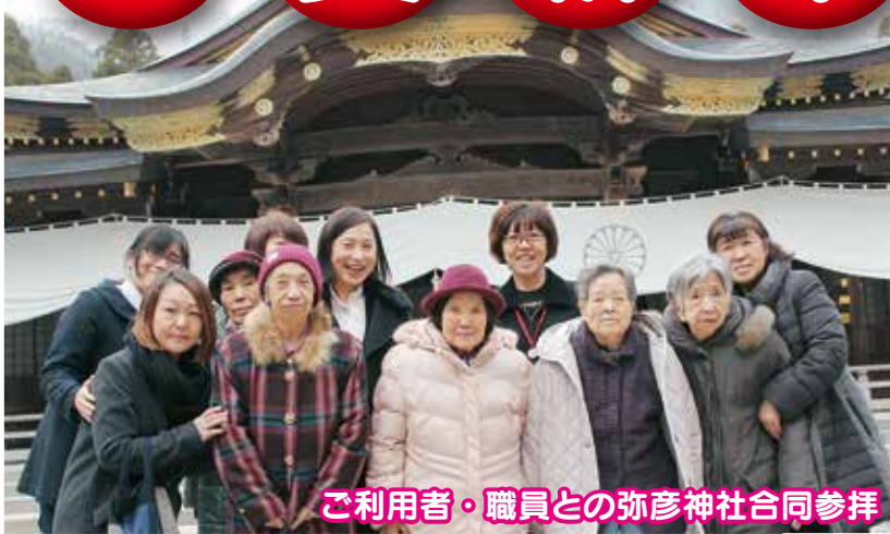
ご利用者・職員との弥彦神社合同参拝