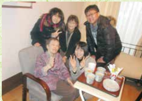
ご家族のみなさんと一緒に (つどい)