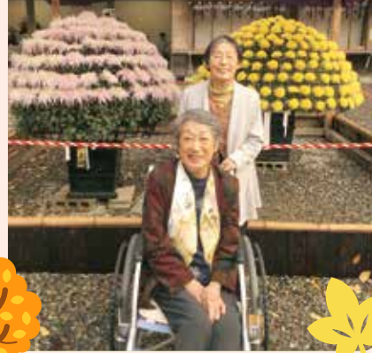
菊まつりに来ました!