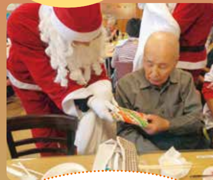
サンタクロースからのプレゼントです