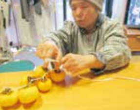
慣れた手つきで干柿作り