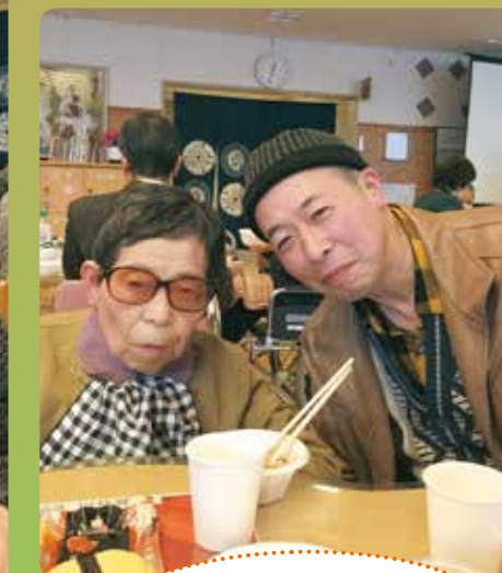
クリスマス忘年会楽しいね♪