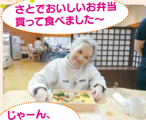
さつおでおいしいお弁当買って食べました~