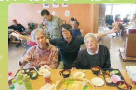
盛大な年忘れになりました！