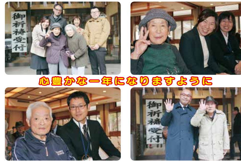
心豊かな一年になりますように

1月16日、毎年恒例の弥彦神社参拝へご利用者、職員合同で出かけてきました。昨年と比べて穏やかな天候の中、今年一年皆様の「無病息災」をお祈りしました。本年も宜しくお願ひ致します。