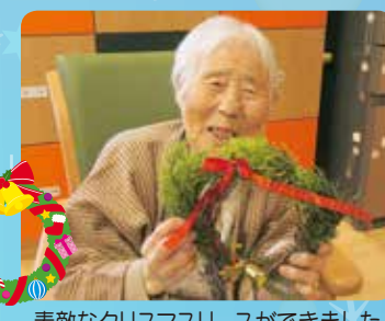
素敵なクリスマスリースができました