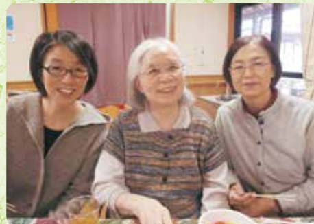
忘年会にて「美人親子でしょ?」(我が家)