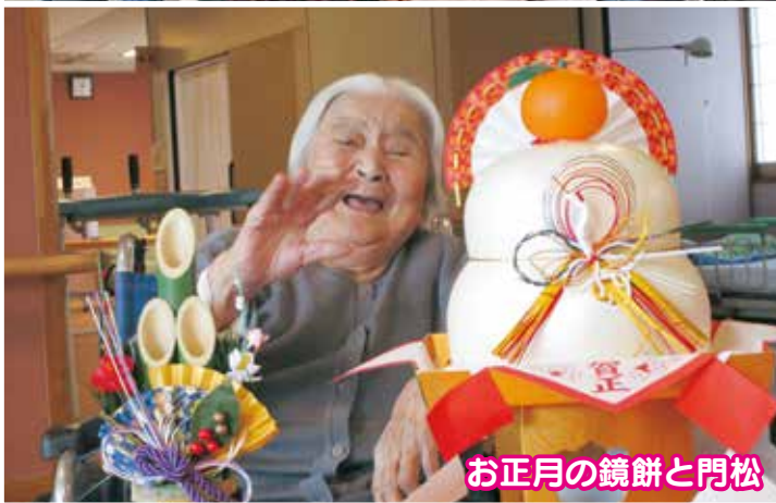
お正月の鏡餅と門松