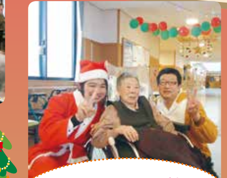
サンタとトナカイに囲まれてハイ、チーズ!