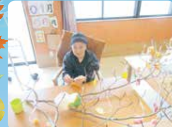
繭玉飾りをみんなでしました