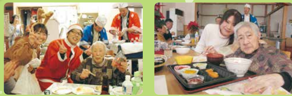
ご利用者、ご家族、職員も一緒に

12月11日に平成最後の盆年会が各フロアで行われました。当日は多くのご家族様からも参加していただき、毎年恒例となっている美味しいお寿司も召し上がっていただきました。職員による仮装や催し物等で盛り上がり、みんなで今年一年の思い出話に花を咲かせて楽しい会になりました。