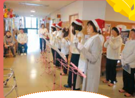
ぶんすいチェリーベルの皆様のハンドベル演奏