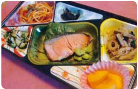
栄養価いっぱいのお弁当が一食550円から