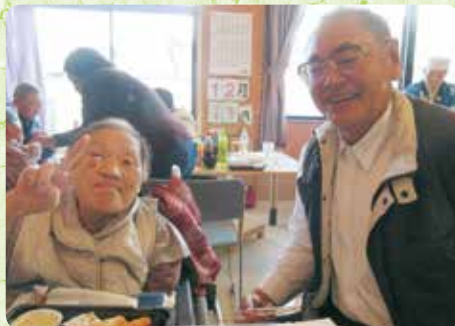
忘年会にて仲良くご夫婦で (桜井の里)

桜井の里福祉会では、日頃からお家族、ご友人、地域の方々の来園をお待ちしておりますが、特にお盆や年末年始、お誕生日にはご家族やご友人が面会に来て下さる場面が多くみられます。普段は離れて暮らすご利用者とご家族が、一緒に過ごす貴重な時間を楽しんで頂けるように、これからもささやかながらお手伝いしていきたいと思っております。