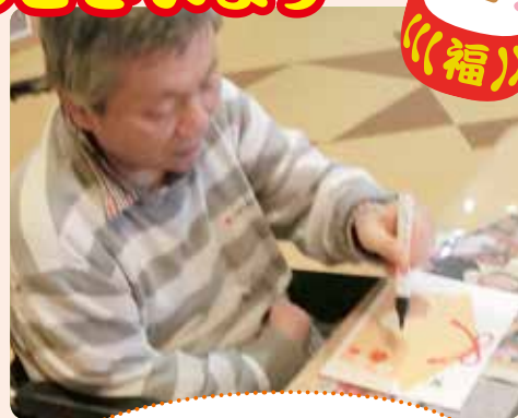
今年の目標書きます!