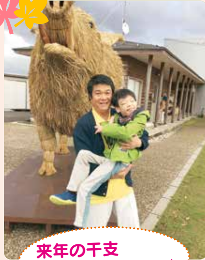
来年の干支イノシシと一緒に♪