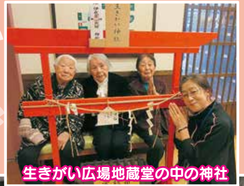
生きがい広場地蔵堂の中の神社