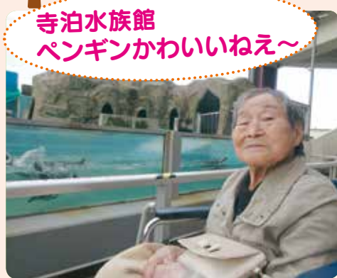
寺泊水族館ペンギンかわいいねえ~