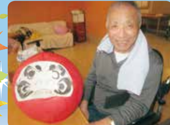
縁起物のだるまをつくりました