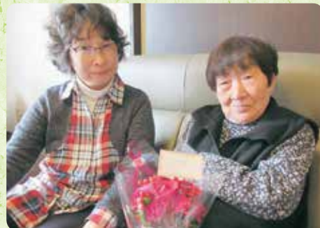
誕生日のお祝い (はな広場)