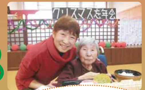
ご馳走美味しかったですよ~!

12月23日、分水の里で毎年恒例のクリスマス忘年会が開催されました。キッズダンス、職員による余興、そしてサンタクロースからプレゼントも届きました。当日はご利用者をはじめ、ご家族にも楽しんで頂きました。