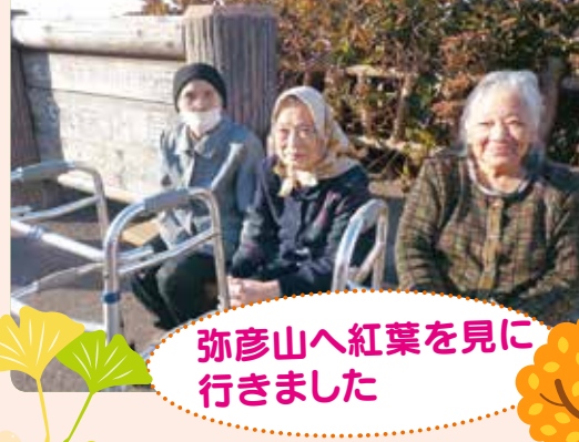
弥彦山へ紅葉を見に行きました