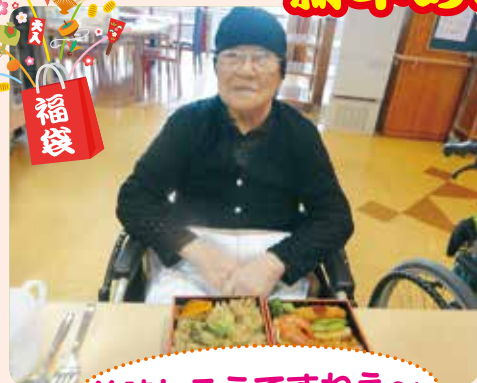
じゃーん、紅葉弁当です!