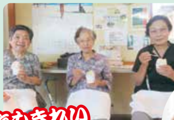
海もきれいだったよ～