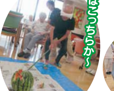
スイカはいつからか~