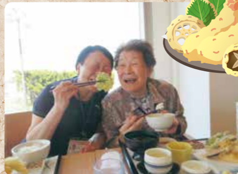
天ぷらに満面の笑み! (吉田の和楽亭 おうざん)