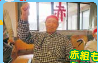
赤組も白組も負けないぞ~!

今年も各フロア、各事業所で盛大に運動会が開催されました。ご利用者の皆様、職員共に良い汗を流すことができました。