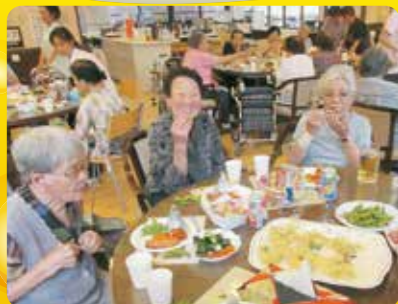
仲良しみんなで乾杯！