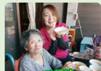
外でのご飯は美味しいよ☆