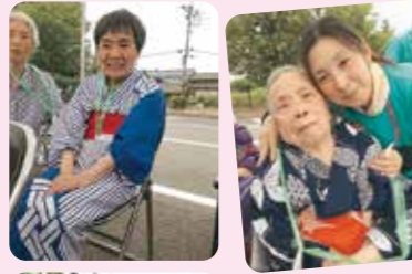
シャボン玉も遠くまで飛んでいきました。