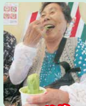
今年は抹茶にしました！