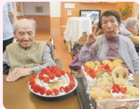
お誕生日会をしました~☆