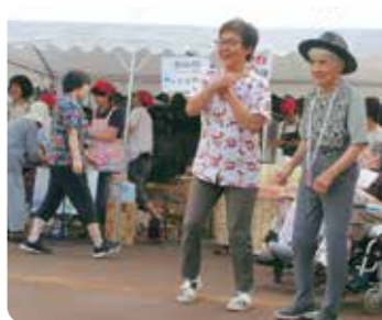
沢山の出店もあり、食べて飲んで踊って、皆で楽しい祭りを過ごしました。