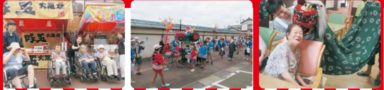
分水まつりや町内神輿、神楽に来ていただけて、ご利用者の皆様にも大変喜んでいただきました。