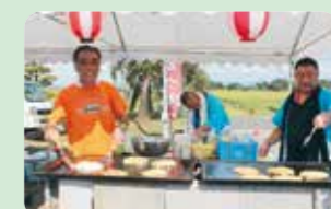
麓地区を良くする会様