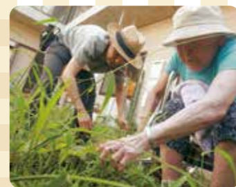
草取りをして、収穫もしました。今年も豊作！