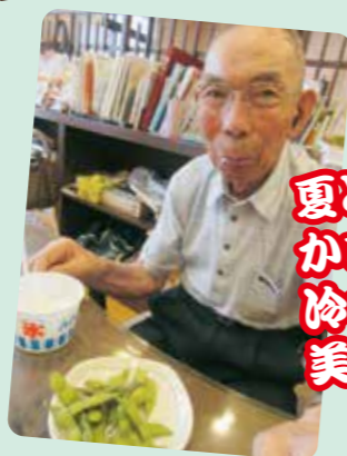
氷 夏どいたらかき氷！冷たくて美味い～！