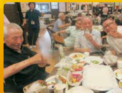
男同士積もる話もあります