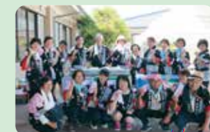
利用者と家族の会様