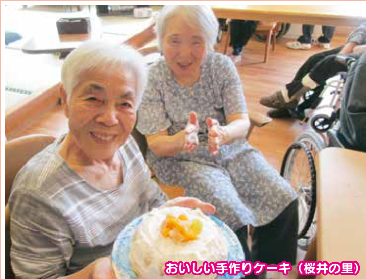
おいしい手作りケーキ (桜井の里)