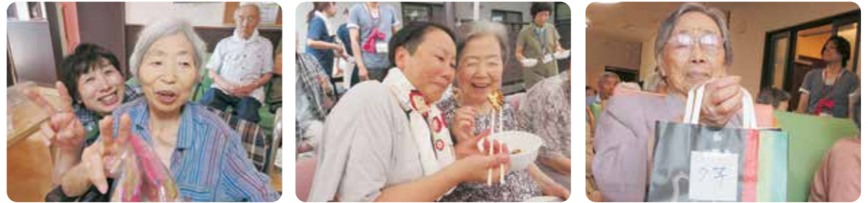
暑い中での開催となりましたがボランティア様の協力もあり踊りや太鼓、じゃんけん大会など大変盛り上がりました!