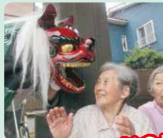
花祭りで獅子舞が来てくれました！