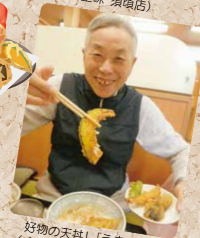
好物の天丼! 「うまい!!」 (くいどころ 里味 須頃店)