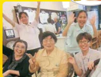
みんなでハイ！ポーズ！