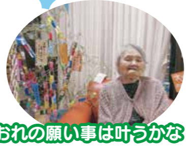
おれの願い事は叶うかな