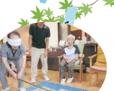
お!割れたのんねえか?