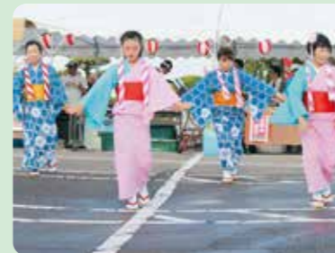
すみれ会&清踊会様