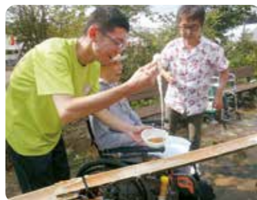
流しそうめんは今年も大盛況でした！みんなで大賑わいでしたね。