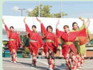
弥彦よさこい添弥様