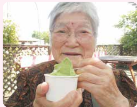
うんめ~よ!!このアイス!!