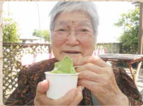
6月 岩室のジェラートを食べに外出 (ジェラテリア レガロ)

今年の夏は猛暑が続きましたが、涼を求めてジェラートに生ビール!! 夏バテどころか皆様モリモリ食欲旺盛。夏を満喫しました。