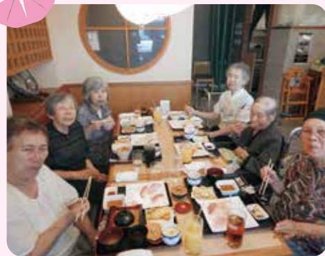
みんなで食べると美味しいですね!! (吉田おうさんにて)