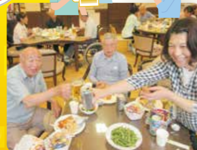
どんどん飲んでください～！