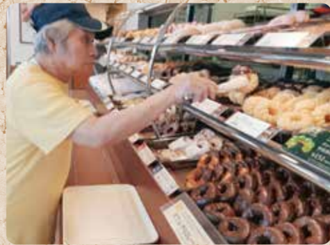
このドーナツに決めた! (ミスタードーナツ 県央ショップ)