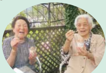
美味いアイスだね

海へのドライブ＆岩室でアイス！きれいな海に美味しいアイスで皆様とても喜ばれていました！