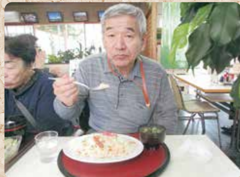
笹取り後の一食! (三条市のレストラン 太三)