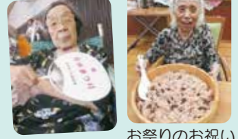
お祭りのお祝いに赤飯です。美味しいですね