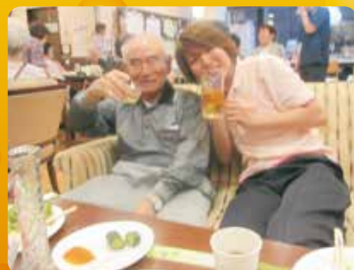
つまみが美味しくて日本酒が進むね