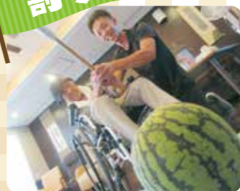
一気に振り下ろして、見事に割れました。