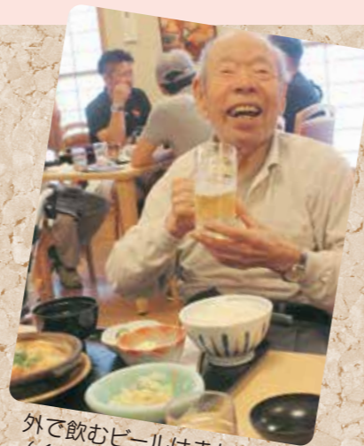
外で飲むビールはまた格別! (くいどころ 里味 須頃店)