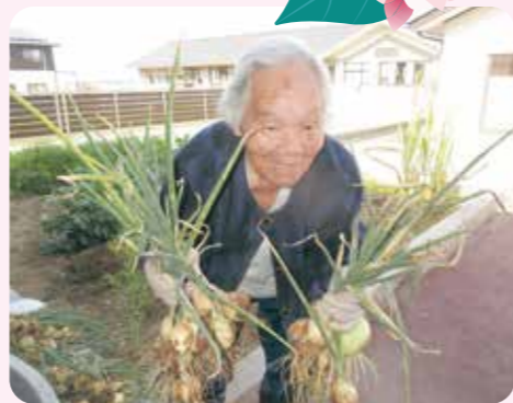
ほら!!玉ねぎがこんなに取れたよ~!!