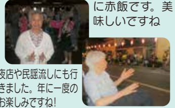
夜店や民謡流しにも行きました。年に一度のお楽しみですね!