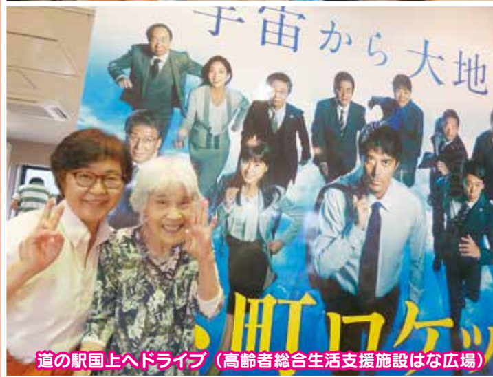
道の駅上へドライブ (高齢者総合生活支援施設はな広場)