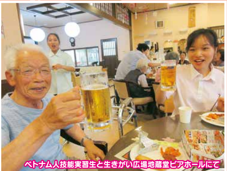
ベトナム人技能実習生と生きがい広場地蔵堂ビアホールにて