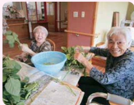
枝豆もぎならまかせなさい!