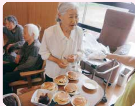
美味しそうに出来たよ~!!