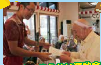
笑い声の絶えない運動会で大いに盛り上がりました!