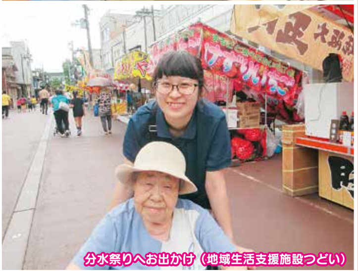
分水祭りへお出かけ (地域生活支援施設つどい)

近年、介護施設や新しい事業所では人員不足や職員の負担感の軽減という理由から行事や、催しものを行わなくなりました。しかし、桜井の里福社会ではこうした「祭り」を開催しているのは、お年寄りの笑顔が見たいから、地域の方と共に楽しみたいからと願う職員の熱き思いが原動力となり続けていることができ、新たな祭りを開催していると考えております。 法人も、働き方改革、介護の質の生産性向上、組織の世代交代に向けた若手管理職の育成等、令和という新しい年号と共に変化と進化に取り組んでいます。しかし、引き継いでいくべきこと、変えるべきでないことをしっかりと見極めて前に進んでいきます。