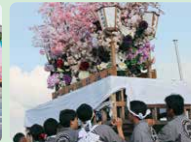
桜井郷燈籠請中様