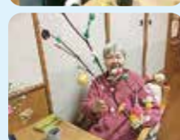
今年も福笑いも糰玉も良い出来です。