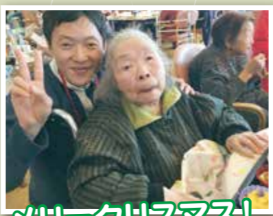
メリークリスマス!