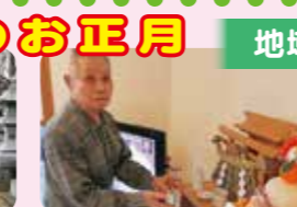
神様にお神酒をお供えして