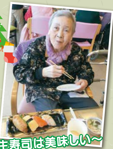
生寿司は美味しい~