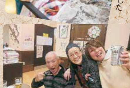
芋煮会でかんぱい!