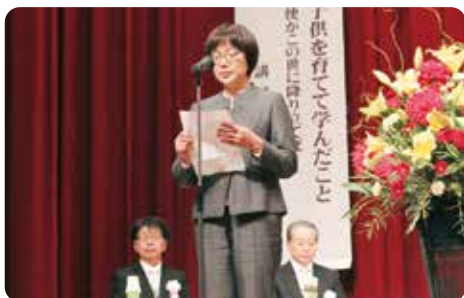
25年勤続表彰を代表して志田職員より謝辞