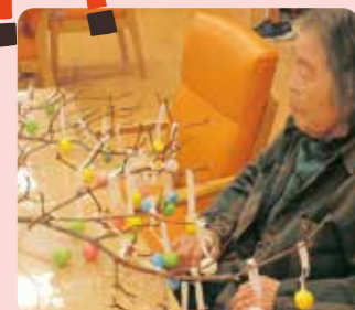
まゆ玉きれいだな～