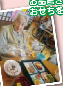
お品書きを見ながら おせちをいただきます!!