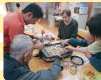
みんなでたこ焼き作ったよ