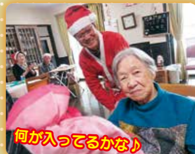
何が入ってるかな!