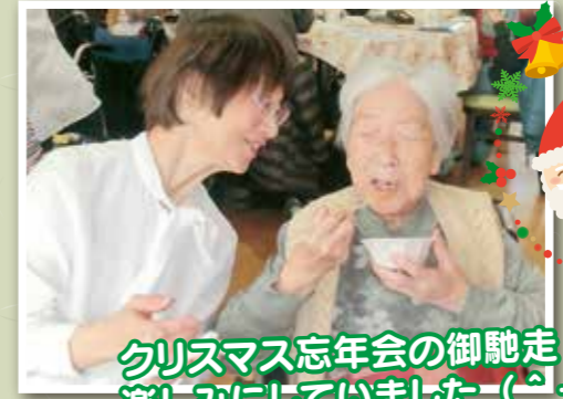
クリスマス忘年会の御馳走 楽しみにしていました(ー^)