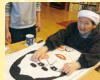
お正月行事「福笑い」