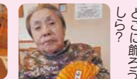
今年も宜しくお願ひ致します。本年も宜しくお願い致します。今年も健康にチユウいして、良き一年を過ごしましょう。