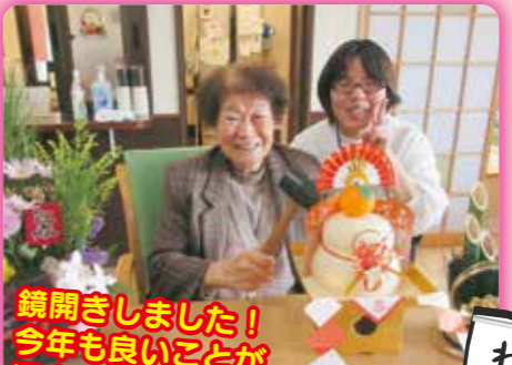
鏡開きしました!今年も良いことが沢山ありますように!