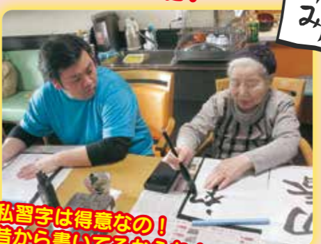
私習字は得意なの!昔から書いてるからね!