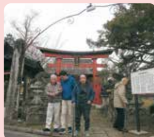
赤塚神社は昔からの心の拠りどころです