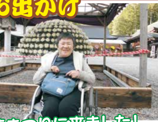
菊まつりに来ました!