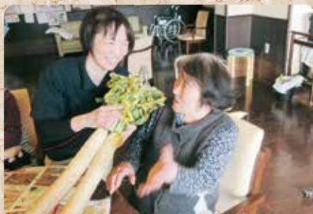
赤塚の大根で沢庵づくり