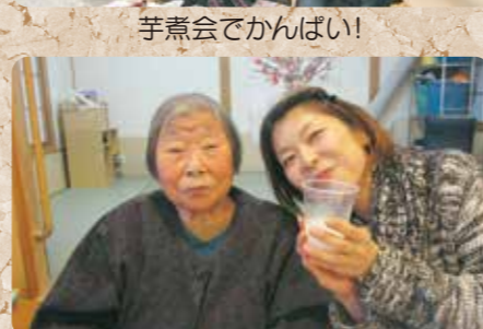
忘年会でハイチーズ!