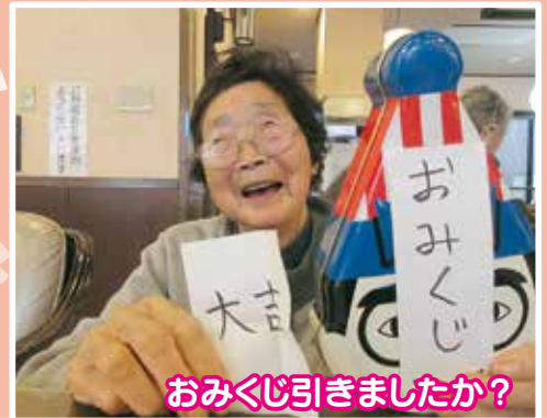
おみくじ引きましたか？