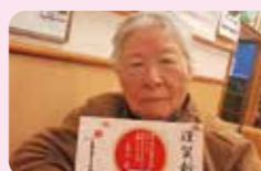
娘さん、お孫さんから年賀状が届いたよ☆