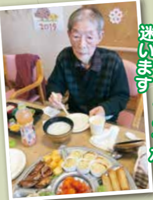
どれを食べようか 迷います