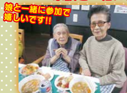
娘と一緒に参加で嬉しいですよ!!