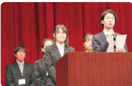
開設以来から新人までの職員リレートーク