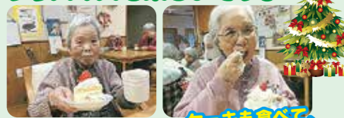
ケーキも食べて、今年もステキなクリスマスでした☆