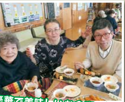
豪華で美味しいお食事でした!