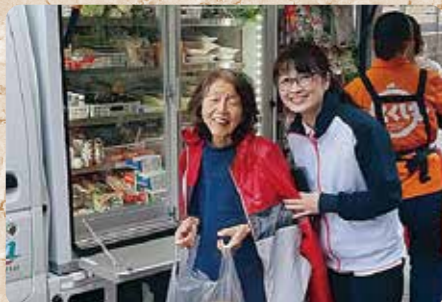
移動スーパー「とくし丸」でお買い物

日頃のご利用者や職員とのかかわりの中でとびっきりの笑顔が見られました。皆様の笑顔をご覧ください。