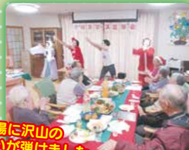
会場に沢山の笑いが弾けました