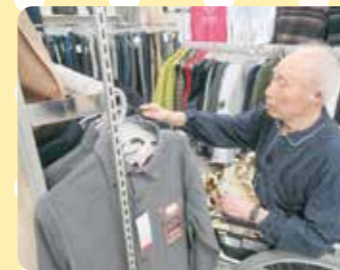
「しまむら」へショッピング