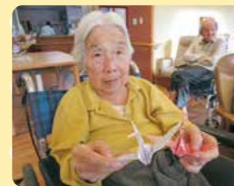
立派な鶴を折ったよ