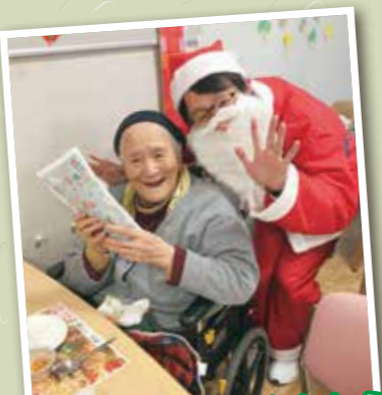
かっていいサンタさんから プレゼントをもらいました♡