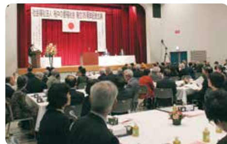
会場の燕市分水公民館