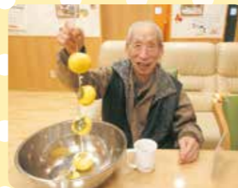
干し柿作りは任せてね