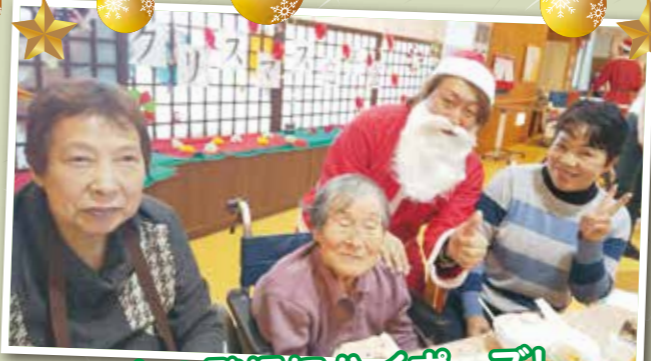
サンタの登場にハイポーズ!