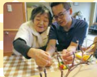
まゆ玉飾りしたよ