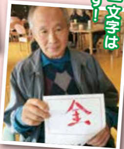
今年のシマキは これですー!