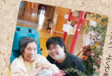
お花かんぽ。おイベントも楽しかった