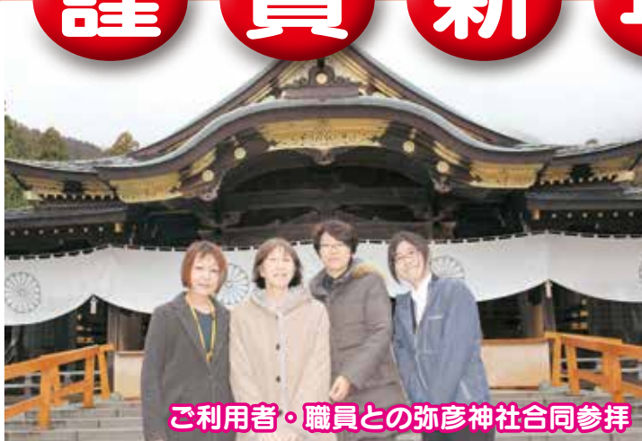
ご利用者・職員との弥彦神社合同参拝