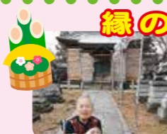
近くの神社で初詣!