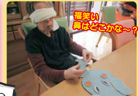
福笑い真はどこかな〜?