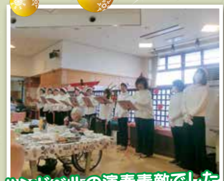
ハンドベルの演奏素敵でした!