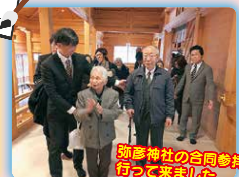
弥彦神社の合同参拝に行ってきました

つどい 地域生活支援施設 グループホームつどいの家・桜町 小規模多機能ホームつどいの家