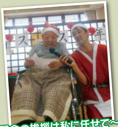
閉会の挨拶は私に任せて~!