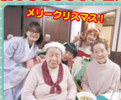
メリークリスマス!