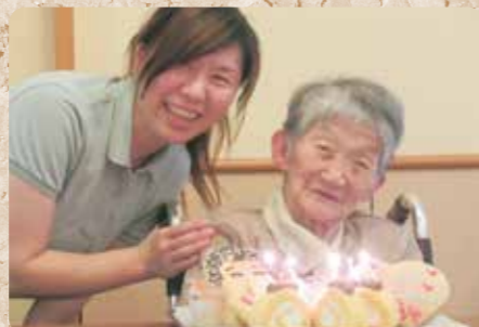
手作りケーキで誕生日のお祝い