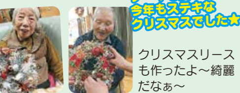
クリスマスリースも作ったよ～綺麗ななあ～

明けましておめでとうございます。今年も我が家で忘年会を行ないました。今回もご家族、地域の皆様にご参加いただき大盛り上がりとなりました。クリスマスもゆっくり楽しみました。年明けはまったり、のんびりと福笑いをしたり、糰玉作りを行いました。