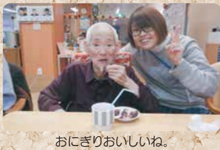
おにぎりおいしいね。