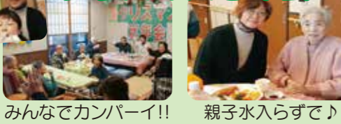
みんなでカンパ～い!!