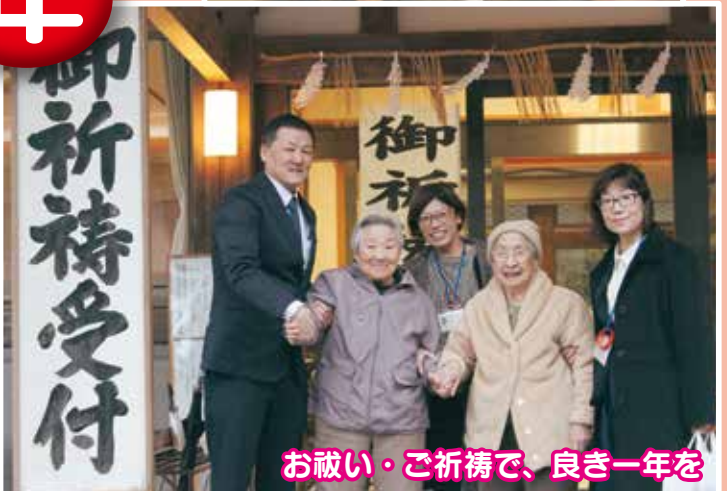
お祓い・ご祈祷で、良き一年を