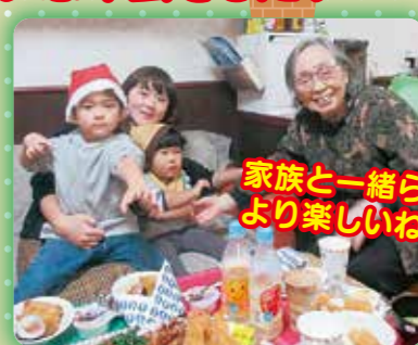
家族と一緒にとても楽しいね!