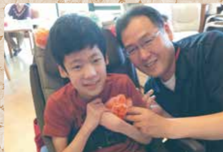
カメラ目線で!パシャ!