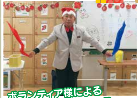
ボランティア様による 素敵なマジックショー♡