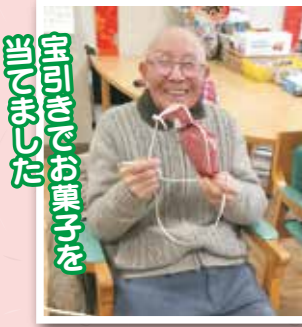
宝引きでお菓子を 当てました