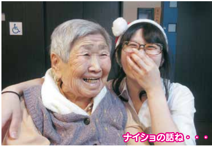
ナイショの話ね・・・