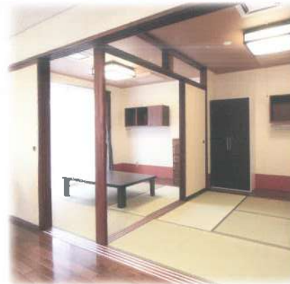
■お部屋としても活用できる茶の間