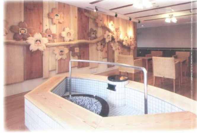
■「笑顔の花」に囲まれた「足湯のあるロビー」は地域交流の場