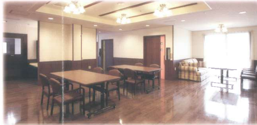
■大正ロマン風でモダンなリビング

おひとり一人が望む暮らし方を尊重し、「通い」「宿泊」「訪問」の機能を生かしながら、ご利用者が築いてきた地域や家族との関係を大切にします。