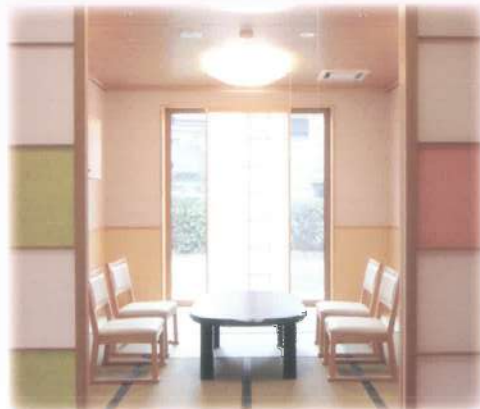
■純和風の『秋桜（あきざくら）』茶の間

ご自宅のある住みなれた地域で家庭的で安全な環境のもと、たとえ要介護の状態になっても、入居される方が自分らしく今までの暮らしを継続できるように、小規模な居住単位でも生活を支援します。