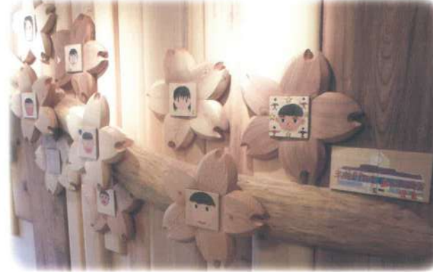
「笑顔の花」…花びらの中にある絵は、島上小学のみなさんの作品です。レリーフの一部には、東日本大震災で発生した廃材を宮城県石巻市より運び、活用しております。