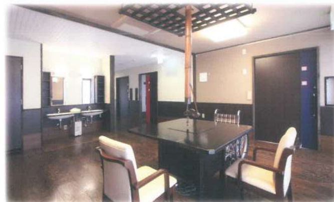
■古民家風の『夏つばき（なつづばき）』いろいろの間