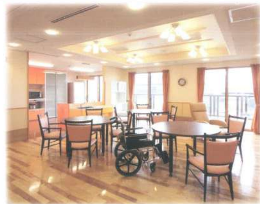
■洋風の『花みずき（はなみずき）』居間