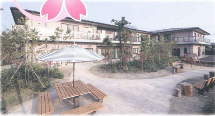
■四季折々の風情が楽しめる雑木林風の庭園

おひとり一人のこれまでの暮らしを大切に、 おひとり一人のこれからの暮らしを支えます。