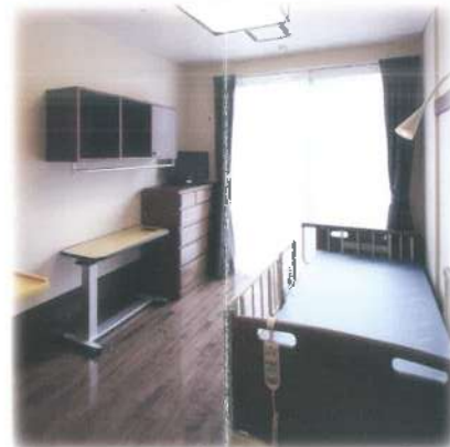
■落ち着いた雰囲気のお部屋