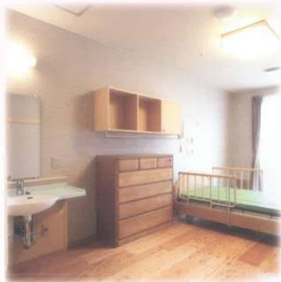
■自由に過ごせるお部屋